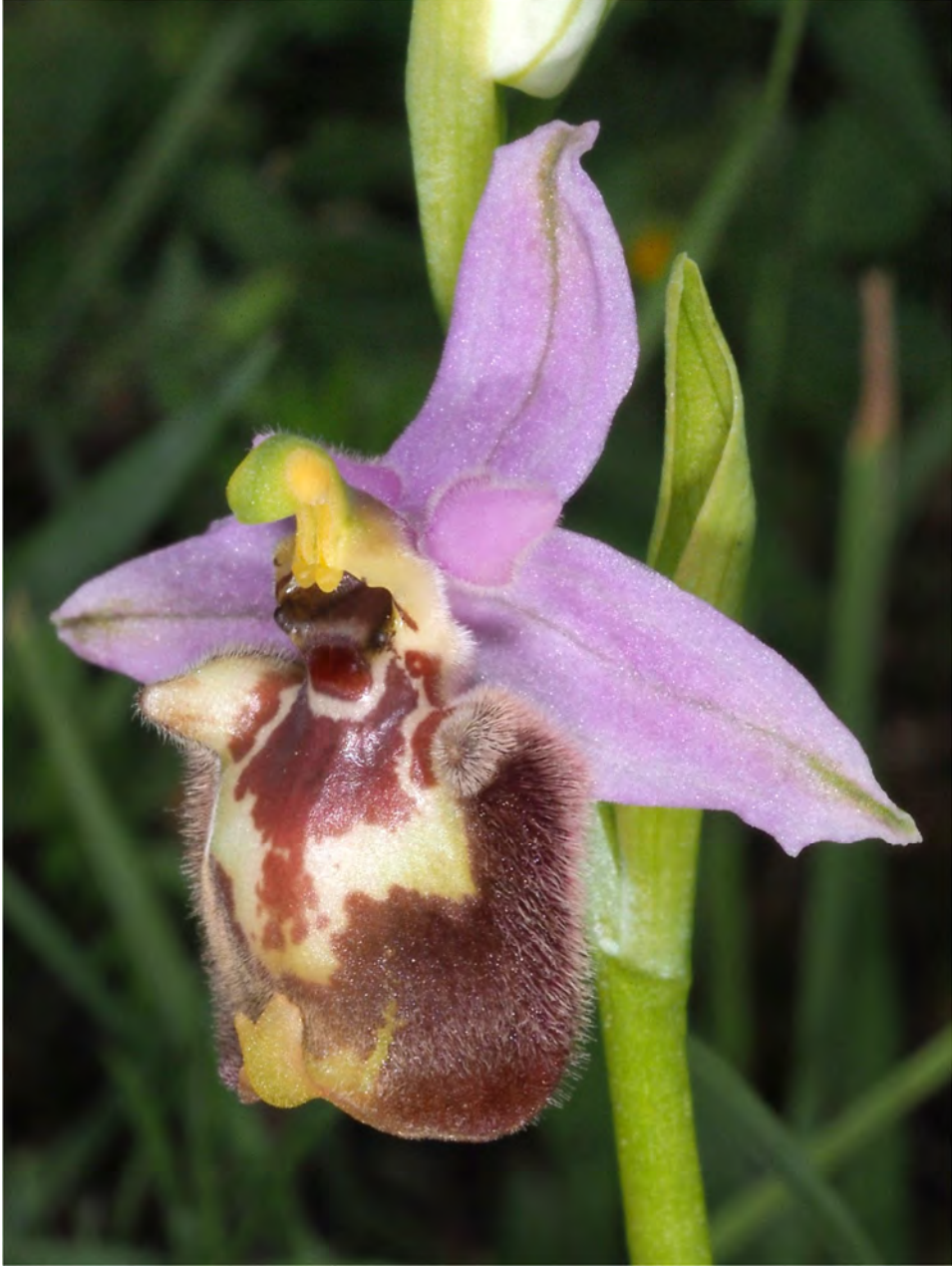
Ophrys candica subsp. candica