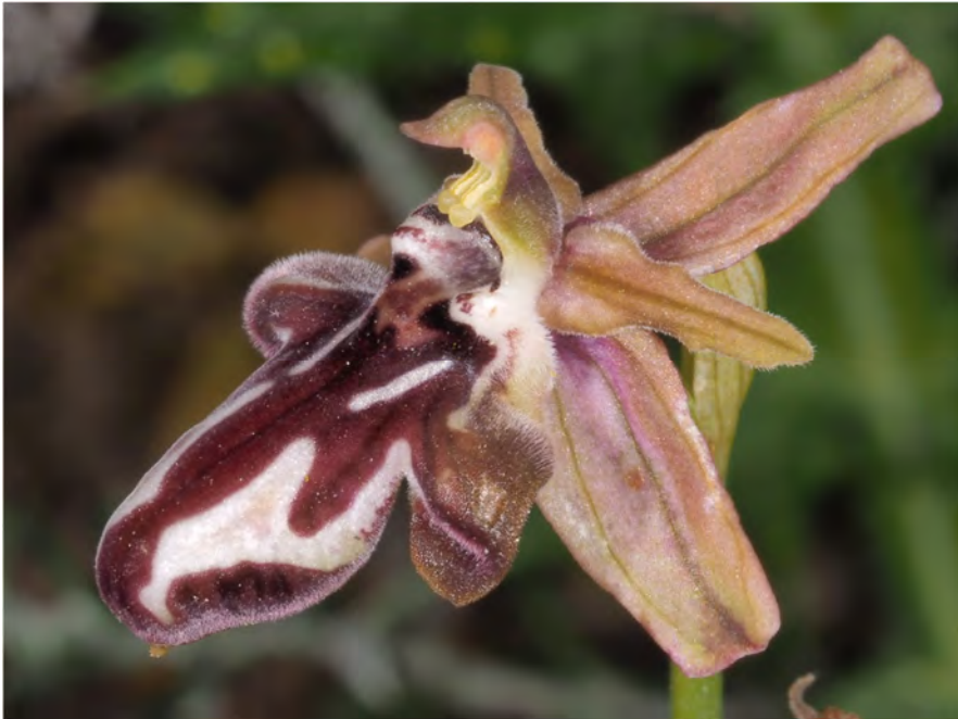
Ophrys cretica subsp. cretica