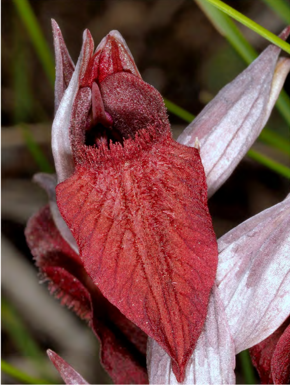
Serapias cordigera subsp. cretica am Standort KR 18