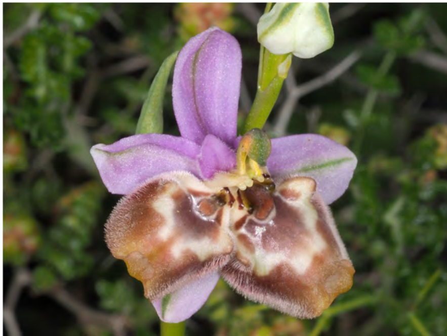
Ophrys candica subsp. candica