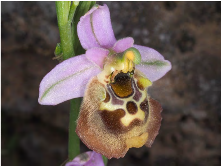
Ophrys episcopalis subsp. episcopalis