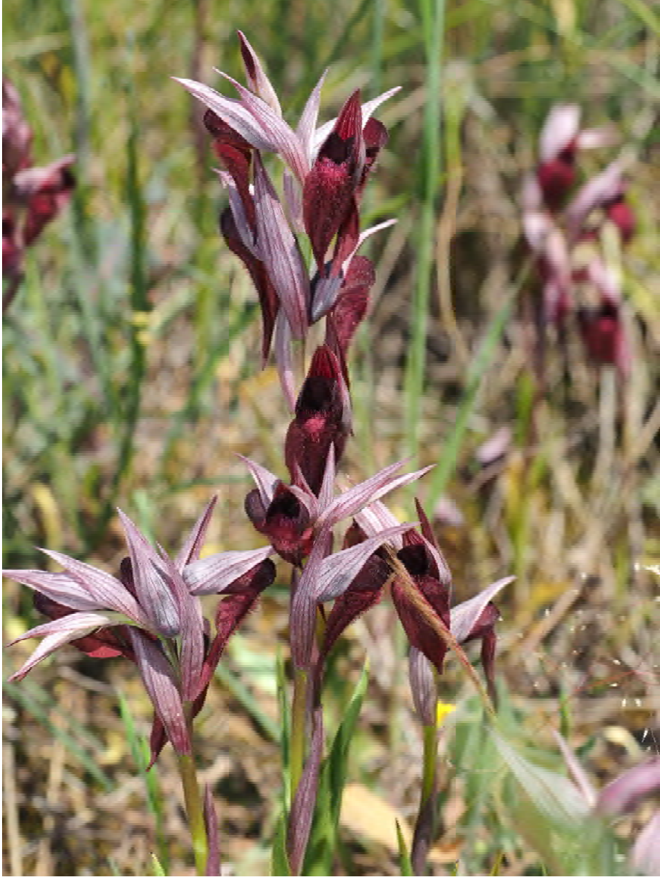
Serapias cordigera subsp. cretica am Standort KR 18