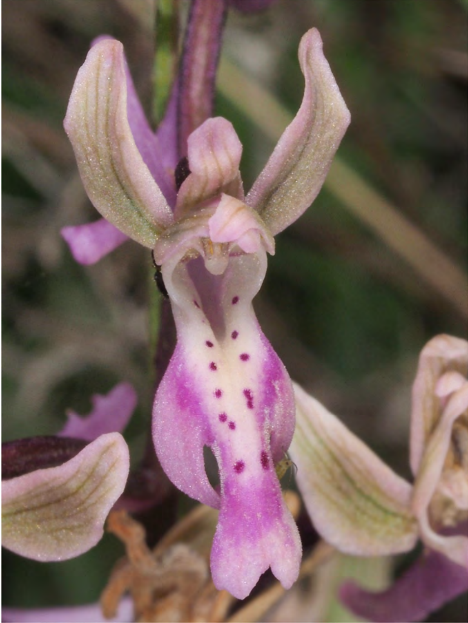
Orchis anatolica subsp. sitiaca