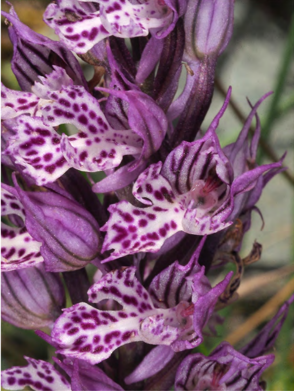
Orchis tridentata subsp. angelica