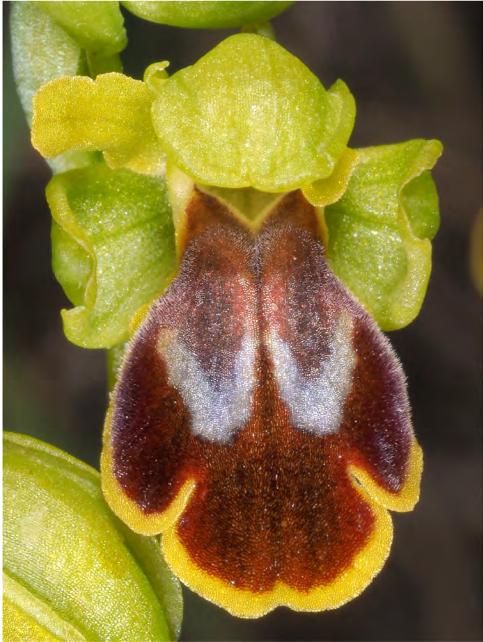
Ophrys fusca subsp. leucadica „phaidra” (Asteroussia)