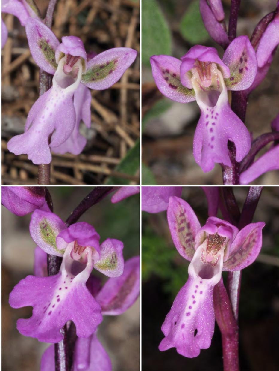
Orchis patens subsp. nitidifolia