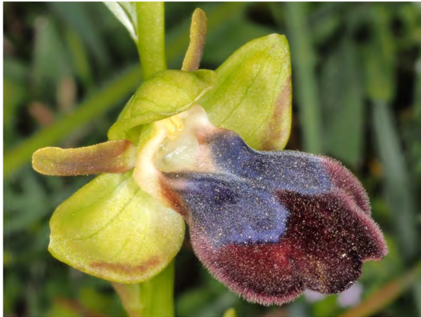
Ophrys iricolor subsp. iricolor