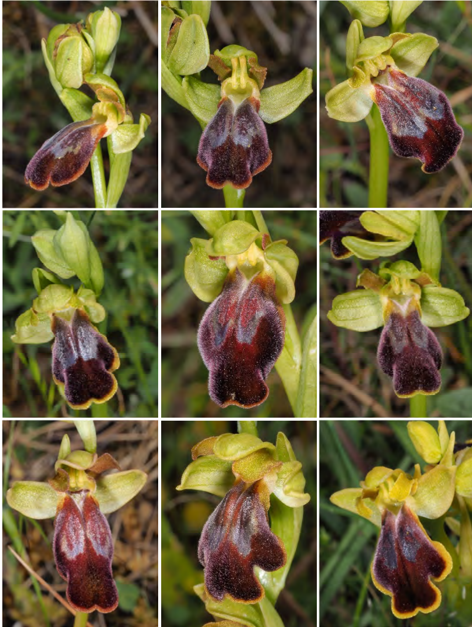
Ophrys „phaidra / kedra“ zwischen Spili und Gerakari