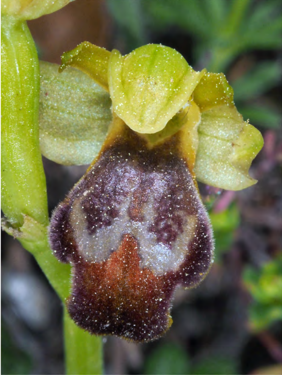
Ophrys fusca subsp. leucadica „pallidula”