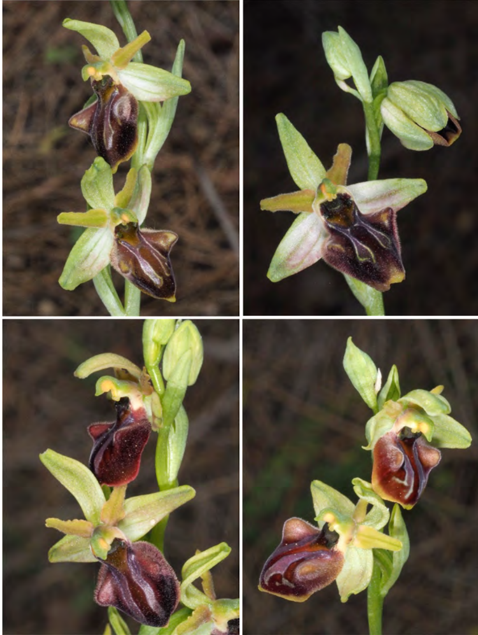
Ophrys grammica subsp. knossia