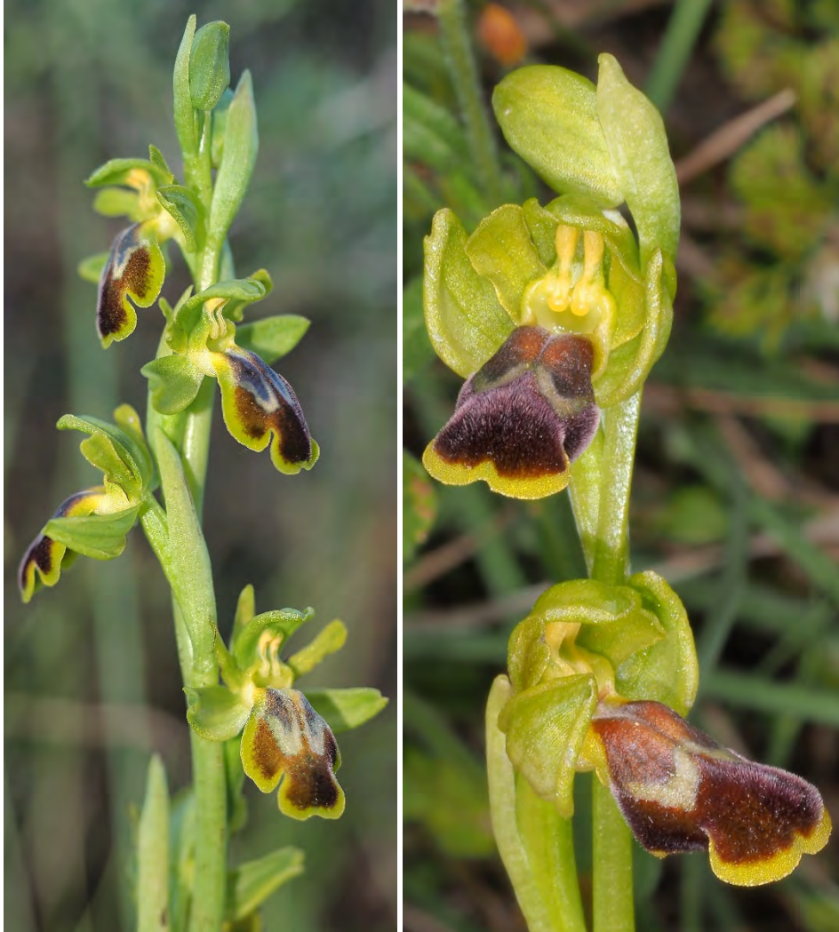
Ophrys fusca subsp. leucadica „phaidra” (Asteroussia)