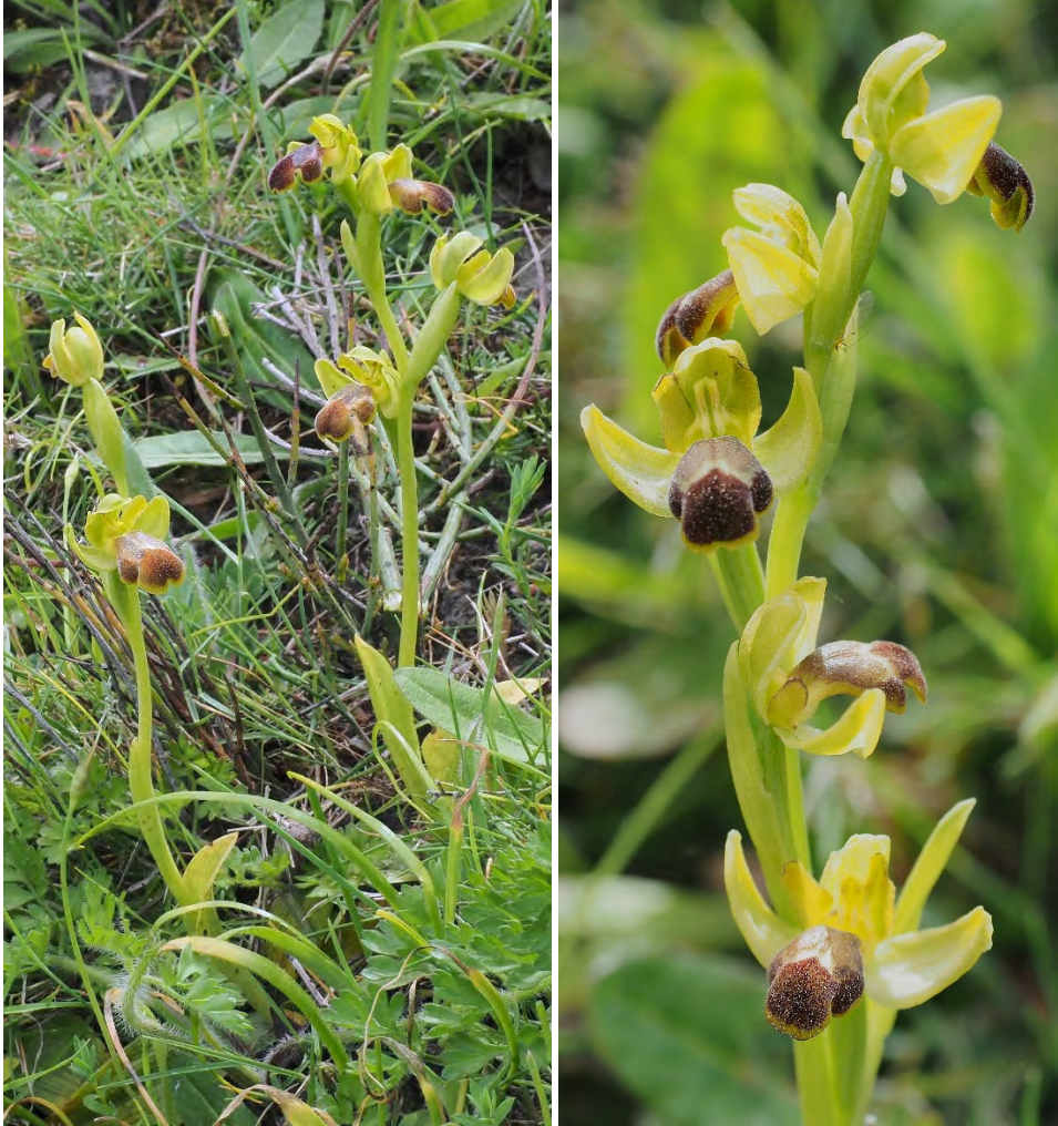
Ophrys fusca subsp. leucadica „pallidula”