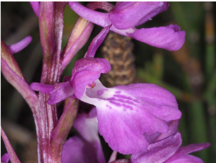
Orchis palustris subsp. elegans