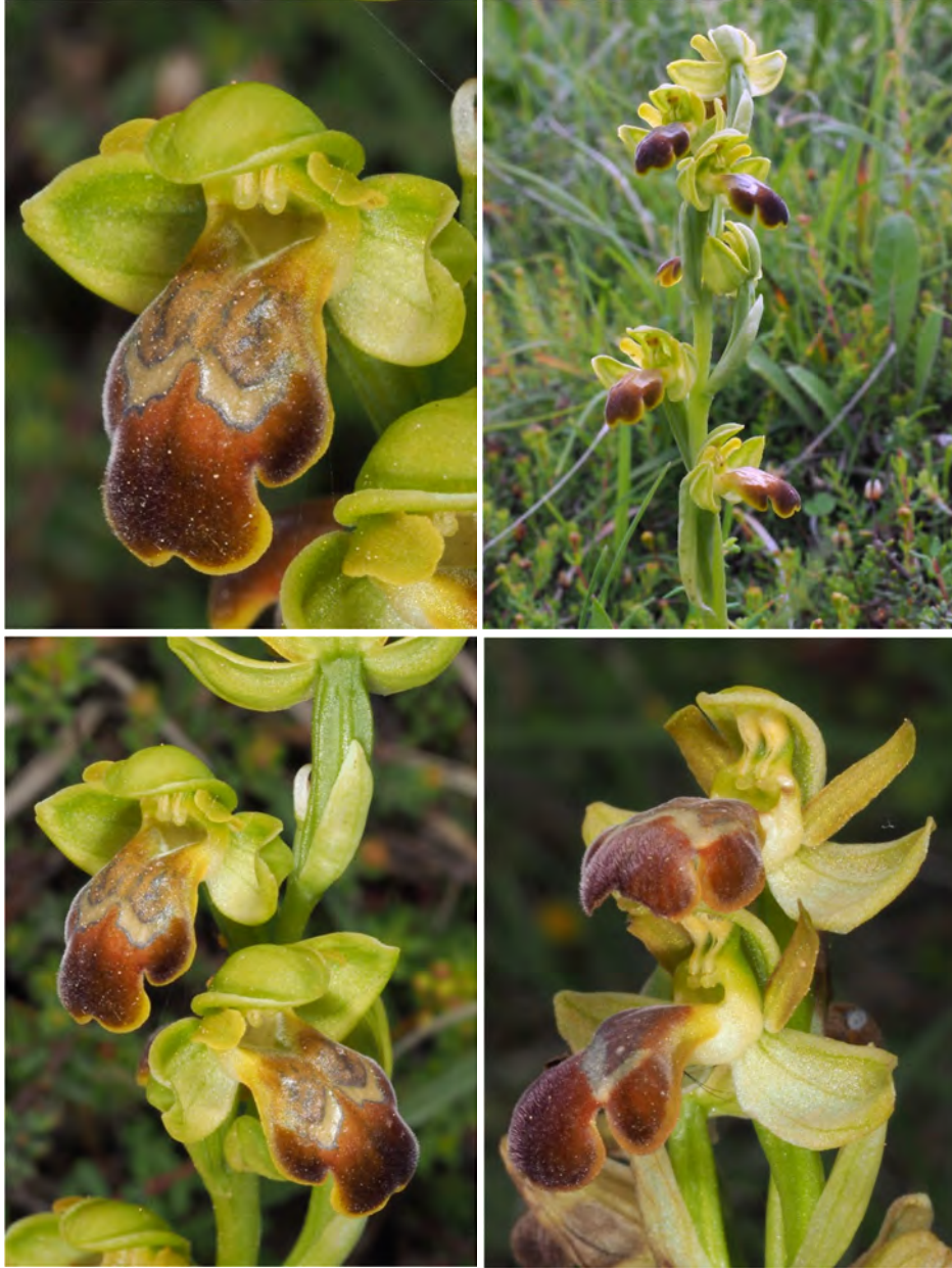
Ophrys „cressa / pallidula“ am Standort KR 30