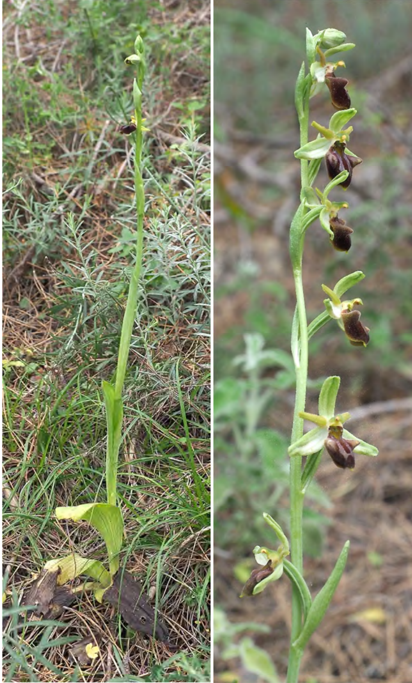
Ophrys grammica subsp. knossia