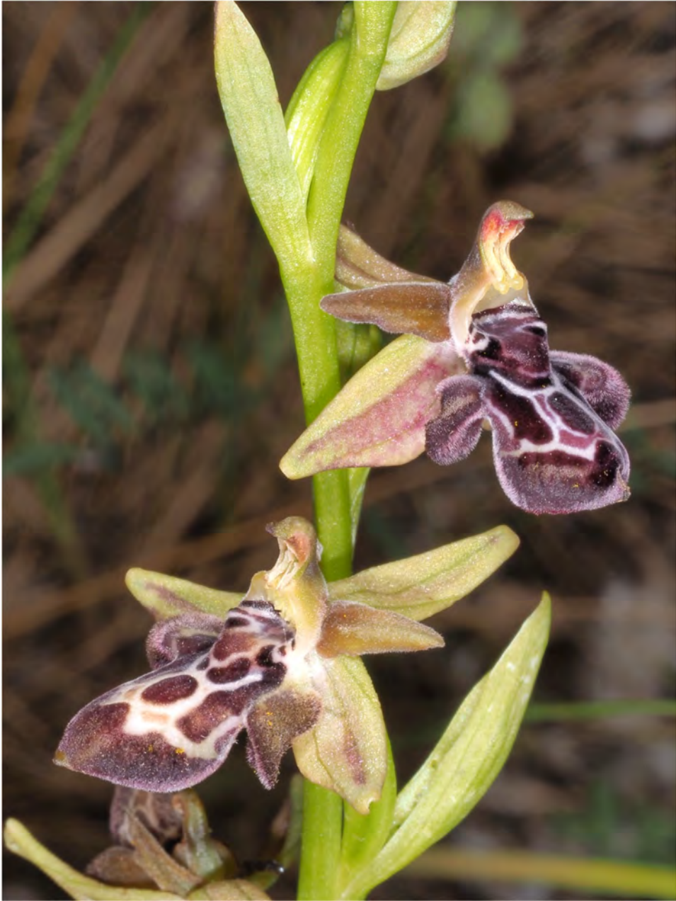
Ophrys cretica subsp. cretica