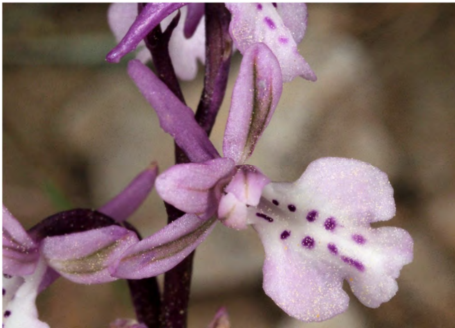
Orchis patens subsp. nitidifolia x Orchis anatolica subsp. anatolica