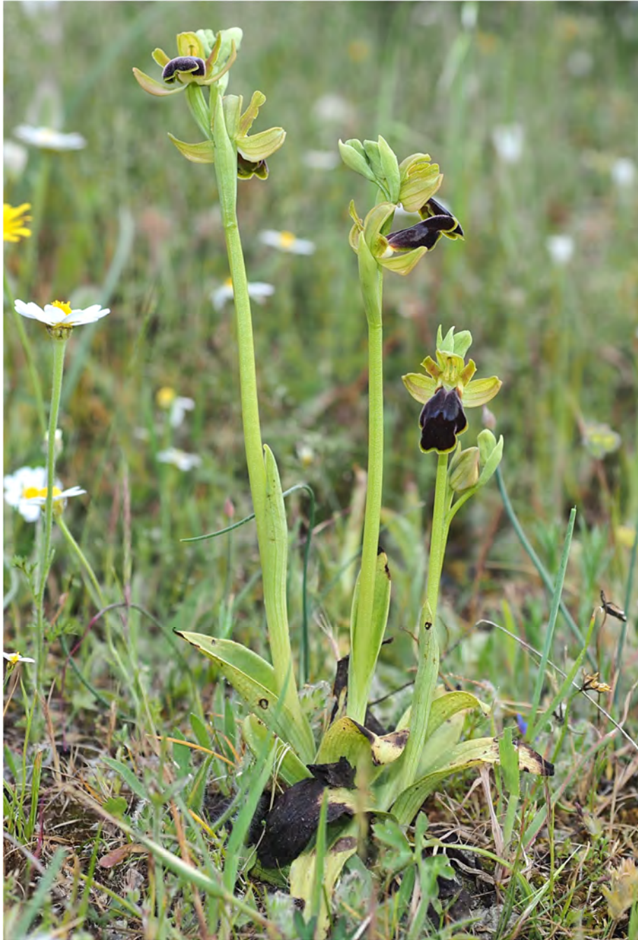
Ophrys „phaidra / kedra“ am Standort KR 12