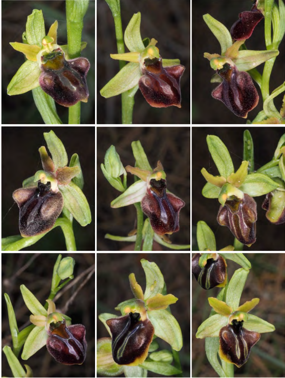
Ophrys grammica subsp. knossia