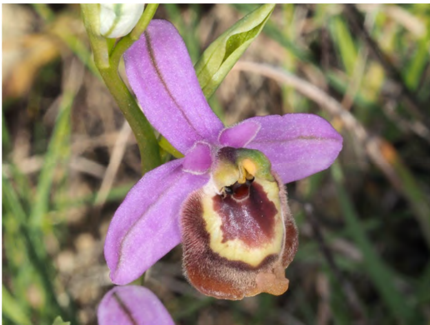
Ophrys candica subsp. candica