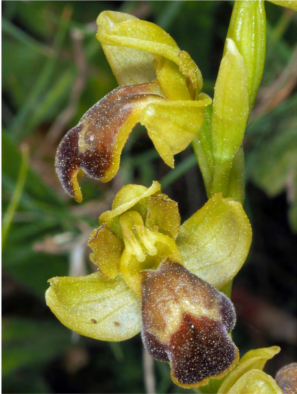
Ophrys fusca subsp. leucadica „pallidula”