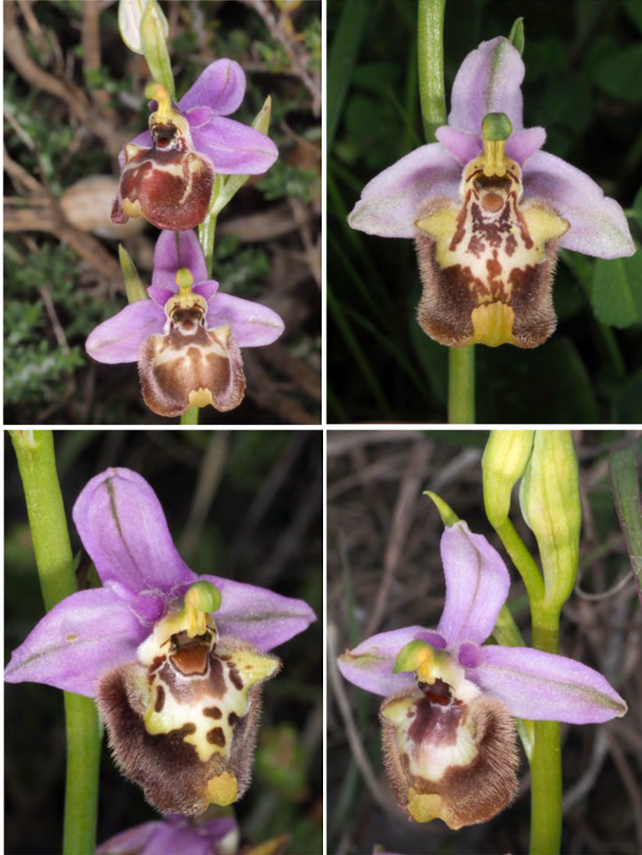
Ophrys candica subsp. candica