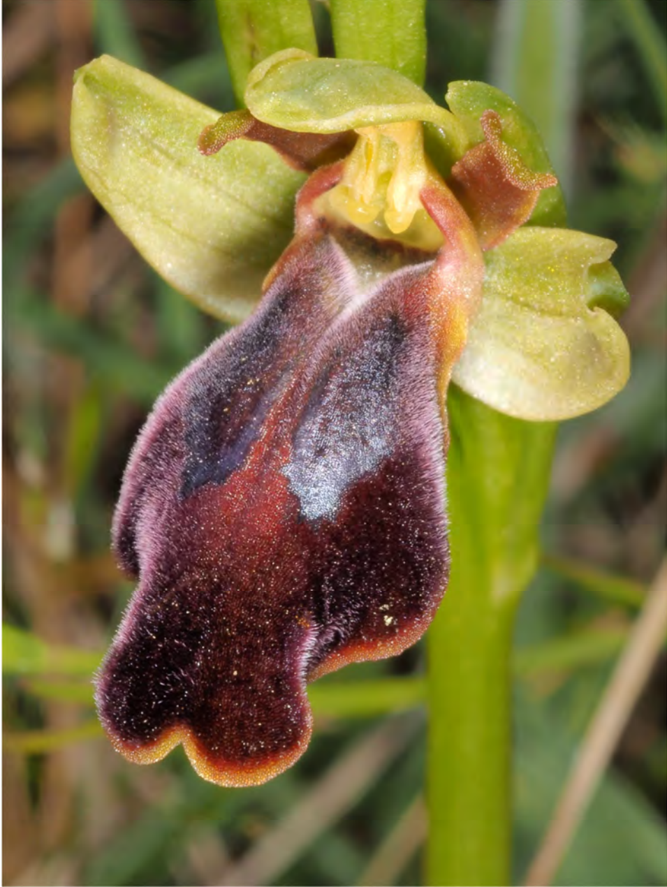
Ophrys „phaidra / kedra“ zwischen Spili und Gerakari