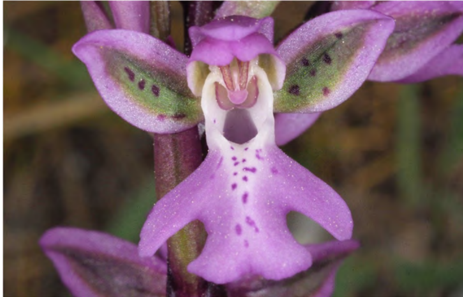
Orchis patens subsp. nitidifolia