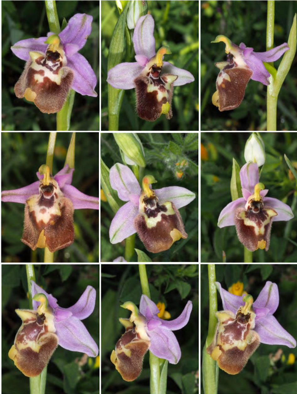
Ophrys candica subsp. candica