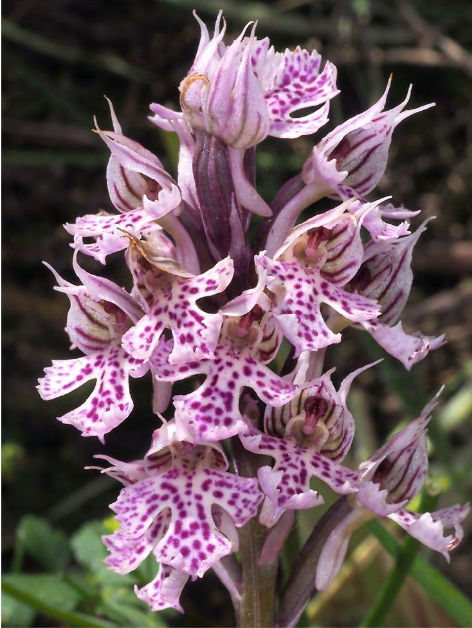
Orchis tridentata subsp. angelica