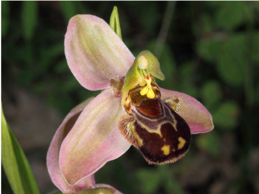
Ophrys apifera am Standort KR 13