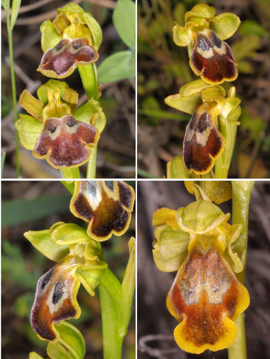
Ophrys fusca subsp. leucadica „phaidra” (Asteroussia)