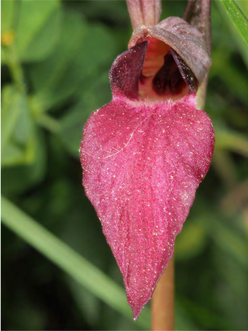
Serapias lingua x Serapias vomeracea subsp. bergonii