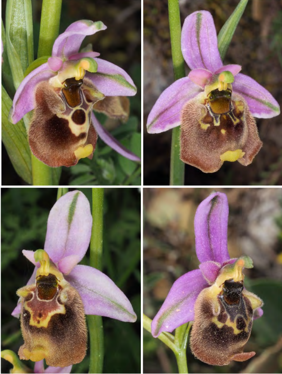
Ophrys episcopalis subsp. episcopalis