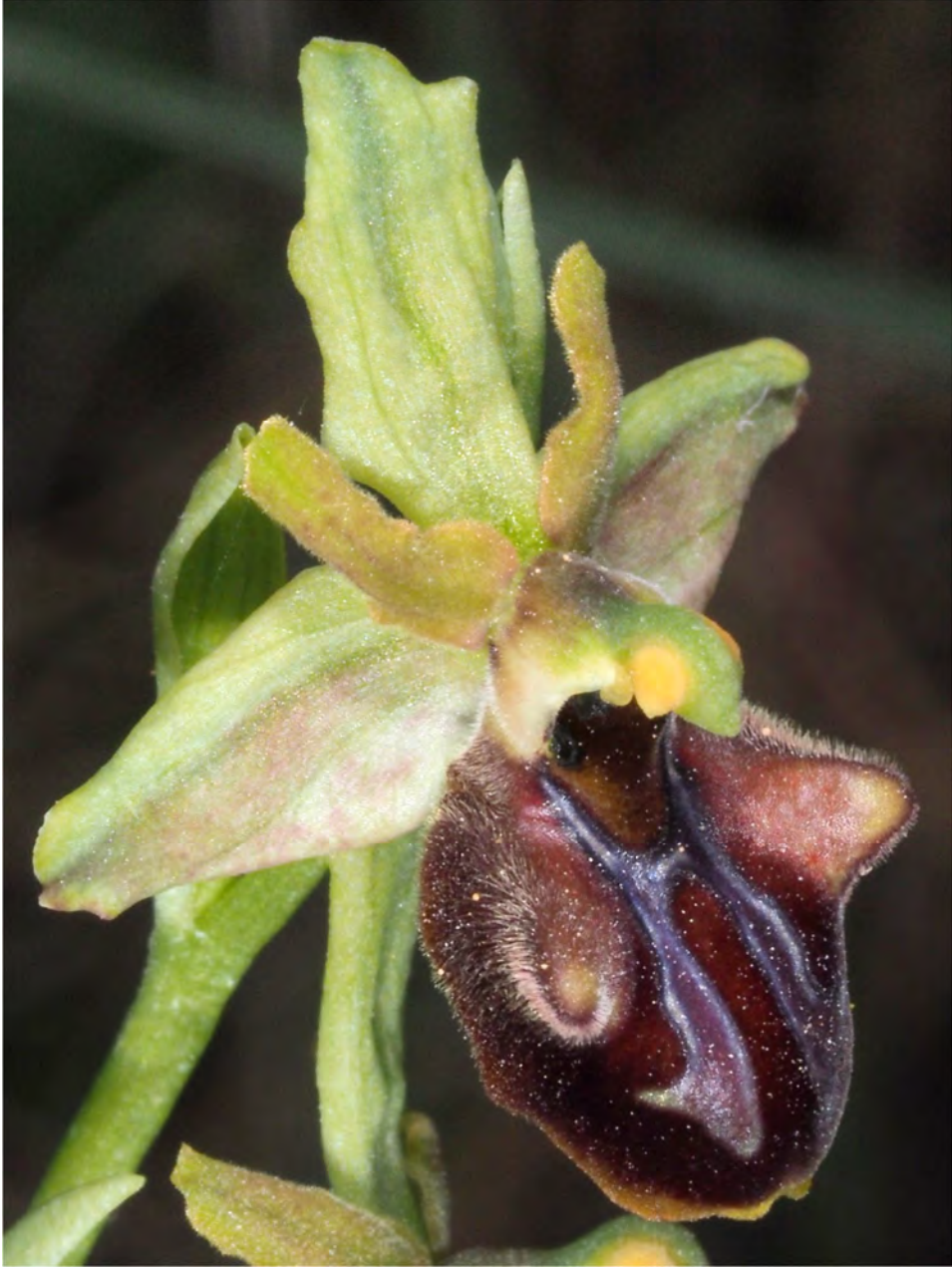
Ophrys grammica subsp. knossia