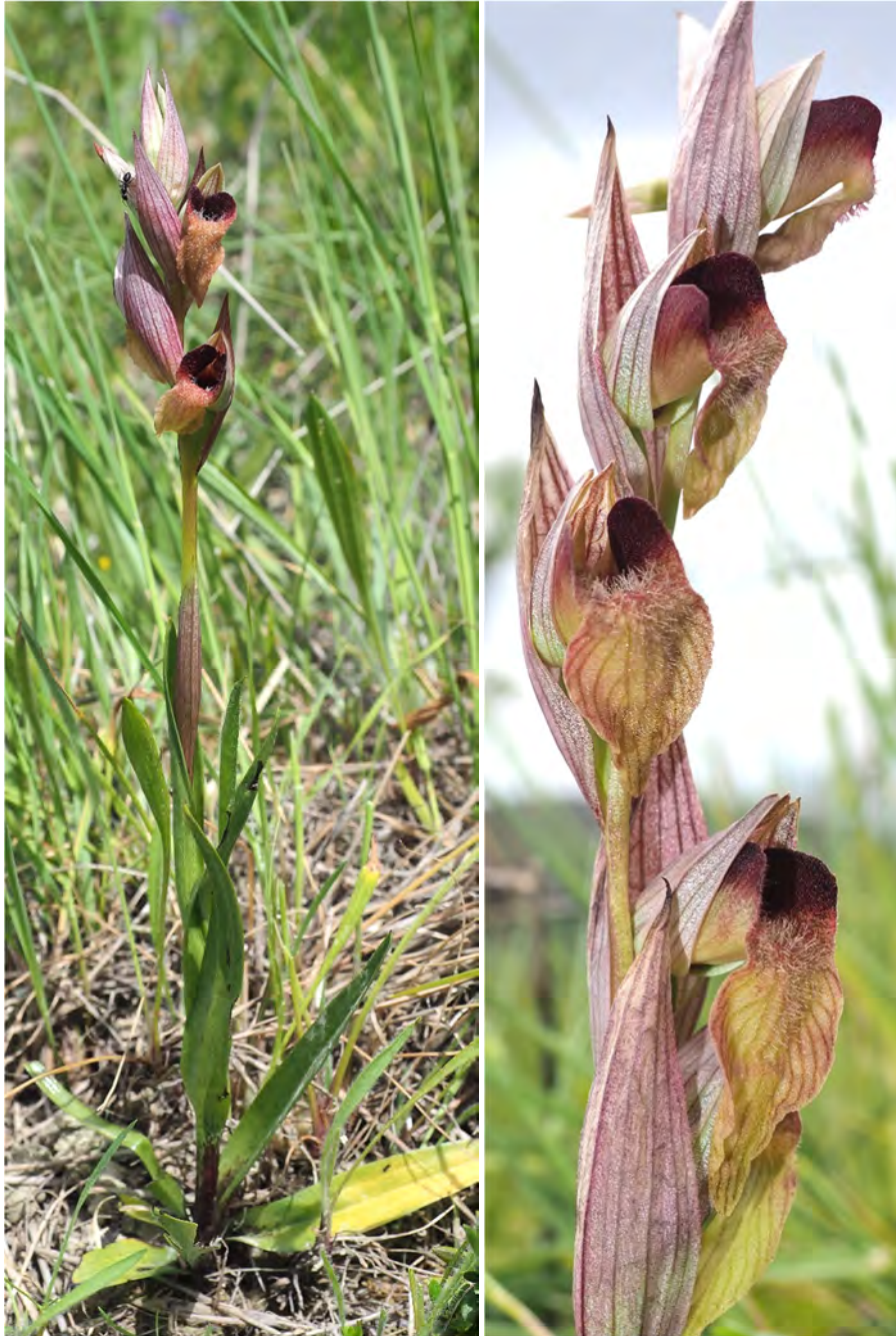
Serapias cordigera subsp. cretica / Serapias orientalis subsp. orientalis (KR 22)