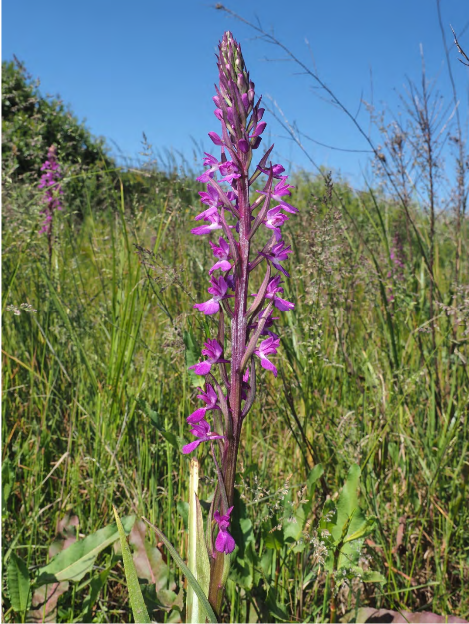
Orchis palustris subsp. elegans