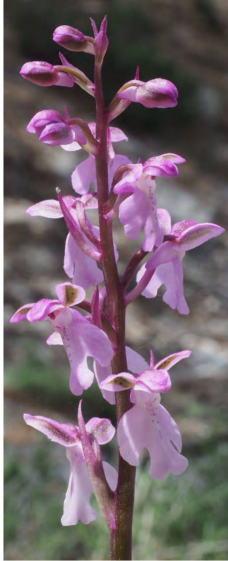
Orchis patens subsp. nitidifolia