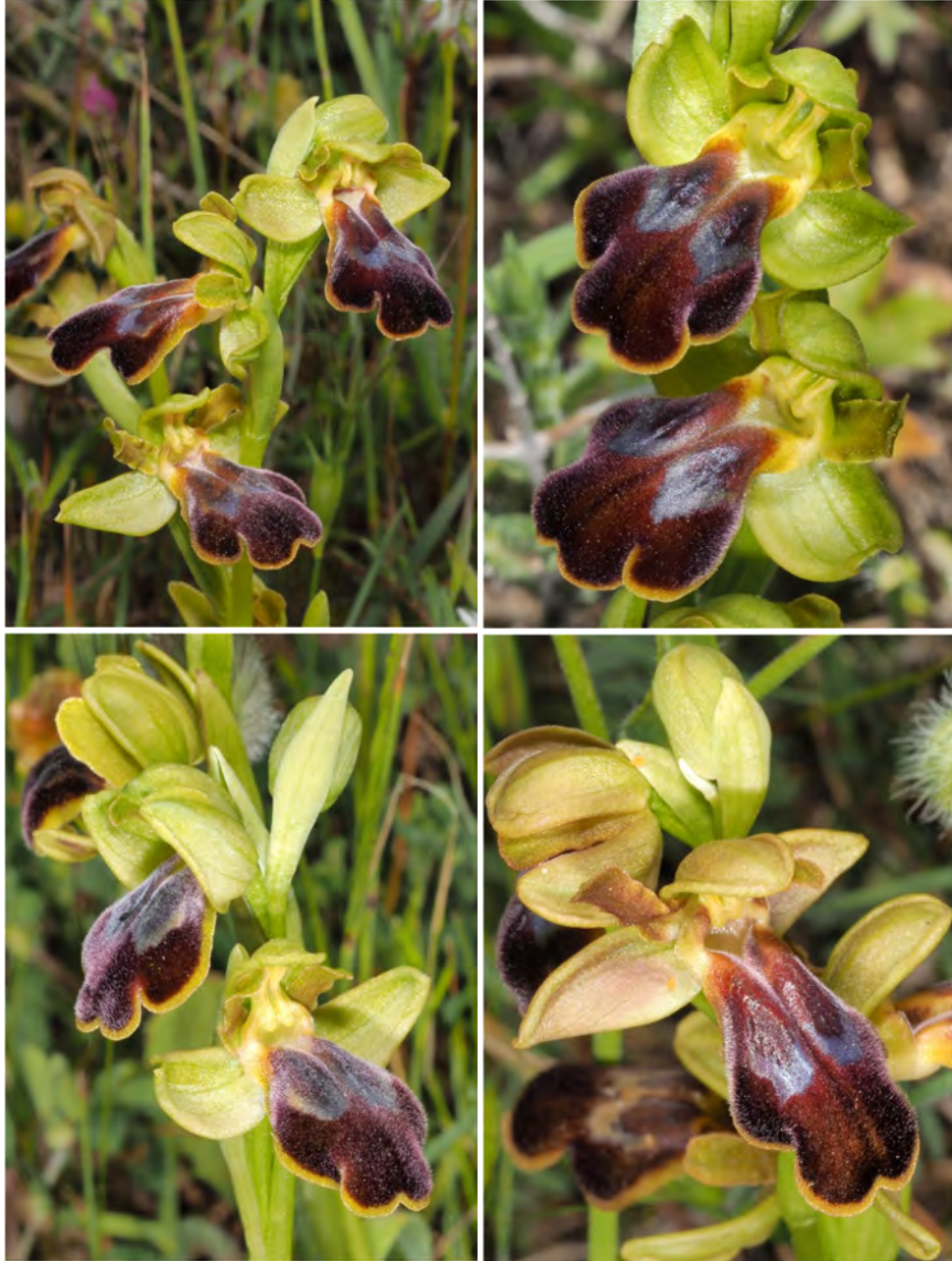
Ophrys „phaidra / kedra“ zwischen Spili und Gerakari