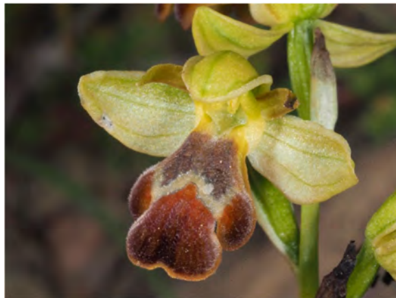
Ophrys „cressa / pallidula“ am Standort KR 30