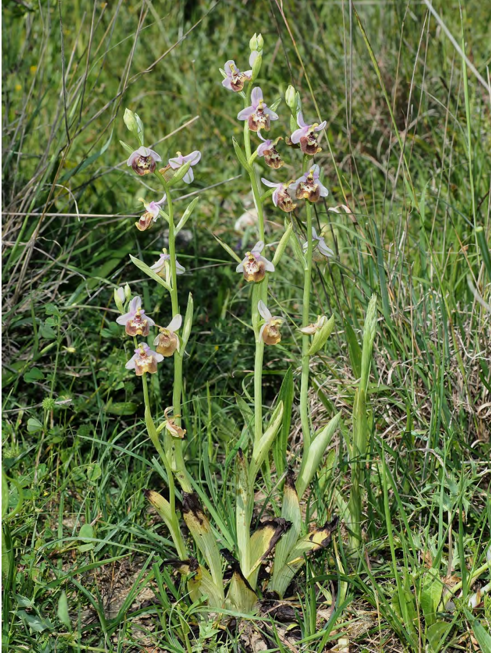
Ophrys candica subsp. candica