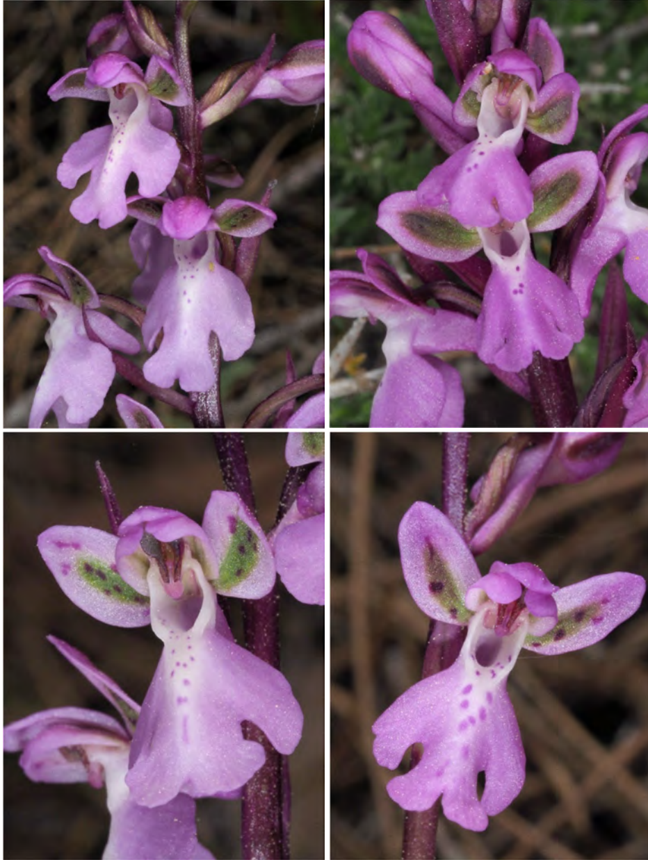
Orchis patens subsp. nitidifolia