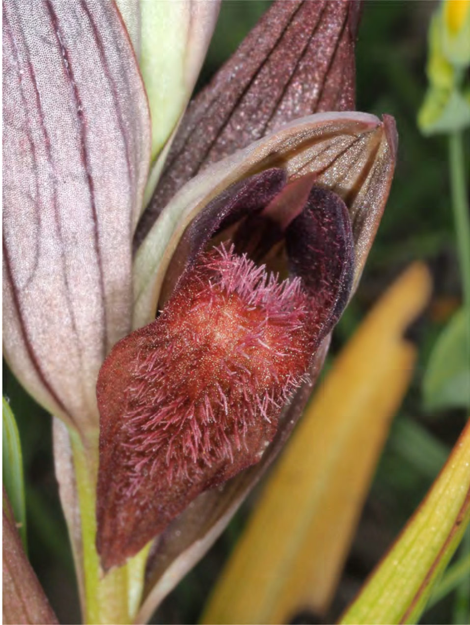
Serapias cordigera subsp. cretica / Serapias orientalis subsp. orientalis (KR 22)