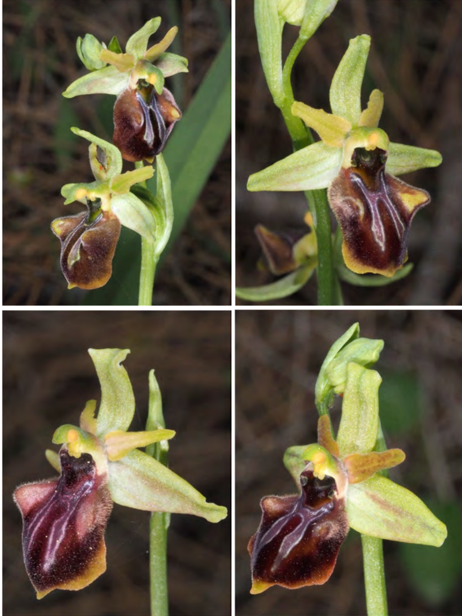
Ophrys grammica subsp. knossia