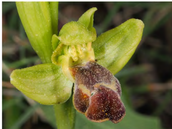
Ophrys fusca subsp. leucadica „ pallidula ”