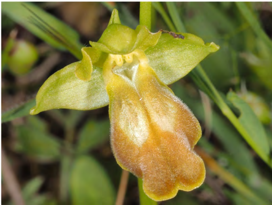
Ophrys „phaidra / kedra“ zwischen Spili und Gerakari