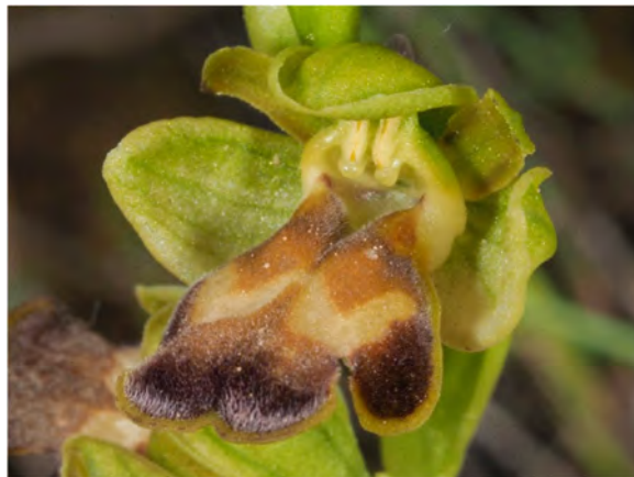
Ophrys „cressa / pallidula“ am Standort KR 30