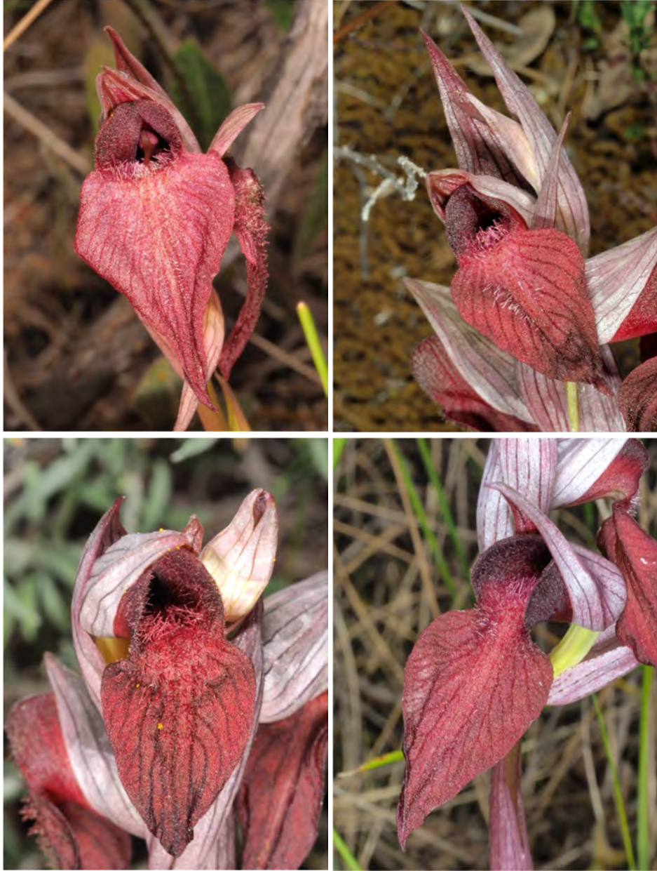
Serapias cordigera subsp. cretica am Standort KR 18