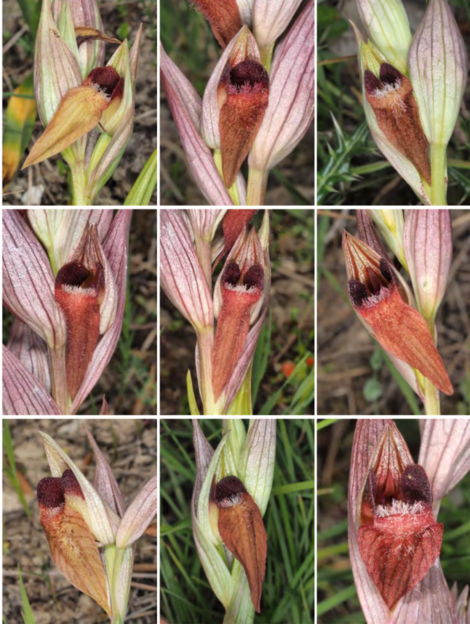
Serapias cordigera subsp. cretica / Serapias orientalis subsp. orientalis (KR 22)