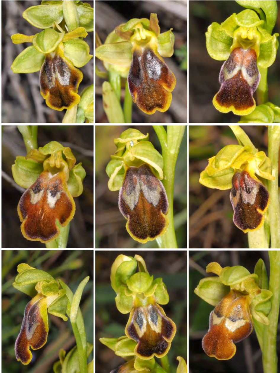
Ophrys fusca subsp. leucadica „phaidra” (Asteroussia)