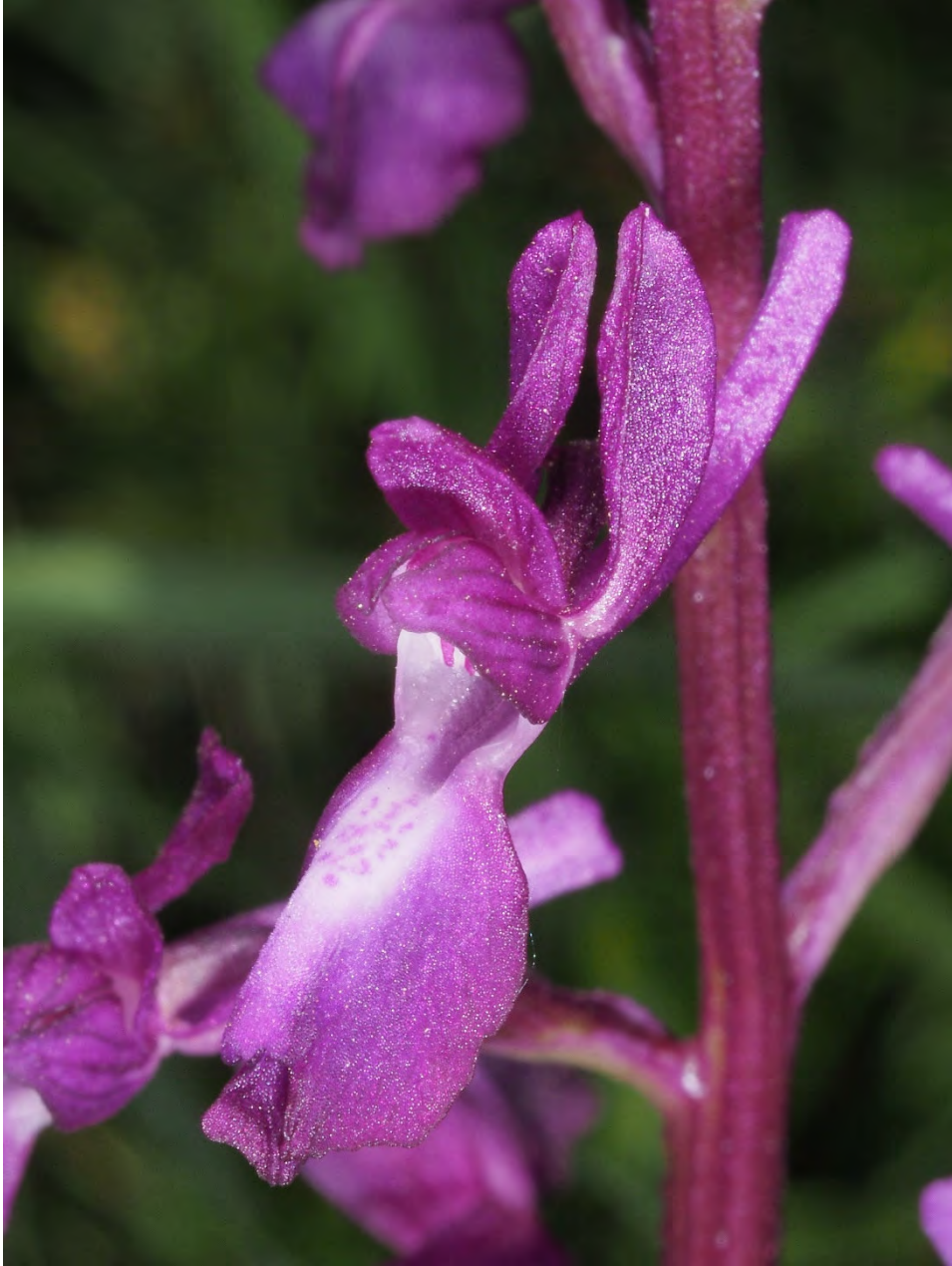
Orchis palustris subsp. laxiflora x Orchis palustris subsp. palustris ?