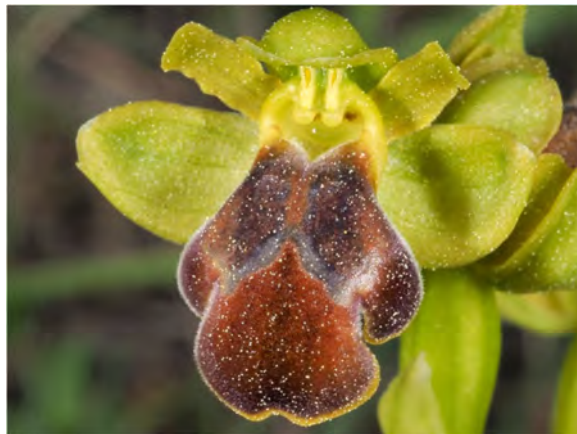
Ophrys fuscata subsp. leucadica „pallidula“