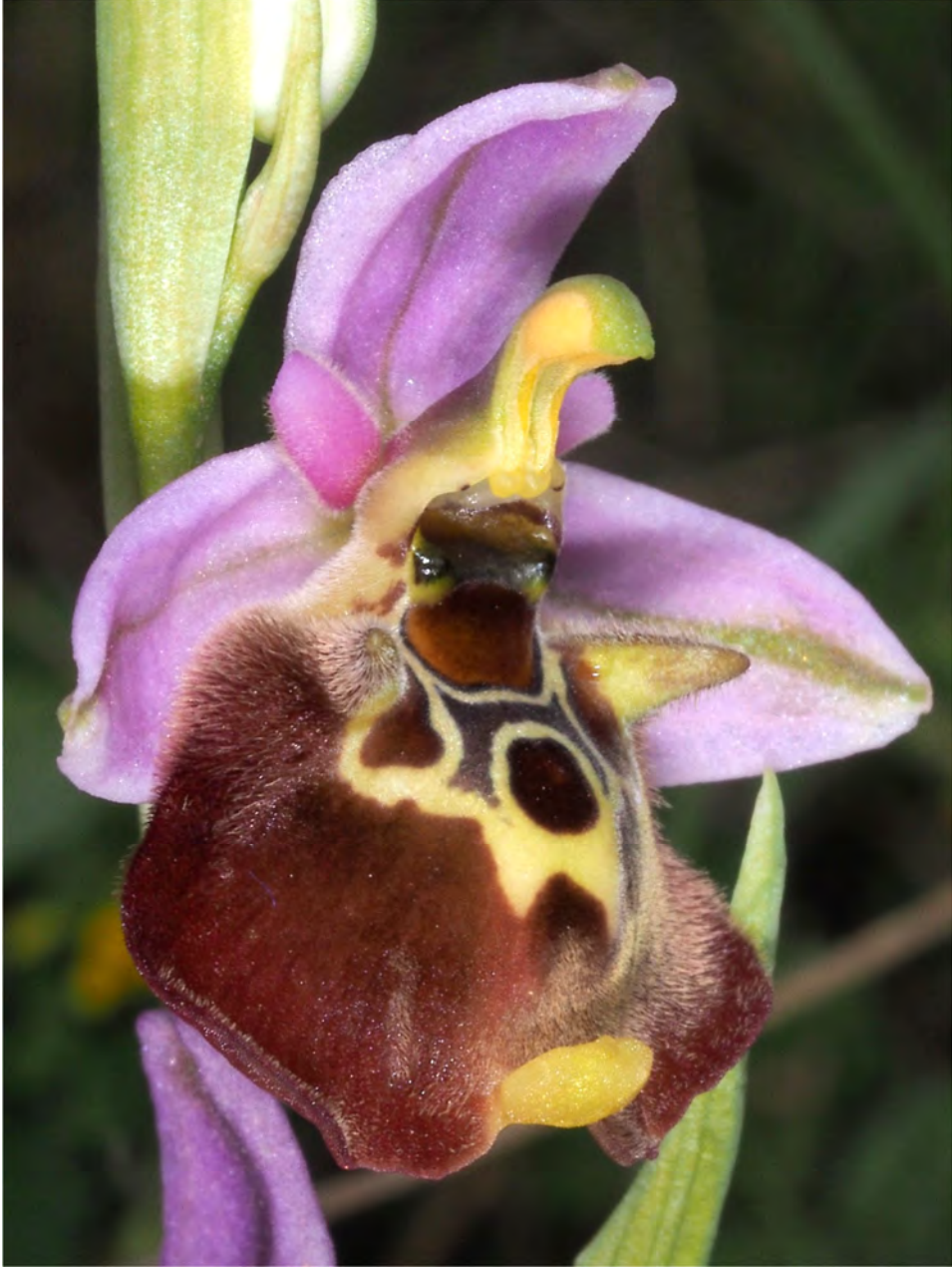
Ophrys episcopalis subsp. episcopalis