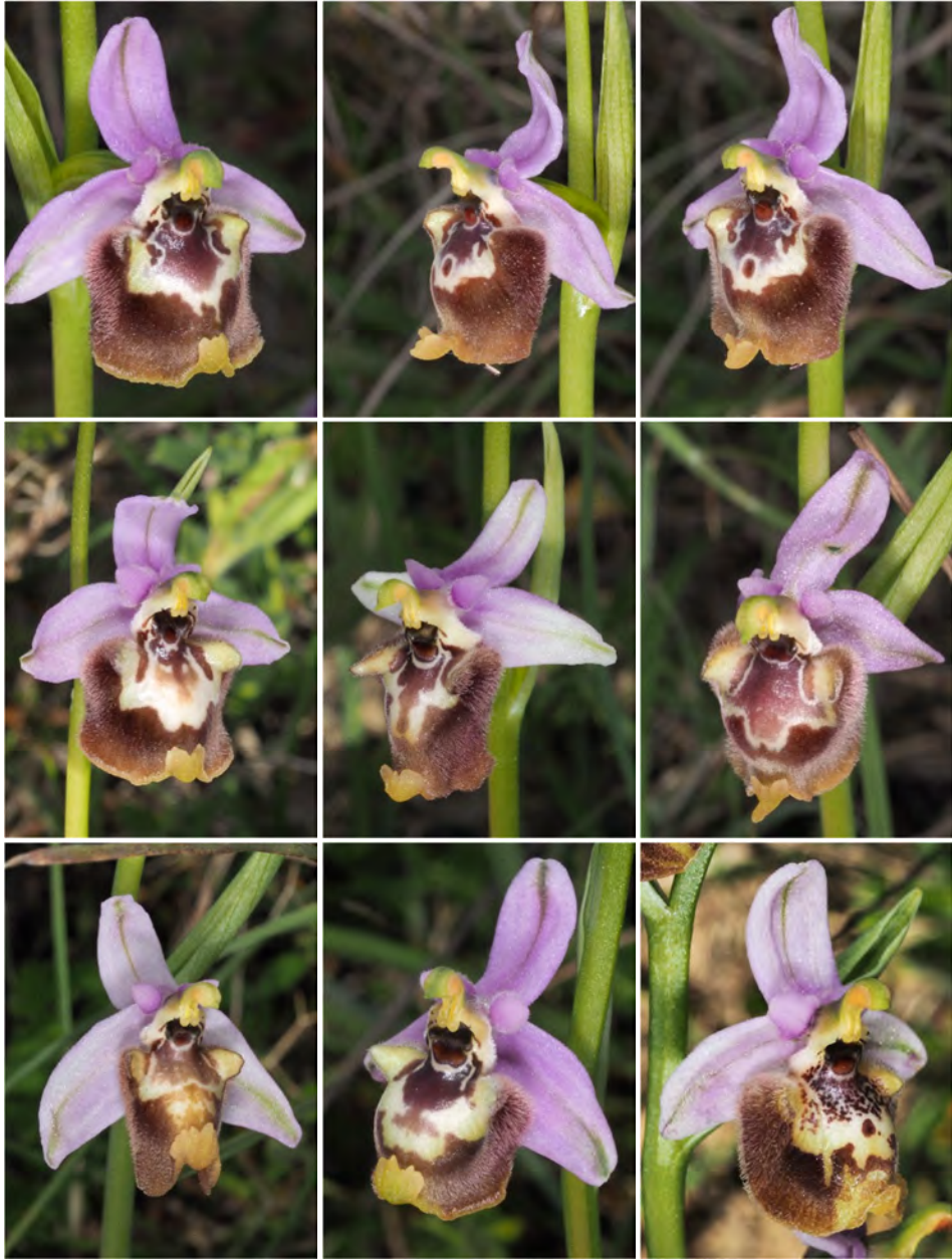
Ophrys candica subsp. candica