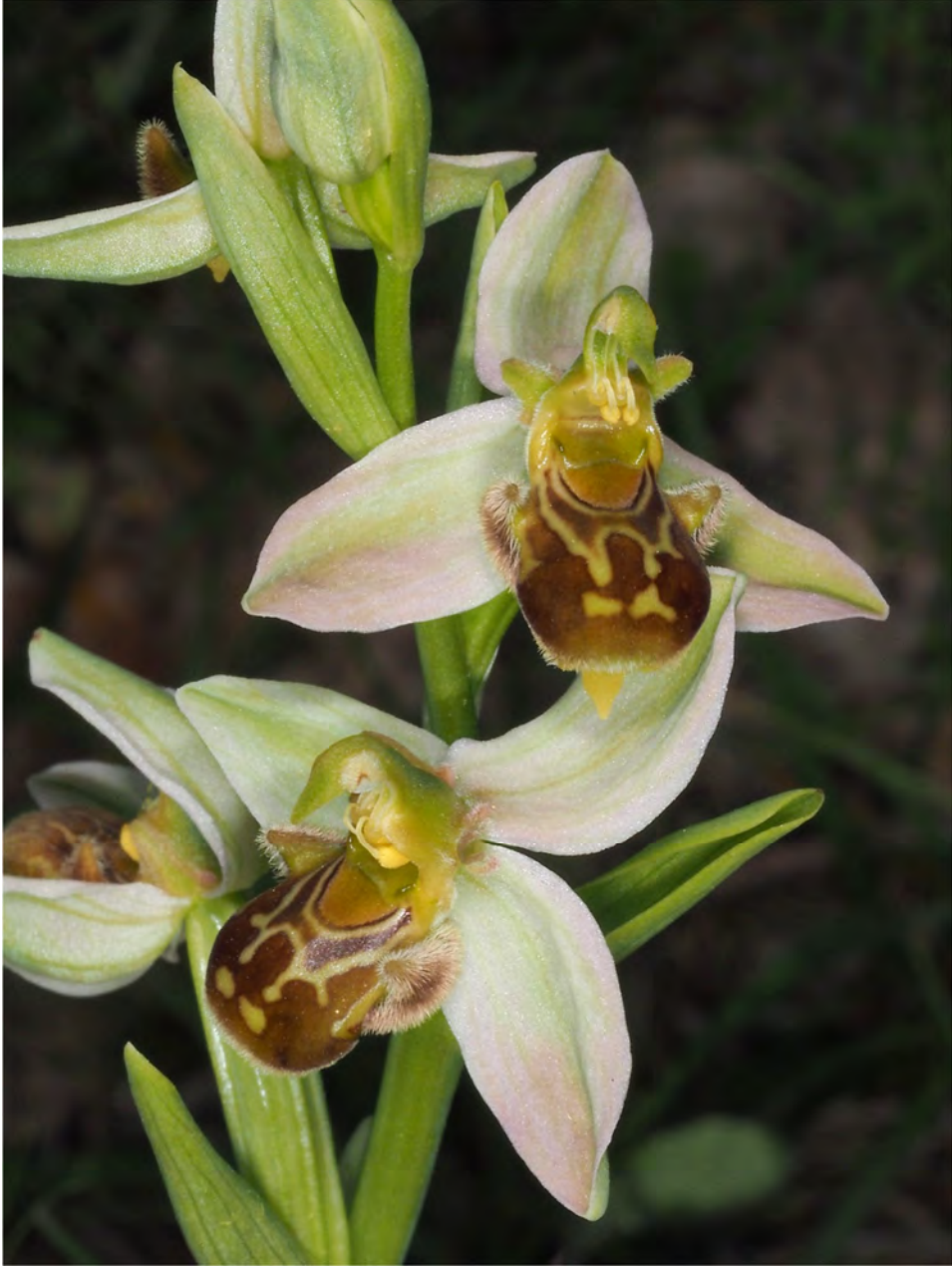
Ophrys apifera am Standort KR 13