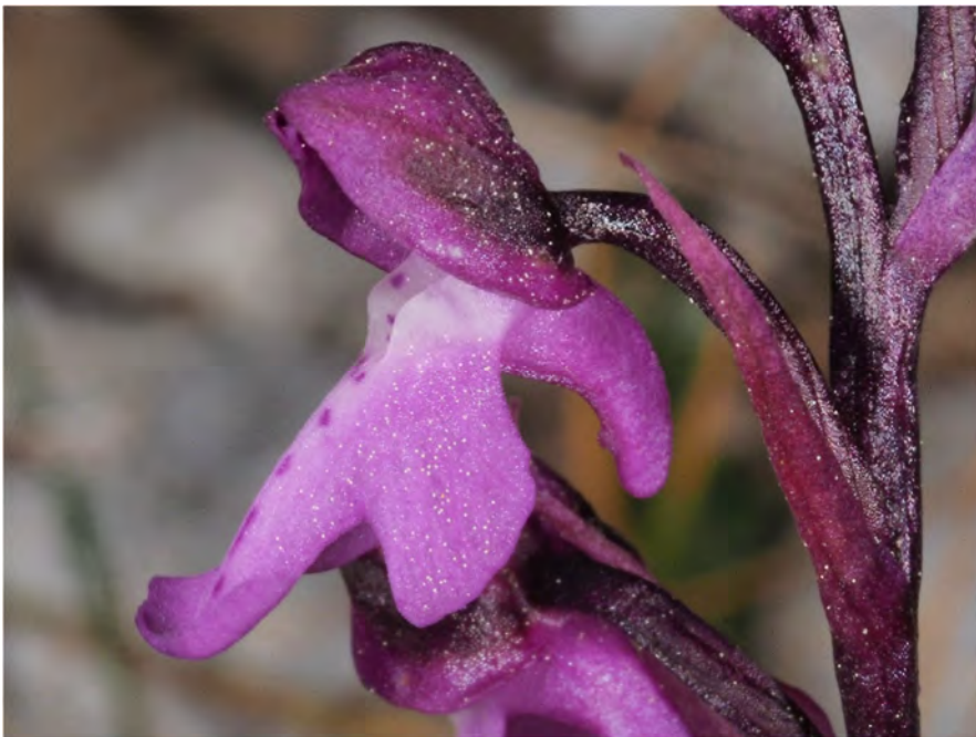
Orchis patens subsp. nitidifolia