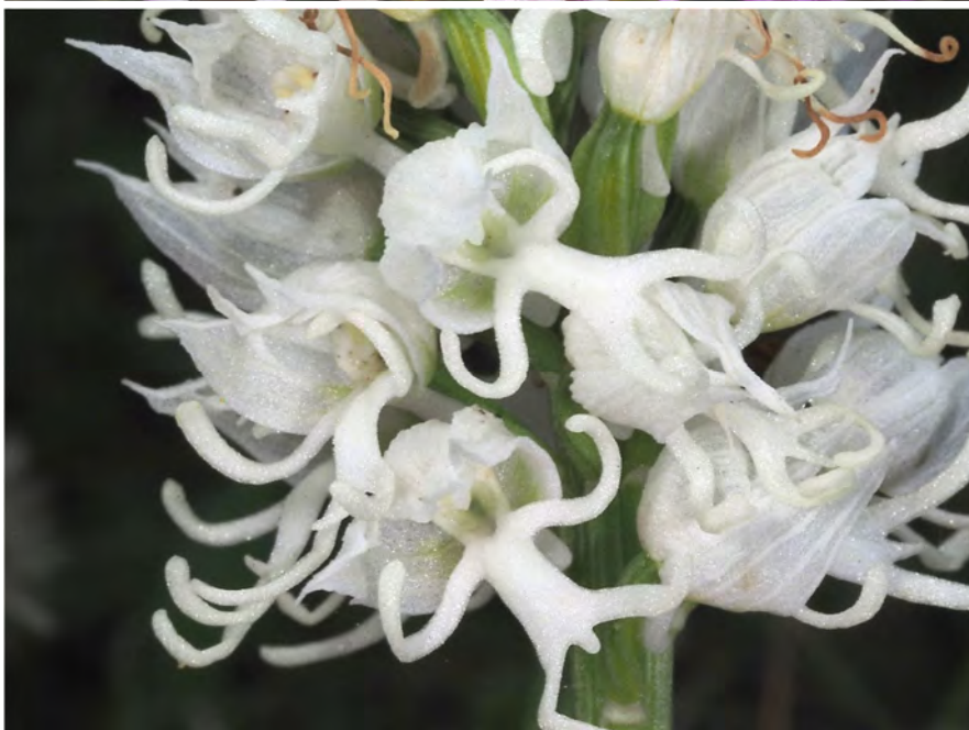
Orchis simia subsp. simia