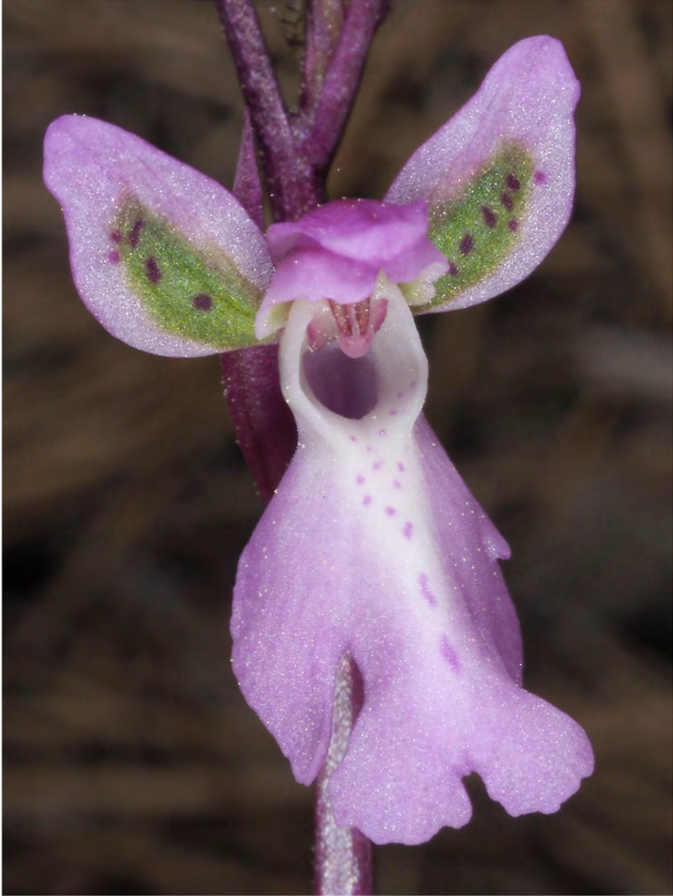
Orchis patens subsp. nitidifolia