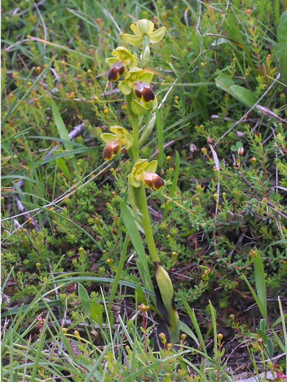
Ophrys „cressa / pallidula“ am Standort KR 30