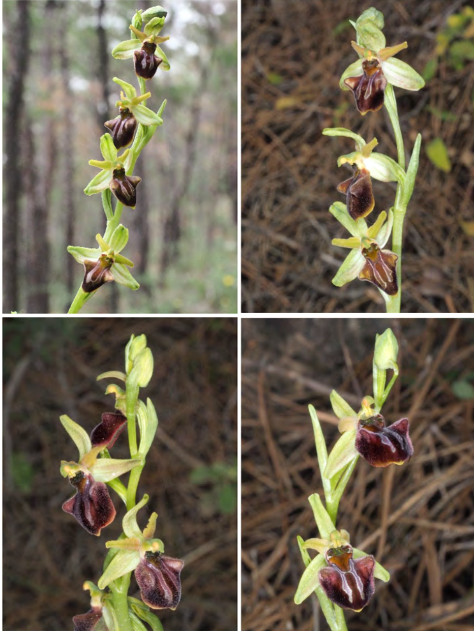
Ophrys grammica subsp. knossia