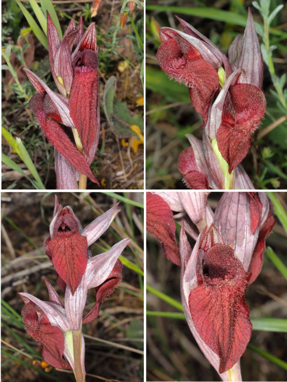
Serapias cordigera subsp. cretica am Standort KR 18