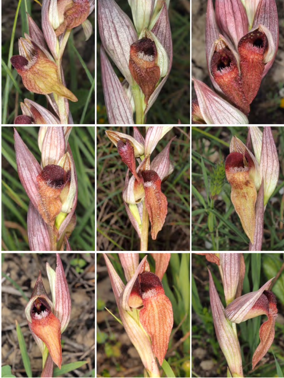
Serapias cordigera subsp. cretica / Serapias orientalis subsp. orientalis (KR 22)