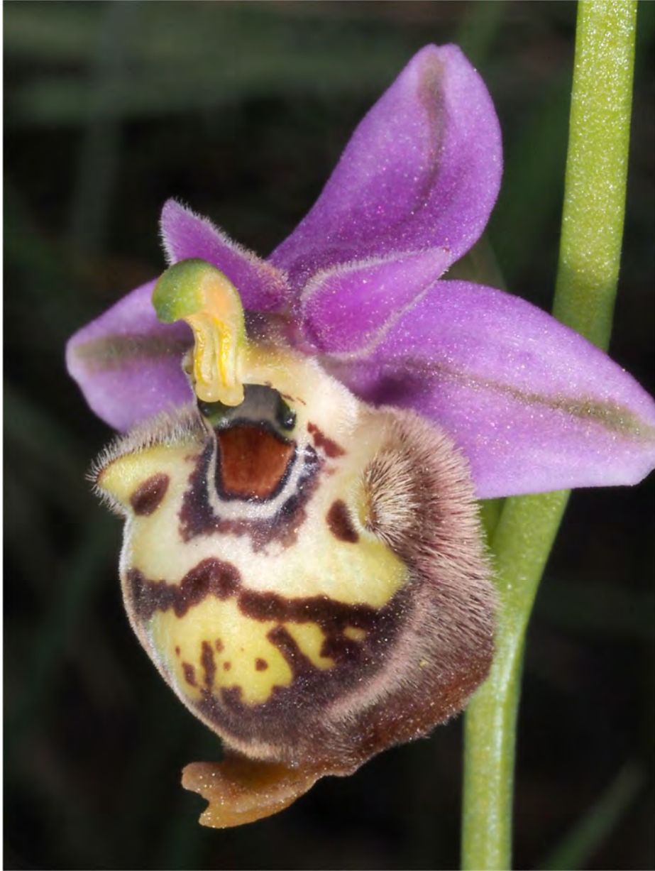
Ophrys heldreichii subsp. heldreichii x Ophrys candica subsp. candica