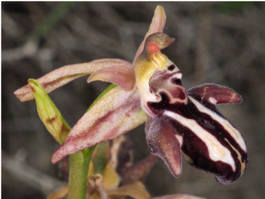
Ophrys cretica subsp. bicornuta