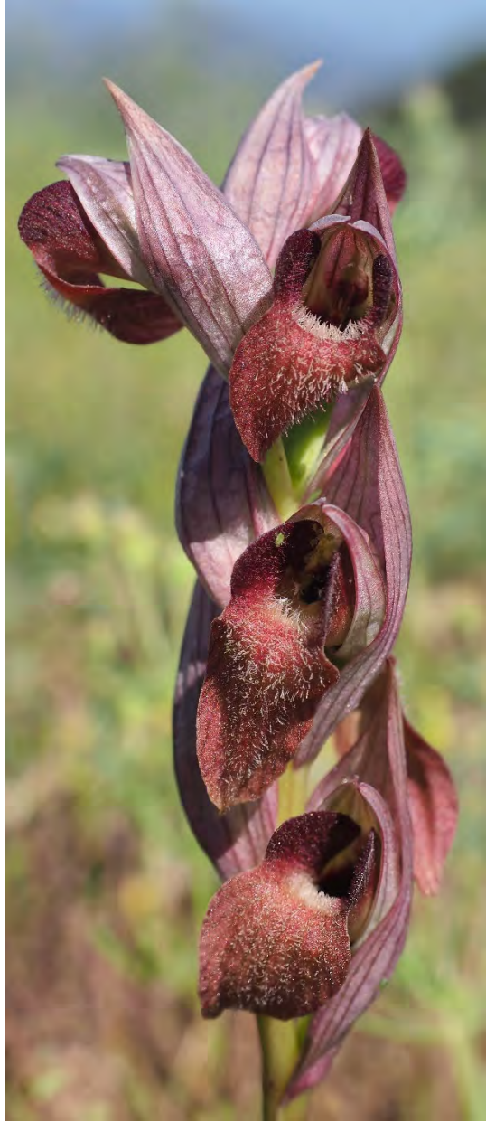
Serapias orientalis subsp. orientalis