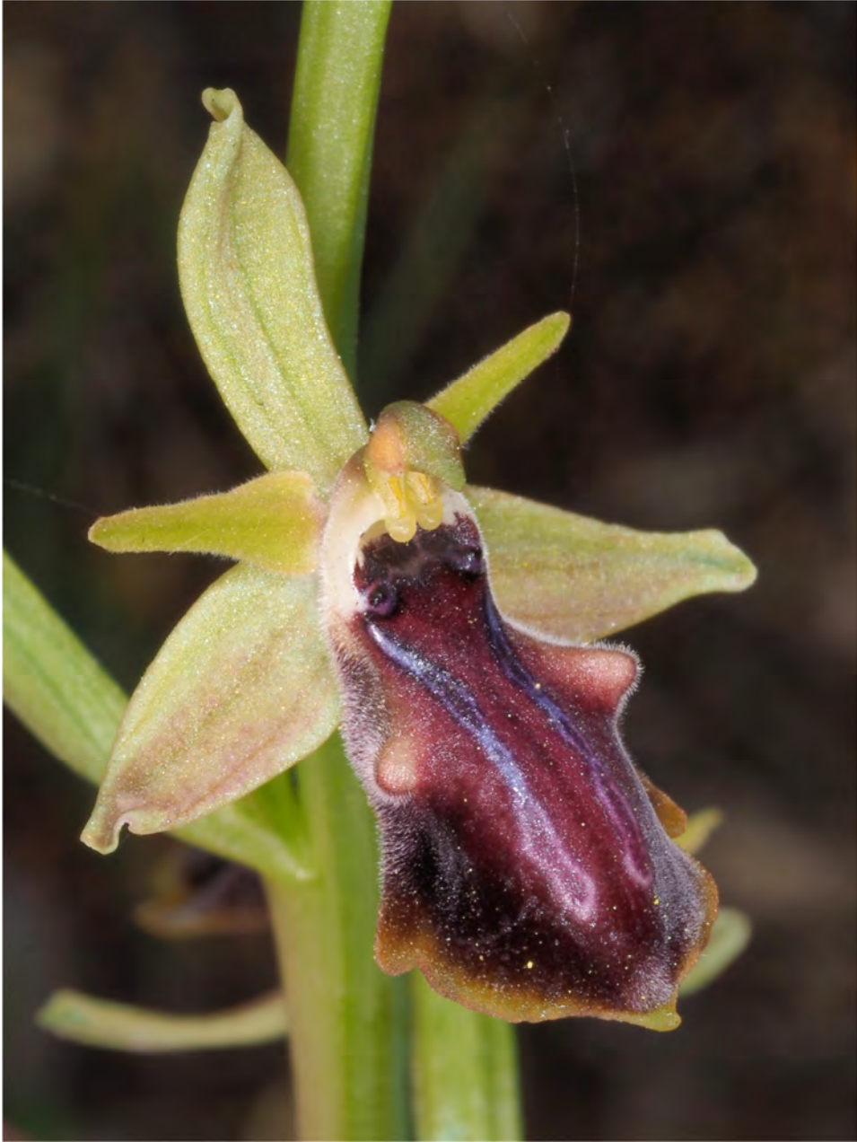
Ophrys mammosa subsp. gortynia