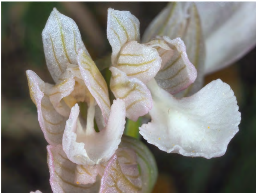
Orchis papilionacea subsp. alibertis