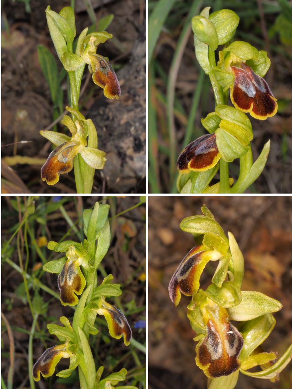
Ophrys fusca subsp. leucadica „phaidra” (Asteroussia)