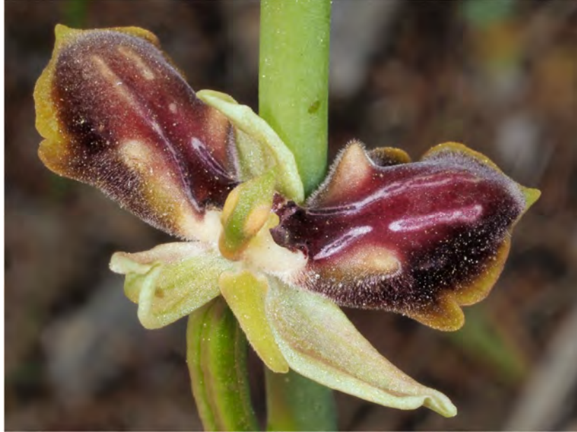
Ophrys mammosa subsp. gortynia