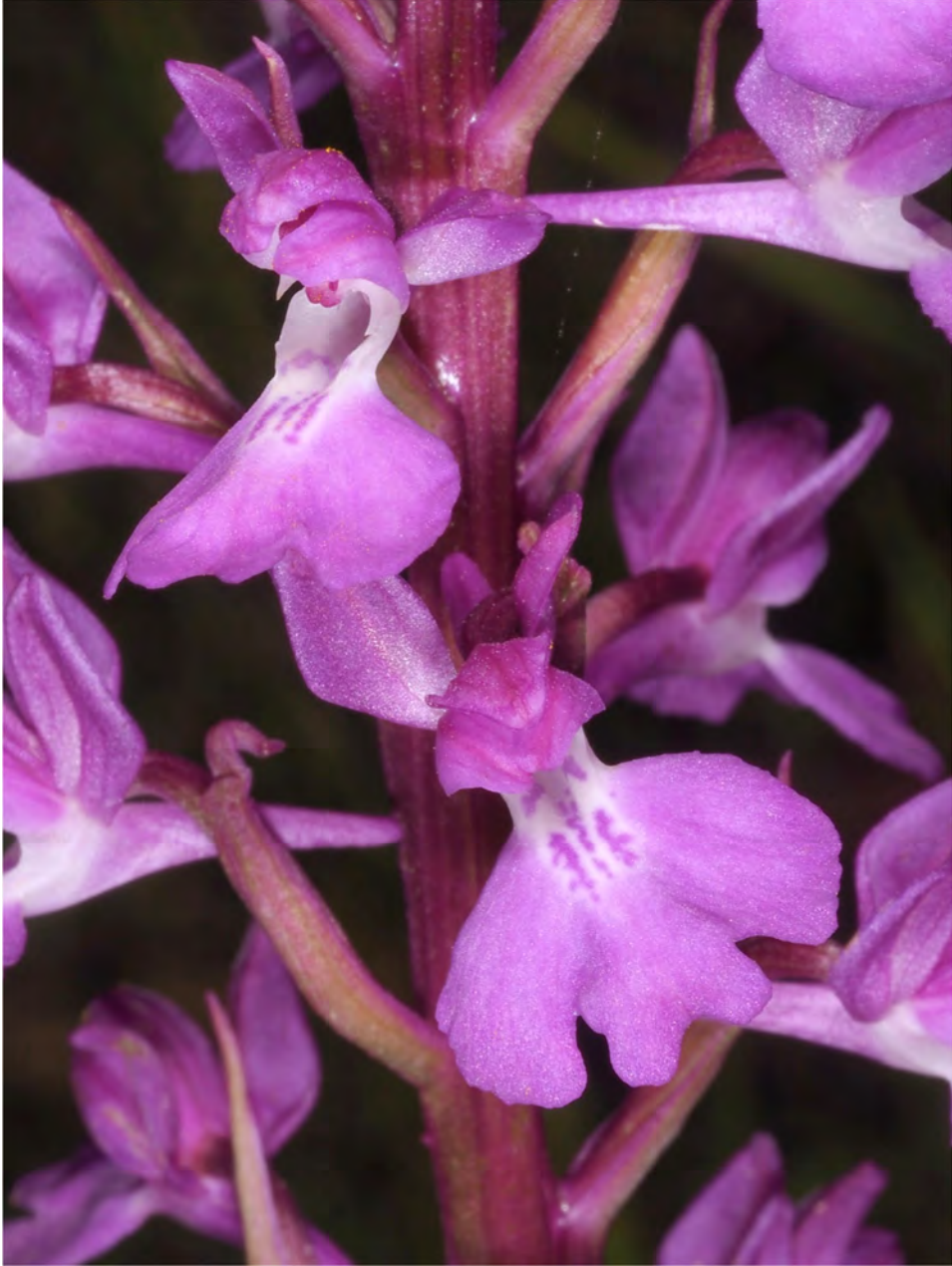
Orchis palustris subsp. elegans