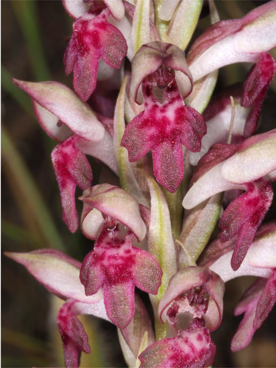
Orchis coriophora subsp. fragrans