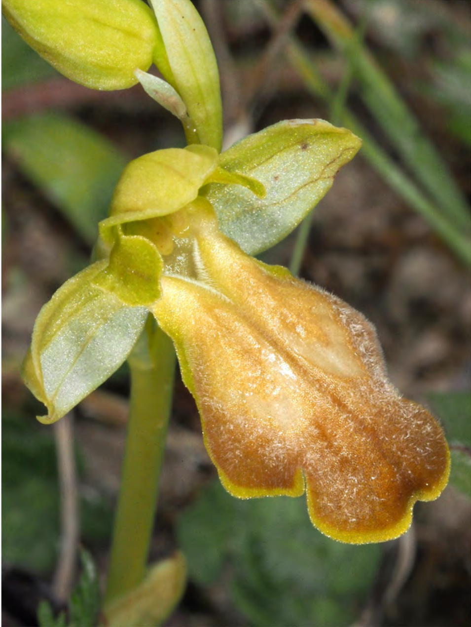
Ophrys „phaidra / kedra“ am Standort KR 12