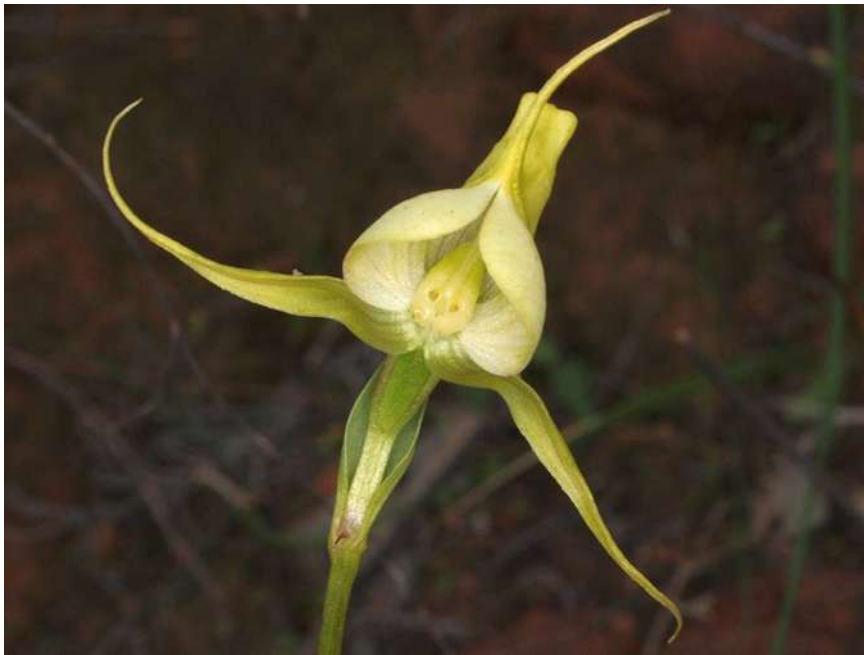
Disperis capensis „rubra“ und „flavescens“