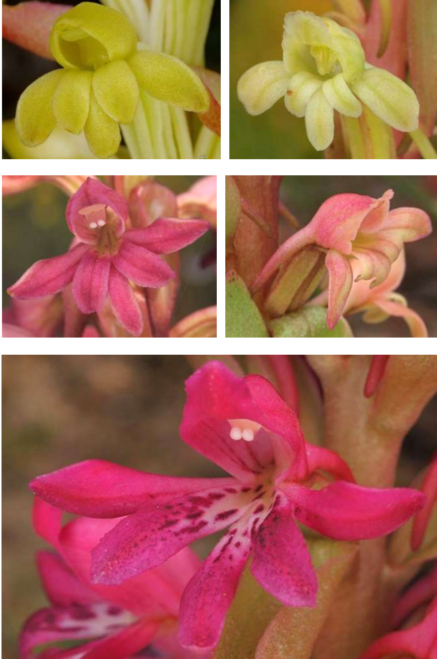
Satyrium bicornis (o l), Satyrium humile (o r), Satyrium erectum (u) mit Hybriden