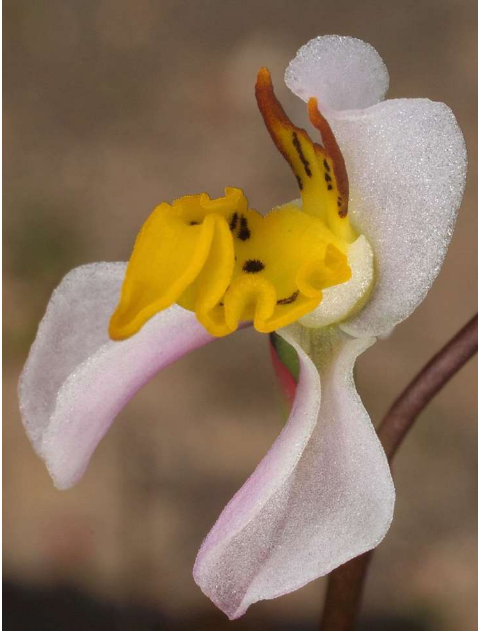
Spiegelei-Orchidee: Schizodium flexuosum