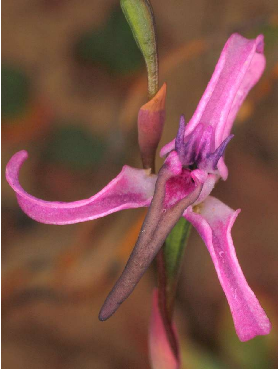
Schizodium cornutum, in seltener roter Farbvariante