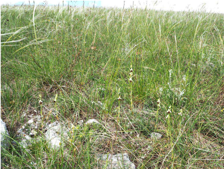
Ophrys holoserica subsp. pinguis in der Federgras-Steppe