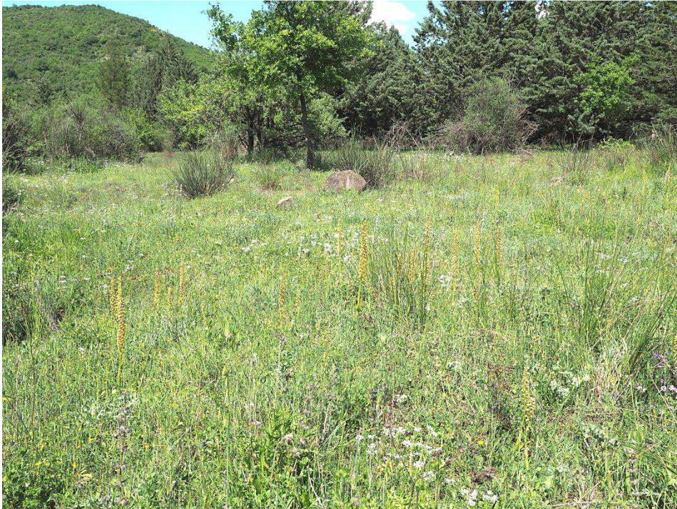
Aceras anthropophorum am Standort I 31

er erklärt uns stolz, dass er vor 2 Jahren das Treffen der GIROS hier organisiert