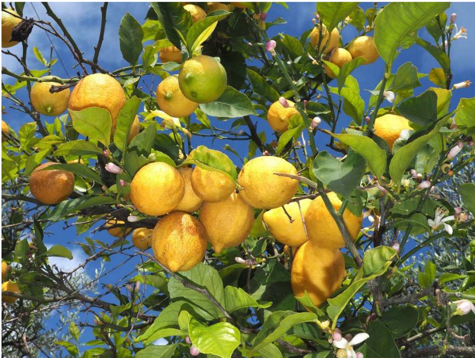
Zitronenbäume blühen und fruchten gleichzeitig

Tatsächlich war ich jetzt doch recht lange solo unterwegs. Ganz so schlimm war es aber nicht, denn auch die Kollegen sind fündig geworden, nur wenige Meter vom Auto entfernt. Auch hier stehen einige Hummeln, so dass wir nicht mehr gemeinsam den Kilometer zurücklaufen müssen und alle zufrieden sind.