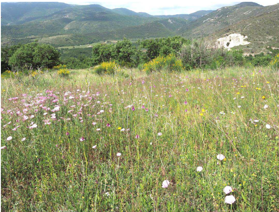
Pyramidenhundswurz und Winde sind aspektbildend am Standort I 50