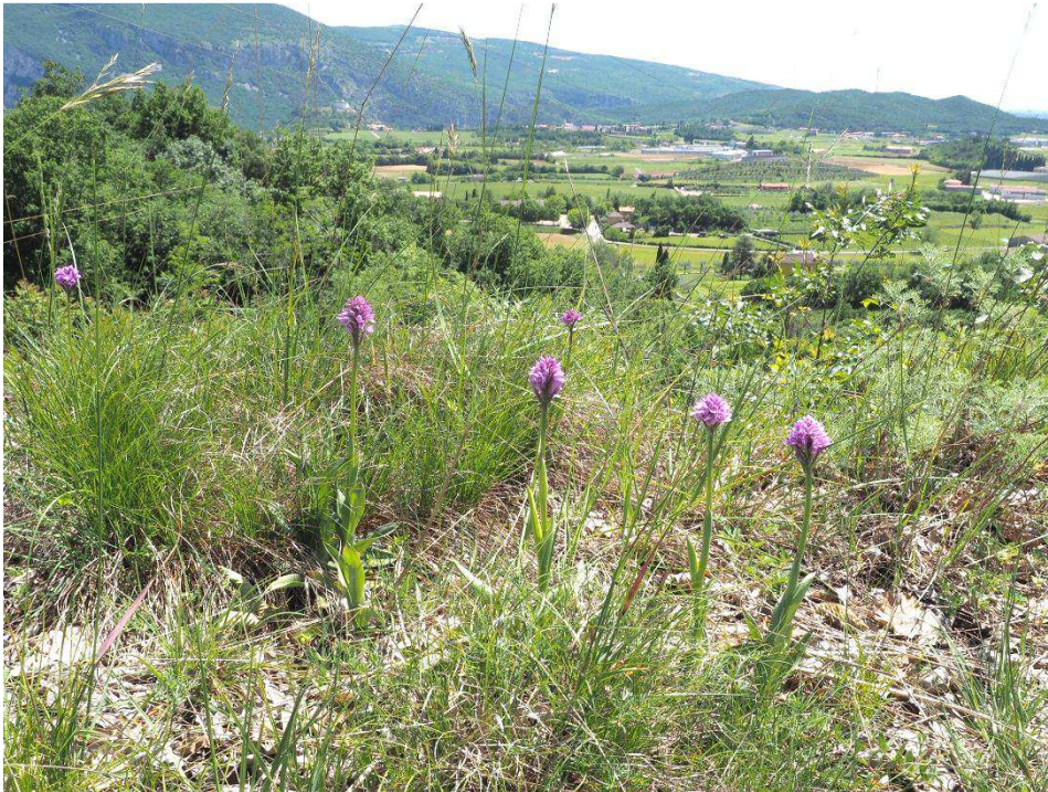
Orchis tridentata subsp. tridentata am Standort I 2

die in der Gegend um den Gardasee vorkommenden Pflanzen wurden als eigenständige Sippe Ophrys incubacea subsp. incubacea beschrieben, die sich signifikant von der ansonsten vorkommenden Ophrys atrata unterscheiden soll. Schon Peter hat vor Jahren darauf hingewiesen, dass das, was er vor 25 Jahren am Gardasee fotografiert hat, eben nicht die Schwarze Ragwurz ist, so wie wir sie aus dem Mittelmeerraum kennen. Soweit so gut. Bloß finden muss man sie. Leider sind wir zu spät dran, denn wir können nur noch ein völlig verblühtes Exemplar entdecken, bei dem es sich vermutlich um die gesuchte Art handelt. Da Orchis tridentata subsp. tridentata bereits in Blüte ist, verwundert uns das nicht. Auch die Fliegen sind schon fast vollständig durch. Es ist eben auch hier ein sehr frühes Jahr. Schade, wir hätten diese Sippe gerne selbst in Augenschein genommen. Das müssen wir uns nun für einen anderen Besuch aufheben.