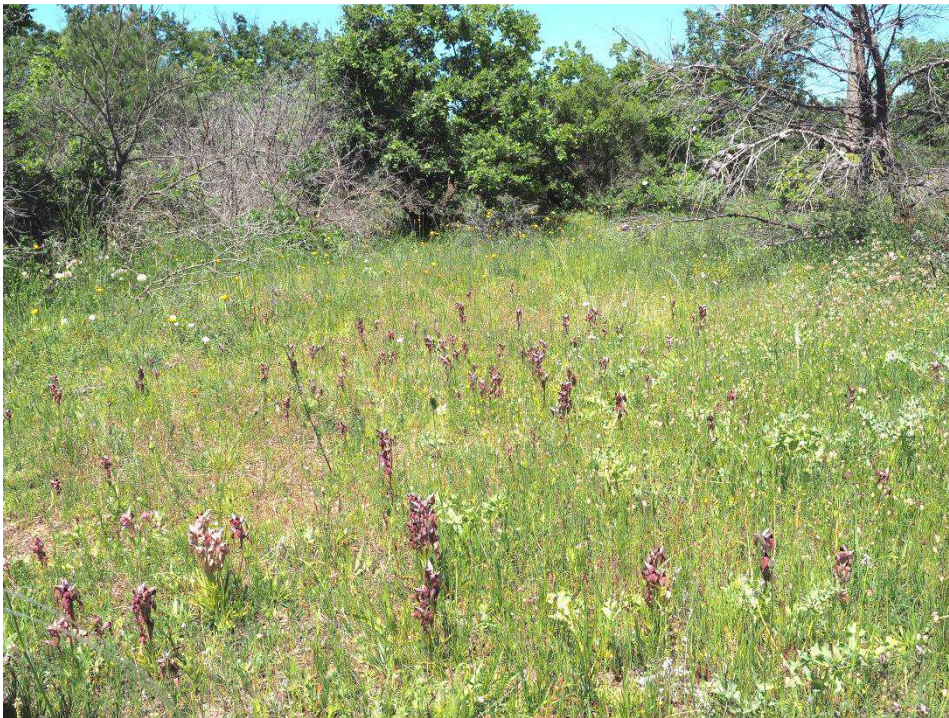
Serapias cordigera , eine der 4 Zungenständel am Standort I 34

Orchis morio subsp. morio (zerstreut, verblühend) Ophrys tenthredinifera subsp. neglecta (vereinzelt, verblüht) Ophrys fusca subsp. fusca "lucana" (vereinzelt, verblühend) Serapias cordigera (zerstreut, blühend) Ophrys bombyliflora (vereinzelt, verblüht-verblühend)