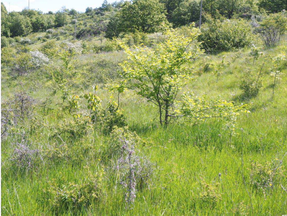
Aufgelassene Pferdeweide am Standort I 28

den Hybriden mit Ophrys tenthredinifera subsp. neglecta ist völlig verschwunden. Aus die Maus, ende Gelände. Auch in der Fläche direkt gegenüber der Kapelle, die wenigstens noch extensiv beweidet wird, ist kaum etwas zu finden. Eine Wespe und eine Ophrys fusca subsp. fusca "lucana", das ist fast nix. Am interessantesten sind noch die Hohlzungen, die hier gerade aufblühen und wegen des hohen Bewuchses noch hochgewachsener sind als auf dem Pass vor zwei Tagen.