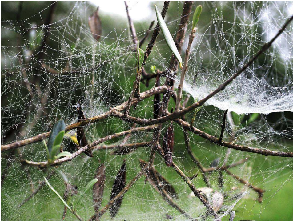
Morgendlicher Tau schafft Kunstwerke

dend vertreten. Was für ein Unterschied zu den Flächen außerhalb des Zauns, wo abwechselnd Schafe und Rinder durchziehen und bereits ganze Arbeit geleistet haben. An der Stelle mit den merkwürdigen Spinnen dann die nächste Enttäuschung. Das Gras ist sehr mastig, kein Platz mehr für Ragwurze. Erst auf der anderen Seite des Weges entdecken wir blühende Spinnen. Sie haben vergleichsweise kleine Blüten und können ohne große Probleme dem Taxon ausonia zugerechnet werden. Was für ein schnödes Ende dieses Geheimnisses.