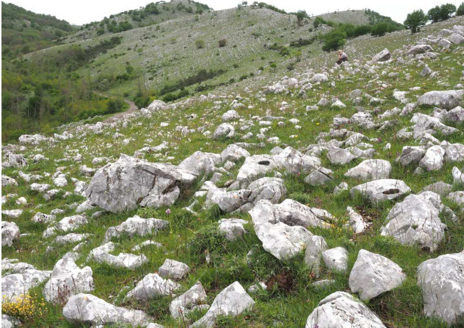
Sit-in im Orchideental

Am nächsten Standort nur wenige 100 Meter weiter macht uns dann das Wetter einen Strich durch die Rechnung. Es beginnt schauerartig zu regnen, wir müssen leider im Auto warten. Dazu läuft im Radio der passende Hit "Wake me up when it's all over". Und nach rund 30 Minuten hört der Regen tatsächlich auf, so dass wir nicht warten müssen, bis wir "old and wise" geworden sind, wie es im Lied weiter heißt. Auch wenn das Gras jetzt pitschnass ist, wir schwärmen aus und suhlen und in der Orchideenpracht. Hier stehen sogar noch kleine Schildchen mit den Namen der Orchideen, vergessene Überbleibsel des Orchideenfestes, was für ein Service. Zu den bereits genannten Arten kommen hier weitere hinzu, wobei uns die schönen Hybriden zwischen Aceras anthropophorum und Orchis simia subsp. simia besonders entzücken.