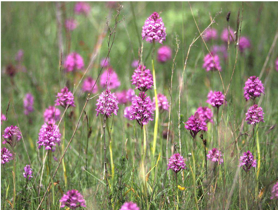
Mit 600 Millimeter-Tele eingefangen: Pyramidenhundswurz (I 47)

Wie dem auch sei, bedauerlicherweise mag Rémy mit seinem Citroen nicht warten, bis wir bei leicht bewölktem Wetter in unseren Wagen eingestiegen sind, wir würden uns dort schon an der Kreuzung treffen, ruft er uns aus dem Seitenfenster zu. Fragt sich bloß, welche von den vielen Kreuzungen er konkret meint. Und so kommt es wie befürchtet, wir stehen an einer Kreuzung, die allem Anschein nach nicht gemeint ist. Wir suchen weiter, und erst mit Verspätung entdecken wir dann den Orchideentross doch noch. Die Damen und Herren sind schon fleißig beim Fotografieren und Debattieren, als wir uns unauffällig anschließen. Der erste Platz dürfte gleichzeitig auch der Beste sein. Wir kennen ihn bereits, aber auch diesmal kommt die Diskussion auf, was denn da mit Ophrys lacaitae eingekreuzt ist. Wir sind der Meinung, dass es sich um Ophrys holoserica subsp. gracilis handeln müsste, auch wenn einige Exemplare ausgeprägte Höcker haben. Denkbar wäre aber auch das Taxon appennina (siehe Farbtafeln).