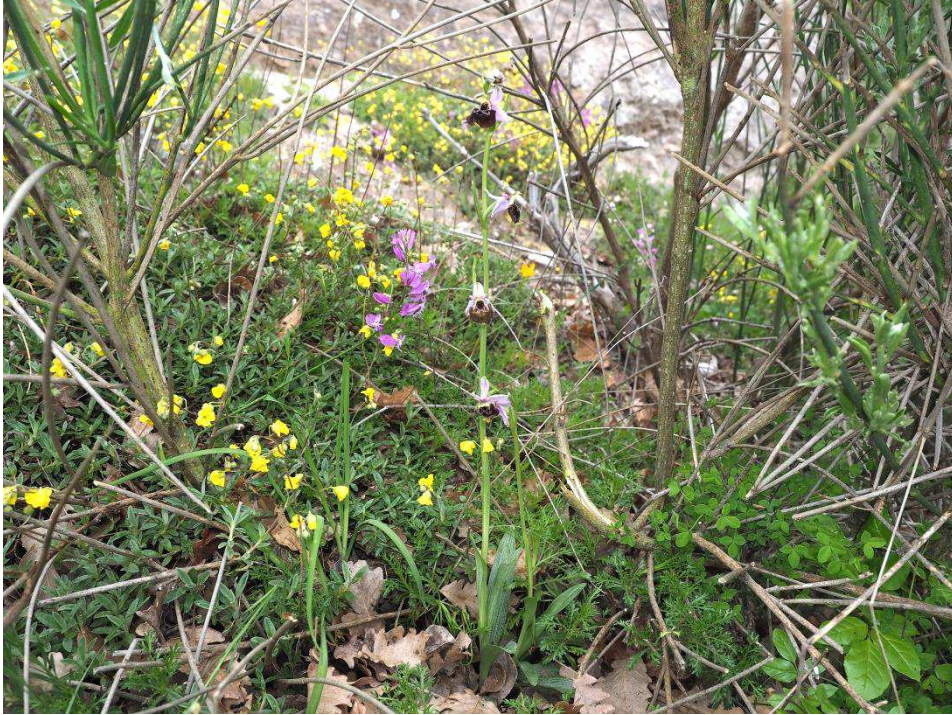
Gut versteckt: Ophrys crabronifera subsp. biscutella

wachsen - Orchidee stehen sollten. In einem Gebüsch werden wir dann aber doch fündig. Es ist eine voll erblühte Ophrys crabronifera subsp. biscutella , also können wir diese hübsche Art doch hier bestätigen. Und je länger wir auf beiden Seiten der Straße suchen, desto mehr Exemplare werden es schließlich, wir sind zufrieden.