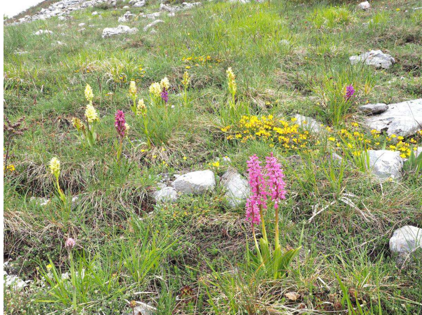
D. sambucina , O. mascula , O. tridentata und O. x colemannii am Monte Zurrone