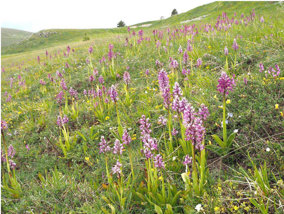
Seltener Anblick: Helm- und Purpur-Knabenkraut mit Hybriden

Gran Sasso d'Italia, halten wir und genehmigen uns noch Kaffee und Eis. Und auch zwei kleine Schapsfläschchen mit Limoncello und Enzian aus der Gegend müssen noch in den Kofferraum, bevor wir auf die Autobahn gen Norden fahren. Wir wollen versuchen, noch so weit als möglich voranzukommen, bevor wir uns an der Strecke eine letzte Übernachtung auf dieser Reise suchen. p.s.: In Deutschland wurden die Fläschchen recht schnell trockengelegt.