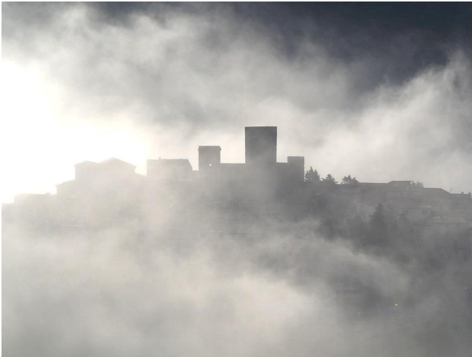
Blick vom Hotelzimmer auf Ausonia

schlägen beginnt es heftig zu regnen. Da bleibt nur die Flucht ins Auto. Die Liste bleibt deshalb relativ kurz.