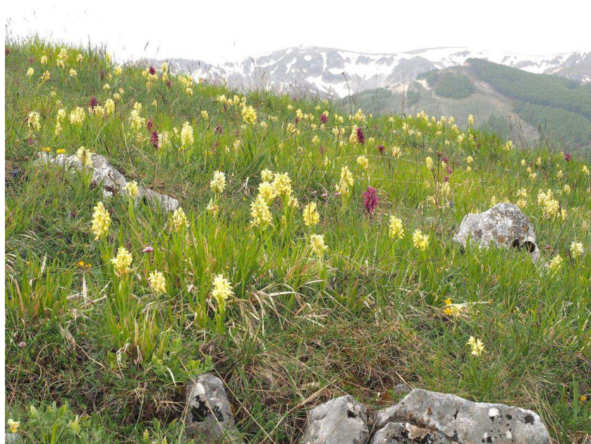
Holunder-Knabenkraut soweit das Auge reicht