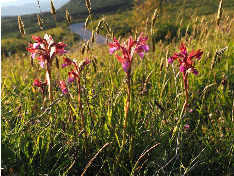
Schmetterlinge im letzten, warmen Sonnenlicht

Coeloglossum viride (zerstreut, blühend) Orchis provincialis (zerstreut, verblühend) Orchis papilionacea subsp. papilionacea (zerstreut, blühend) Orchis mascula subsp. mascula x Orchis provincialis (2 Ex., verblühend)