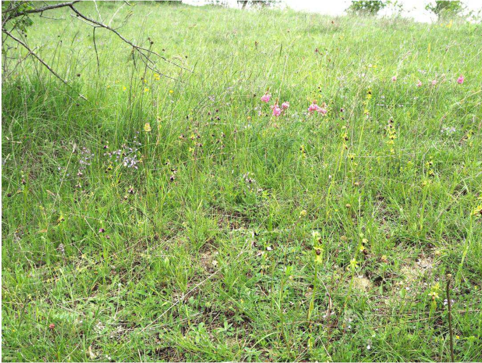
O. bertolonii subsp. bertolonii und O. sphegodes s.l. am Standort I 49

Ophrys holoserica subsp. dinarica x Ophrys sphegodes s.l. (2 Ex., bl.)