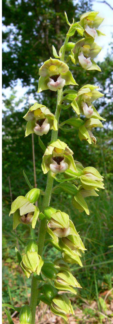
Epipacten an den Standorten B1 und B2