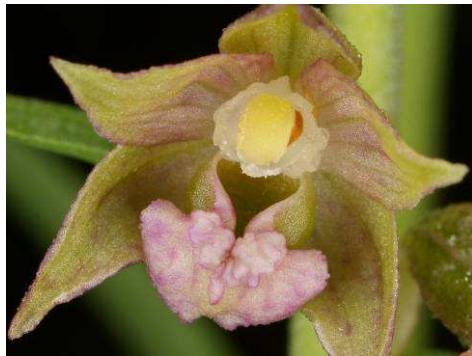
Malaxis monophyllos ; Epipactis distans ; E. distans x E. atrorubens subsp. atrорubens