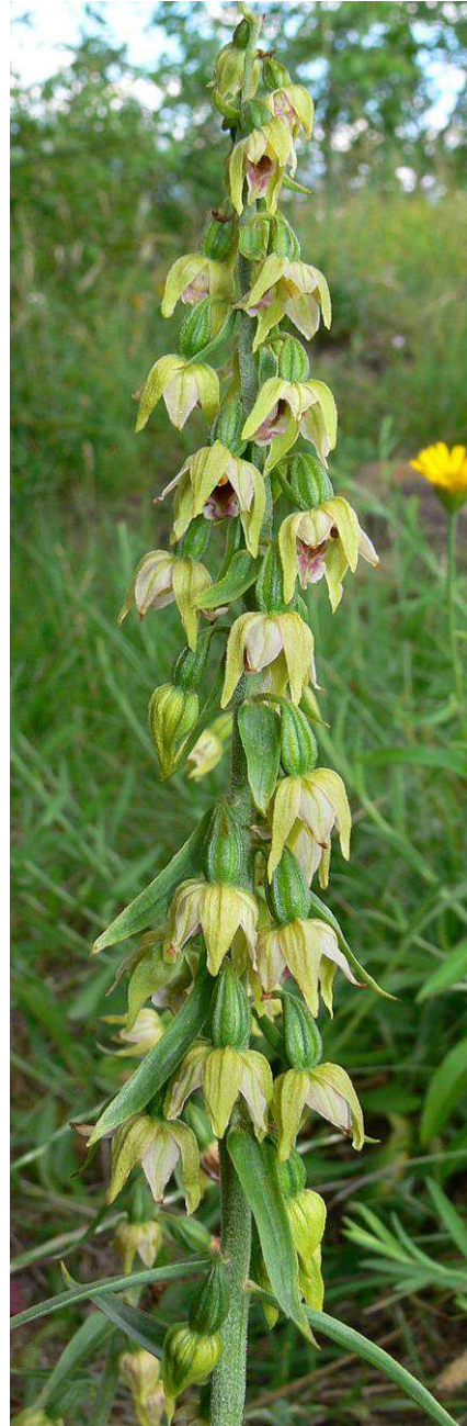
Epipacten an den Standorten B1 und B2 ( E. tremolsii subsp. latina ??)