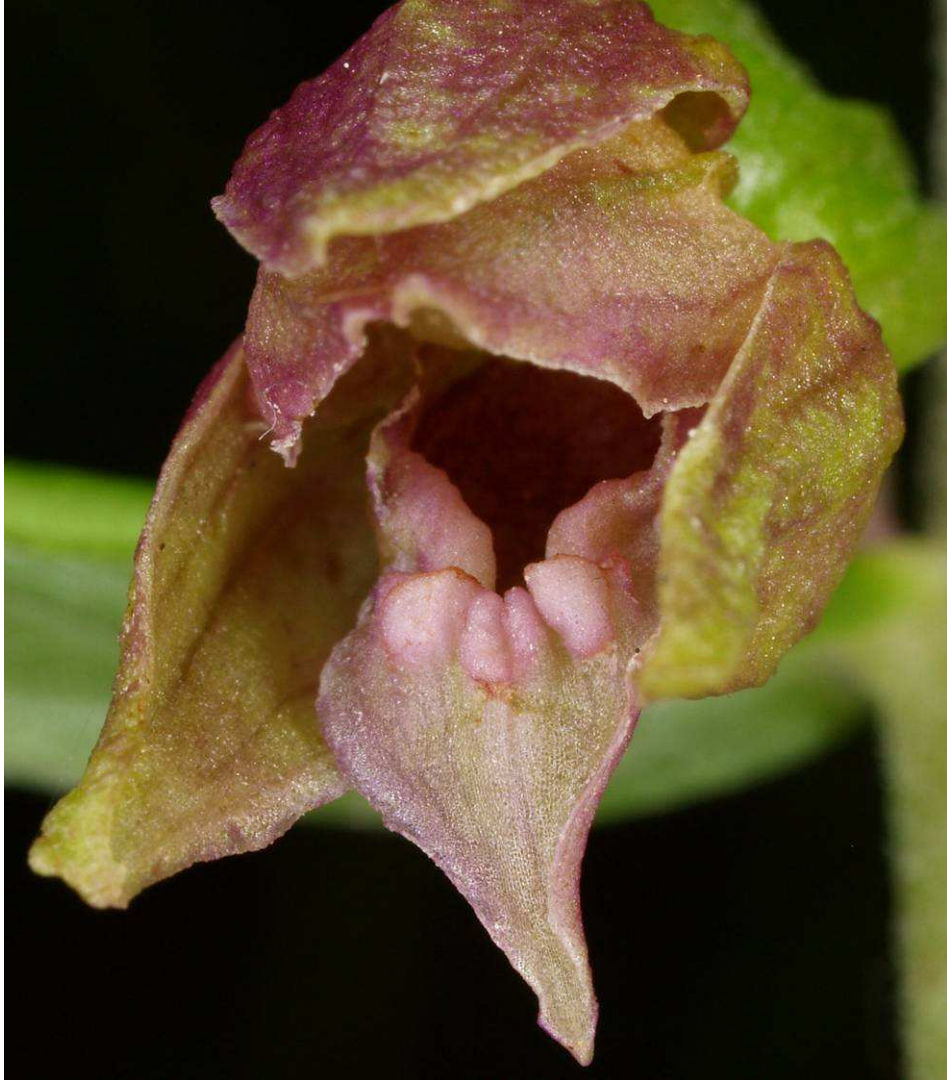
E. microphylla x E. leptochila subsp. dinarica oder E. atrorubens subsp. atrorubens x E. leptochila subsp. dinarica