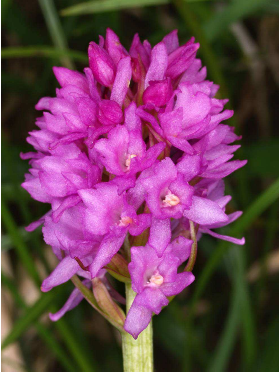
Nigritella lithopolitana x Gymnadenia conopsea