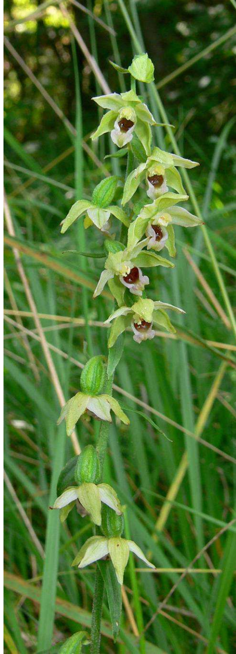
Epipactis muelleri am Standort B 1