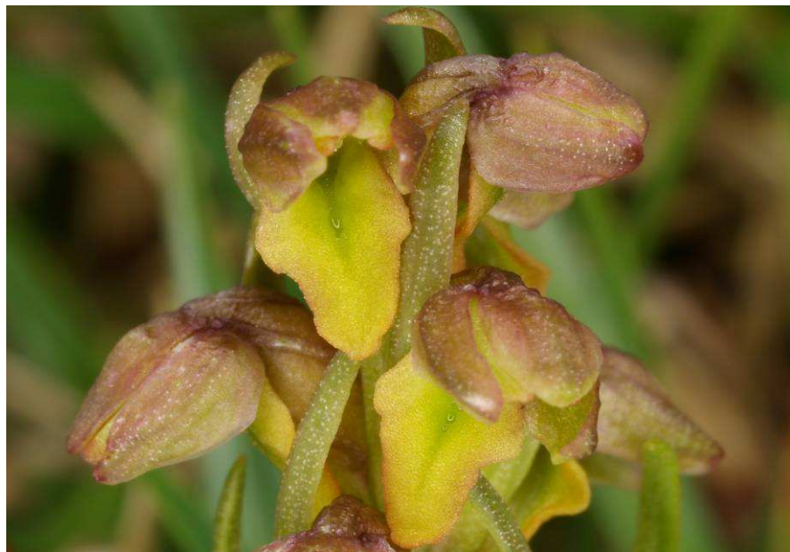
Nigritella lithopolitana x Gymnadenia conopsea ; Chamorchis alpina