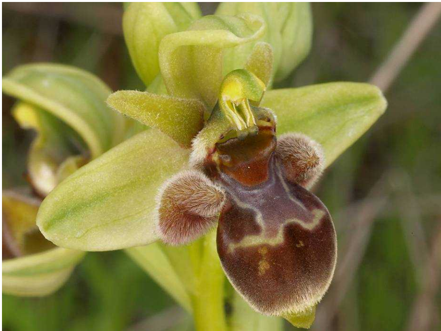
Ophrys helena und Ophrys bombyliflora x Ophrys umbilicata subsp. attica