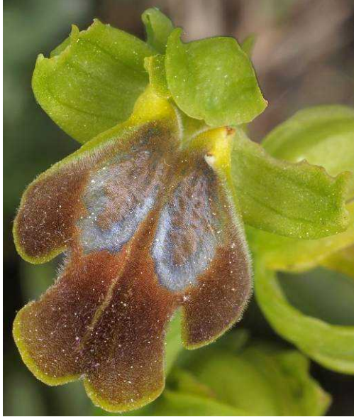
Ophrys fusca subsp. leucadica