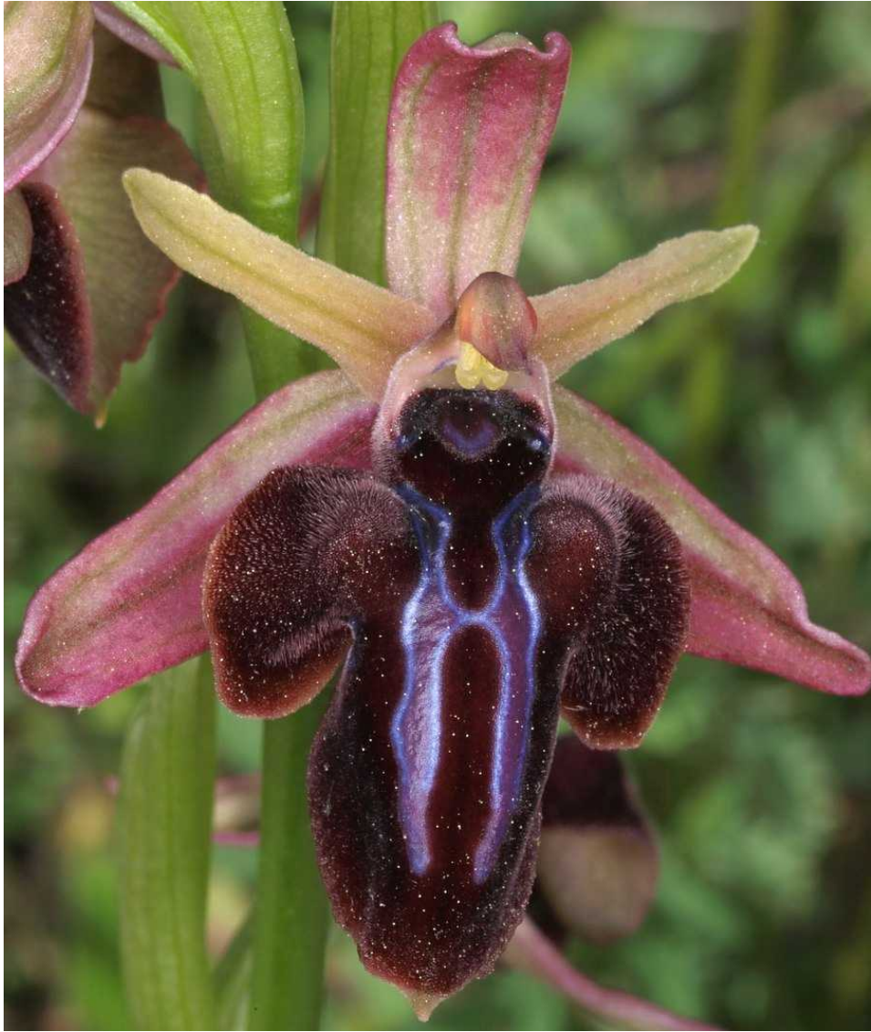
Ophrys spruneri subsp. spruneri in einer schmallippigen Form