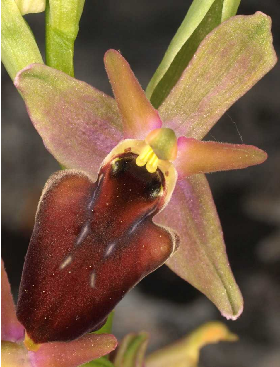
Ophrys oestrifera subsp. crassicornis ("cerastes") x Ophrys helena