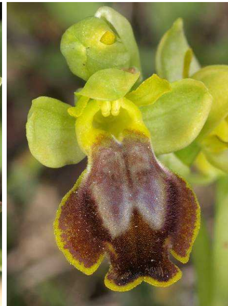
Ophrys lutea subsp. melena