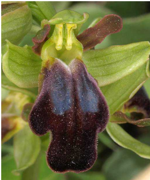
Ophrys fusca subsp. calocaerina