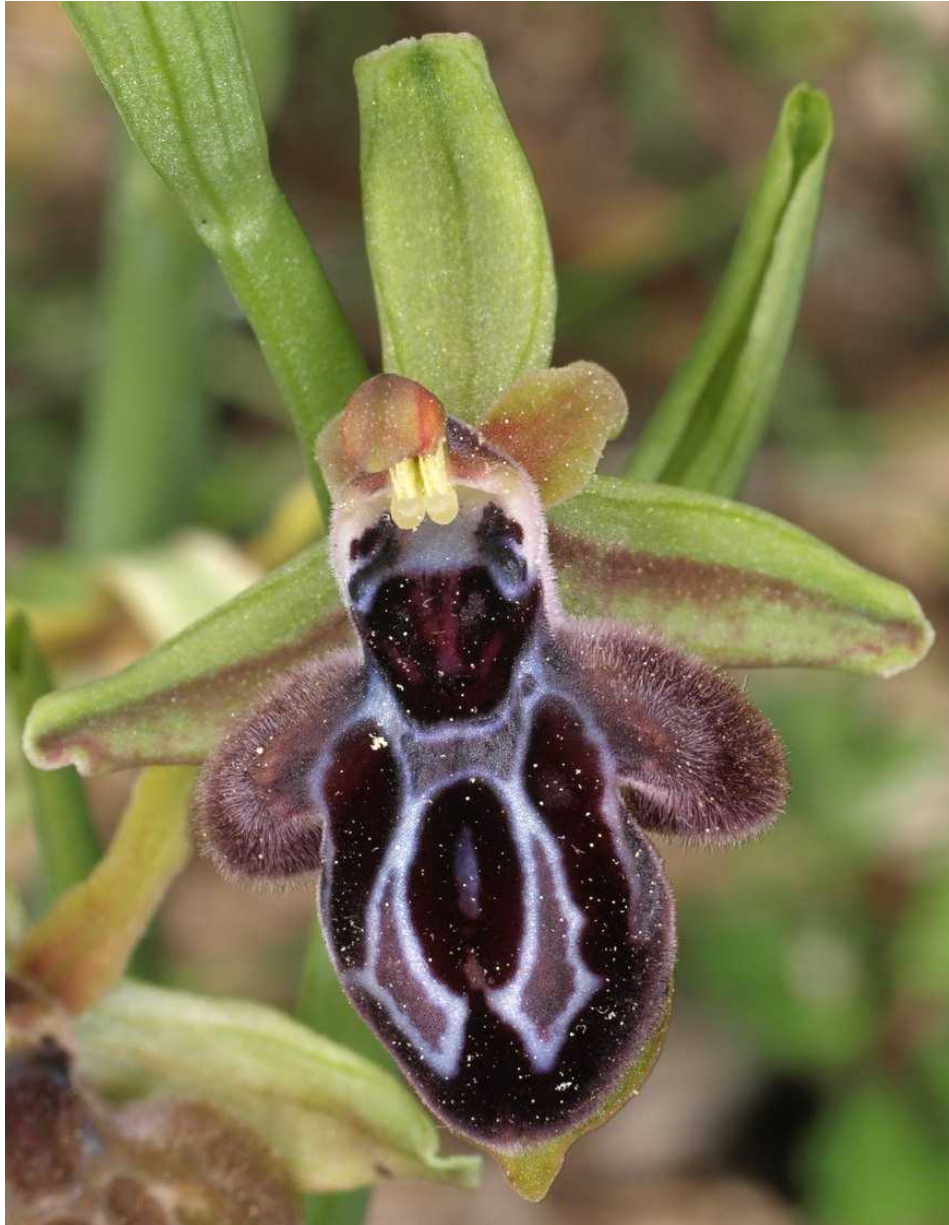
Extrem selten auf dem Peloponnes: Ophrys cretica subsp. cretica