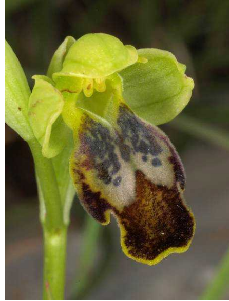
Ophrys fusca subsp. perpussilla ?