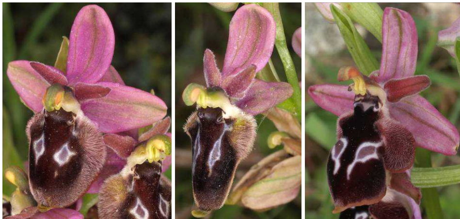
Ophrys tenthredinifera subsp. ulysssea x Ophrys reinholdii subsp. reinholdii (2x), Ophrys reinholdii subsp. reinholdii (rechts)