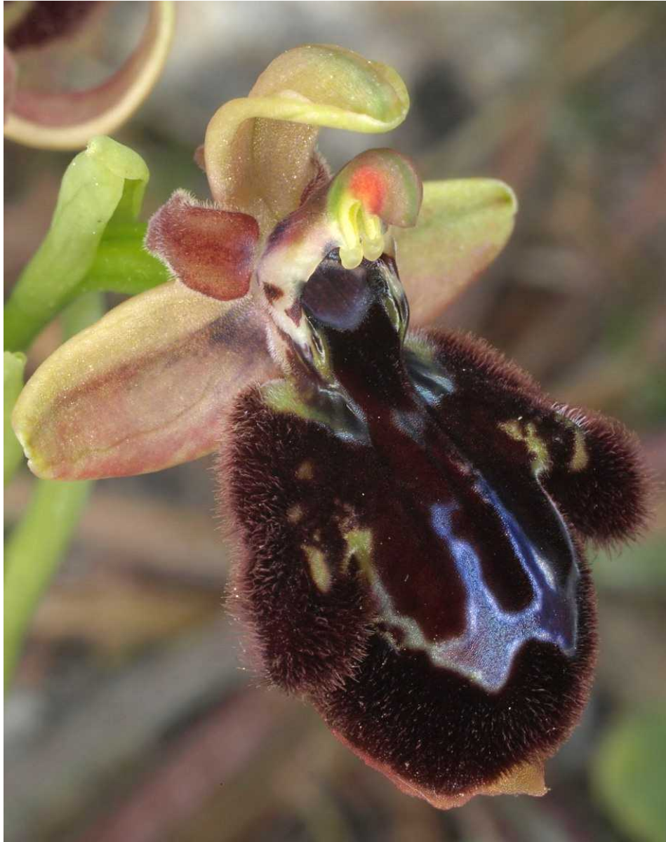
Ophrys speculum subsp. speculum x Ophrys ferrum-equinum subsp. ferrum-equinum