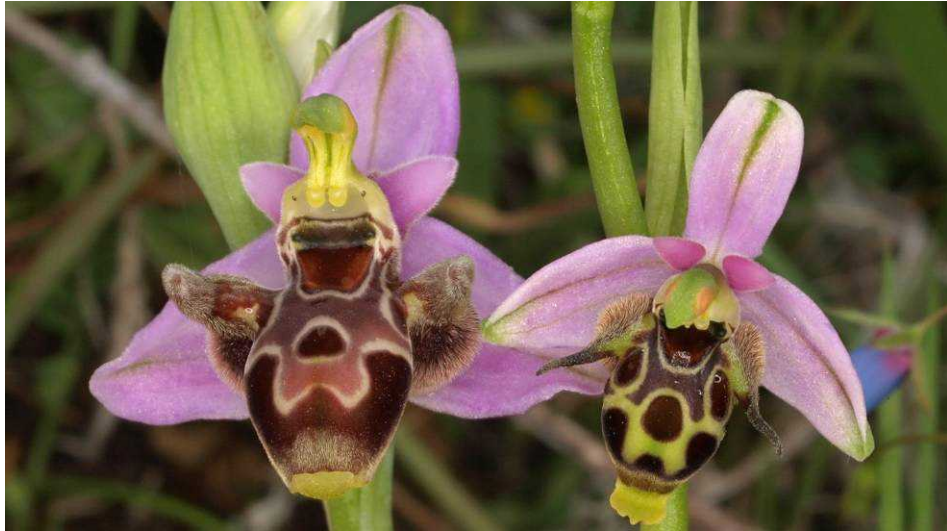
Ophrys oestrifera : Subspezies crassicornis (li) und Subspezies leptomera ?