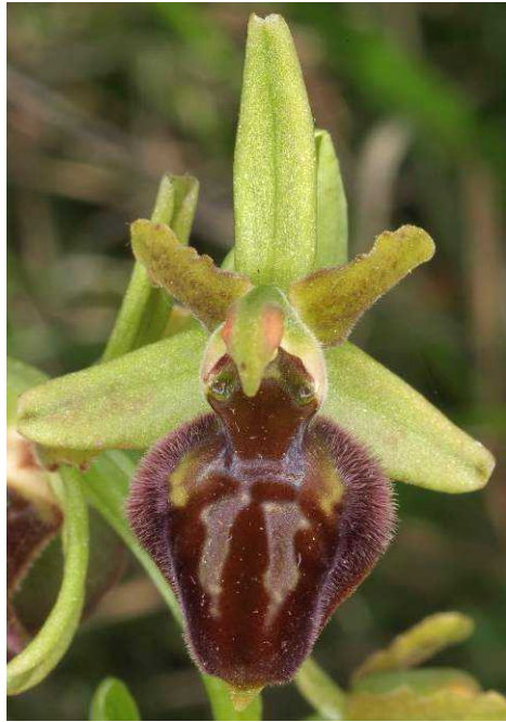
Ophrys candica subsp. candica ? und Ophrys candica subsp. lacaena (2x) Ophrys sphegodes subsp. cephalonica