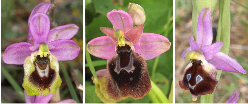
Ophrys tenthredinifera subsp. ulysssea x Ophrys argolica mit Eltern