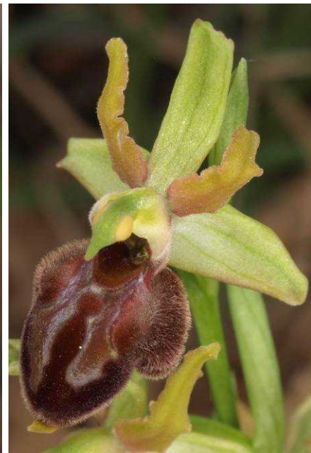
Ophrys hebes bei Kosmas, Ophrys hebes bei Negades (3 x) ??