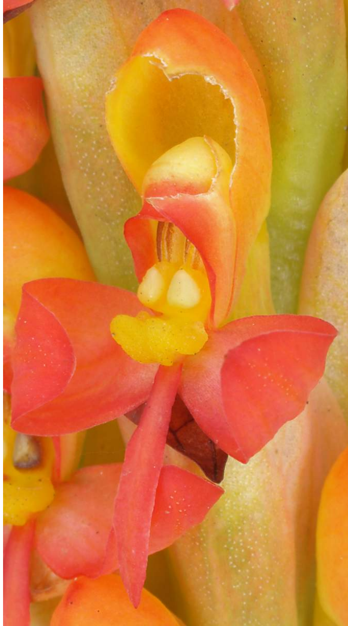
Disa chrysostachia wird in Südafrika "rote Fackel-Orchidee" genannt