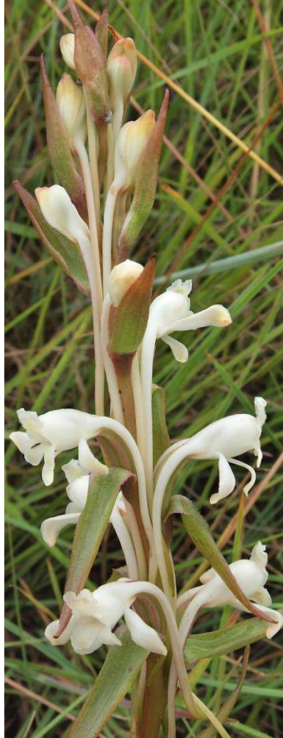
Satyrium longicauda, abweichende, noch nicht beschriebene Form „planifolia“ (2x)