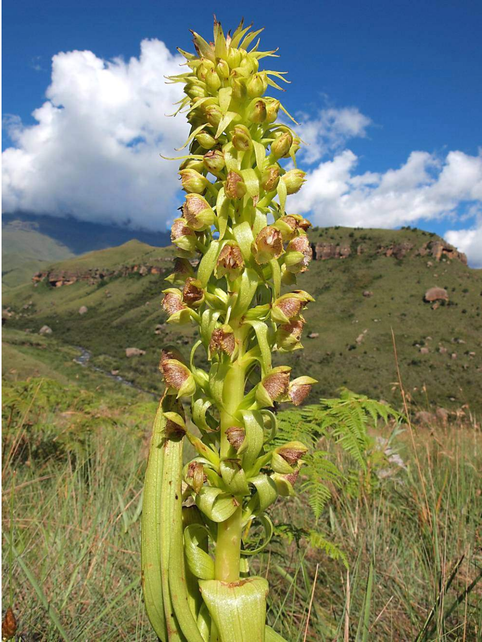
Pterigodium magnum vor der Kulisse der Drakensberge in Giants Castle