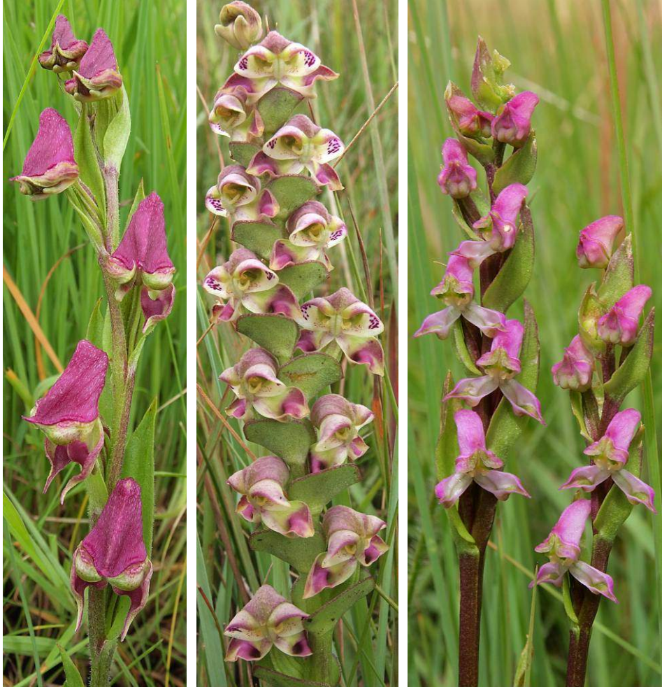
Disperis stenoplectron , Disperis renibracteata , Disperis tysonii