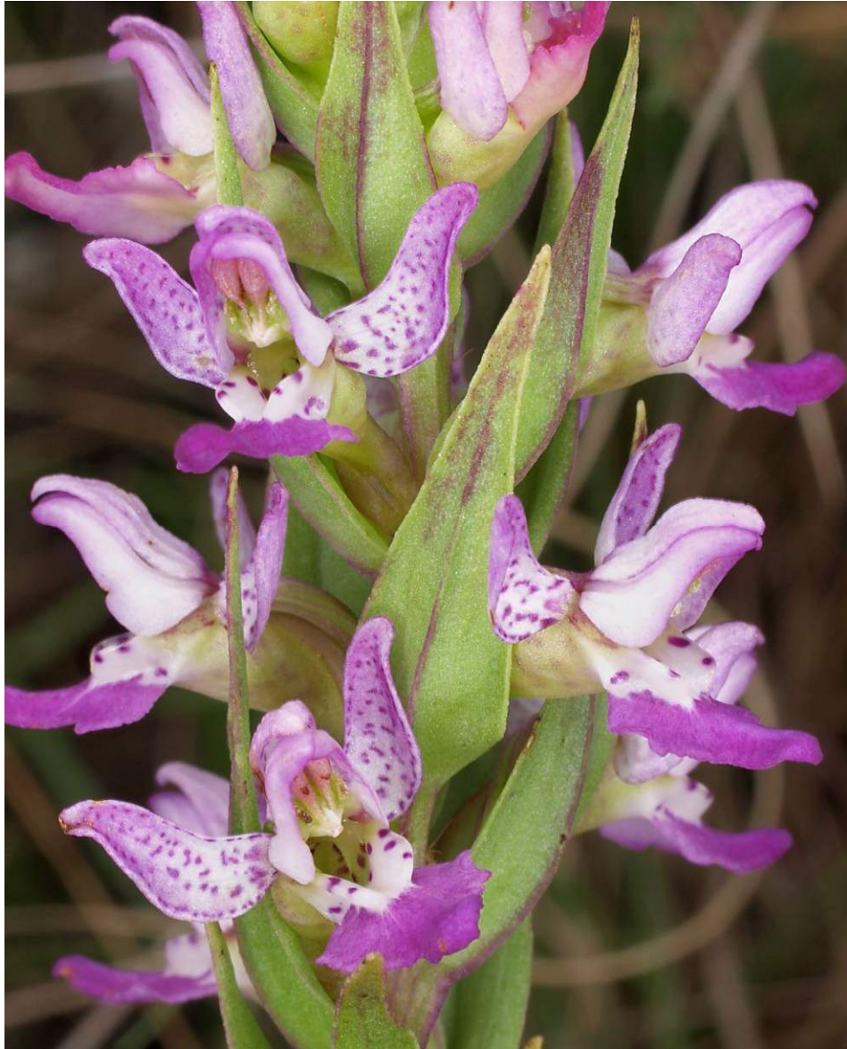
Die Vertreter der Gattung Brachycorythis (hier: Brachycorythis tenuior ) ähneln unseren heimischen Knabenkräutern