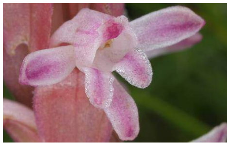
Satyrium longicauda var. jacottetianum