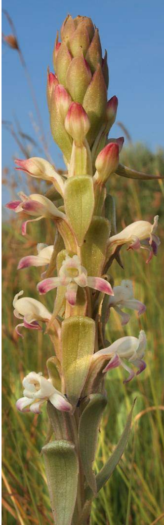
Satyrium longicauda var. longicauda