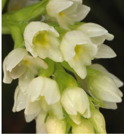
Schizochilus ceciliae var. transvaalensis