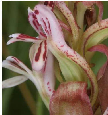
Satyrium cristatum var. longilabiatum