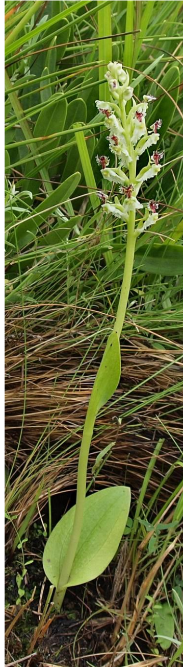
Traum für jeden Orchideenfreund: Huttonea woodii