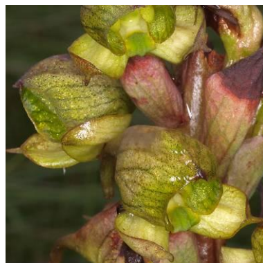
Disa cornuta (Natal)