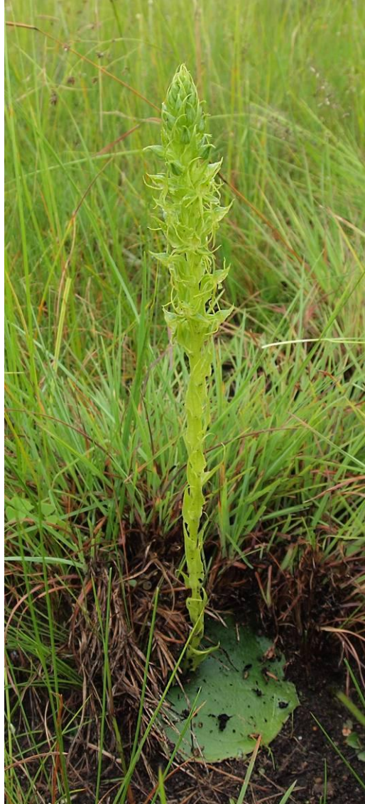
Habenaria tysonii mit ungewöhnlich großen Hochblättern