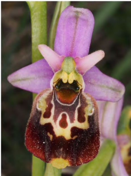
Ophrys holosericea subsp. demangei