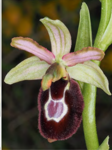
Ophrys bertolonii subsp. drumana