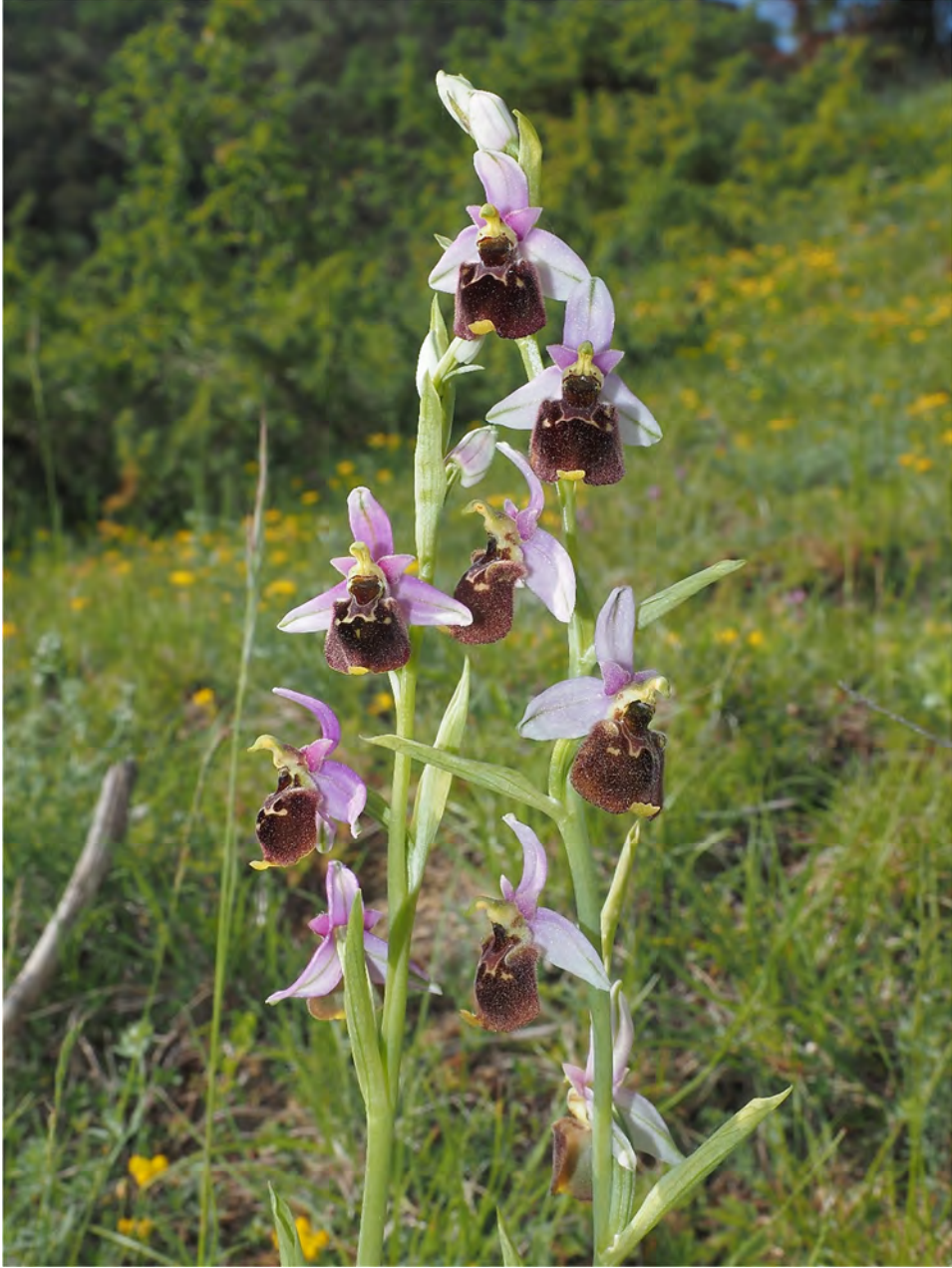
Ophrys holosericea subsp. demangei