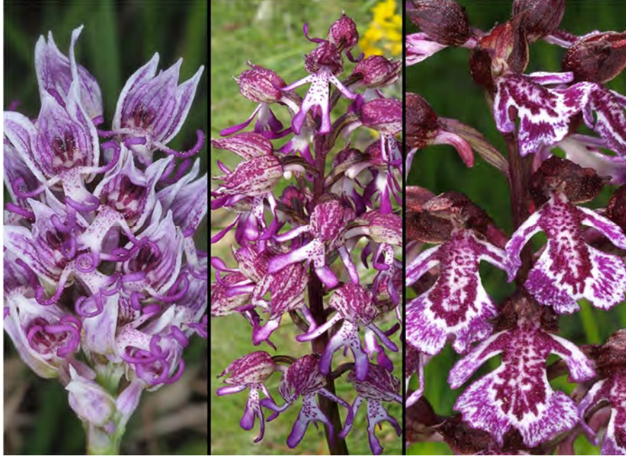
Orchis simia subsp. simia , Orchis purpurea subsp. purpurea und Hybride (m)