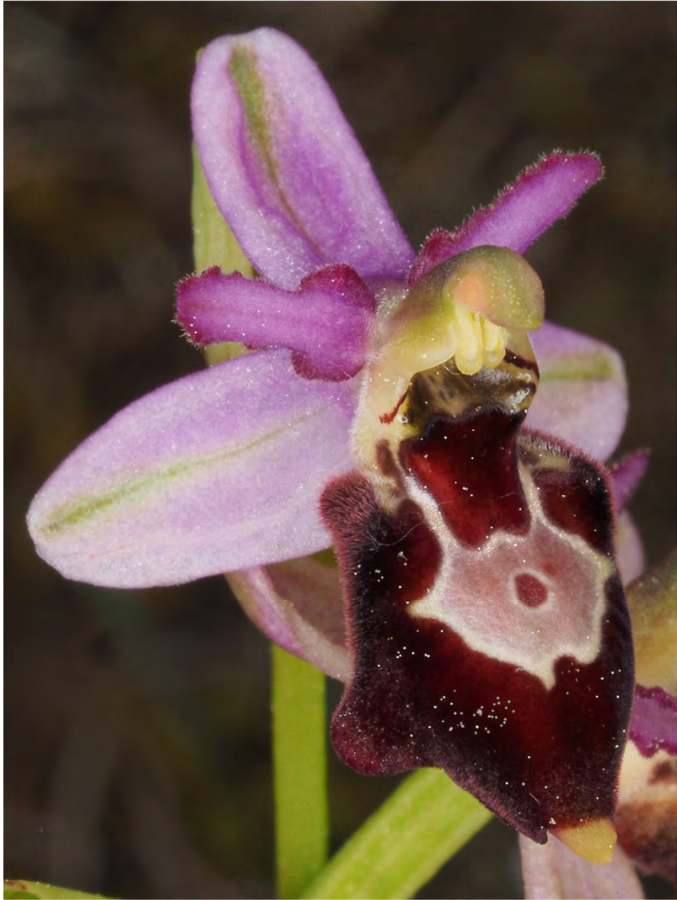
Ophrys holosericea subsp. demangei x Ophrys bertolonii subsp. drumana