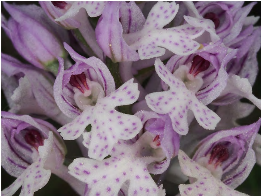
Orchis tridentata subsp. tridentata