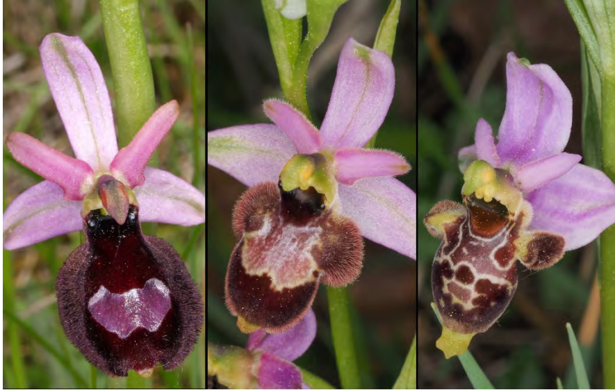
Ophrys bertolonii subsp. drumana, Ophrys scolopax subsp. scolopax und Hybride