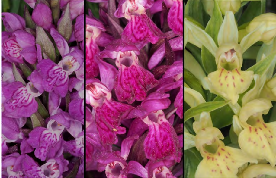
Dactylorhiza majalis subsp. majalis , Dactylorhiza sambucina und Hybride (m)