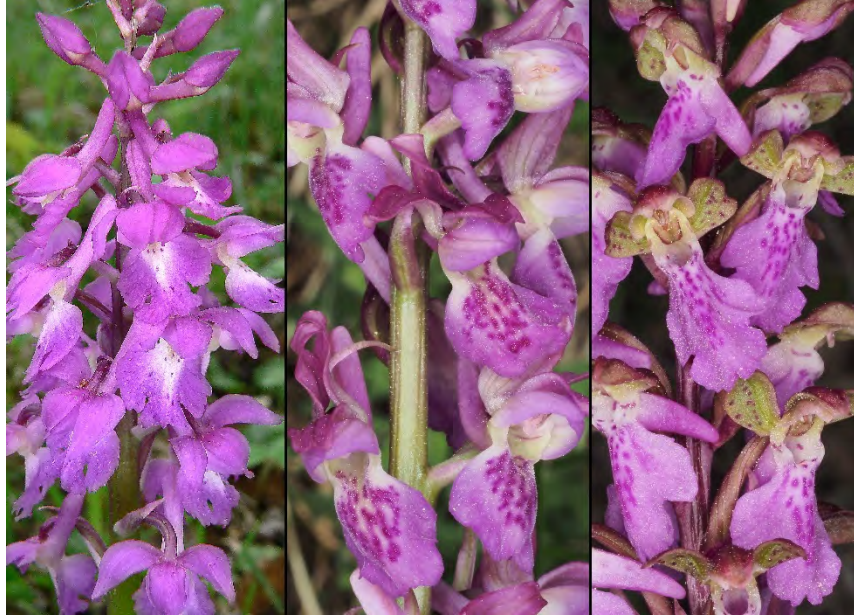
Orchis mascula subsp. mascula , Orchis spitzelii subsp. spitzelii und Hybride (m)