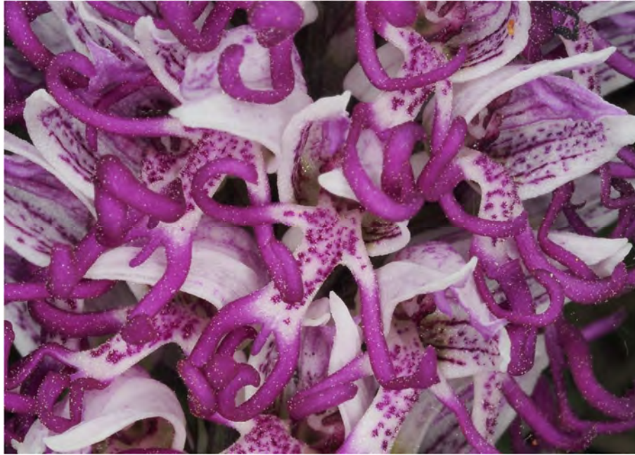
Orchis simia subsp. simia