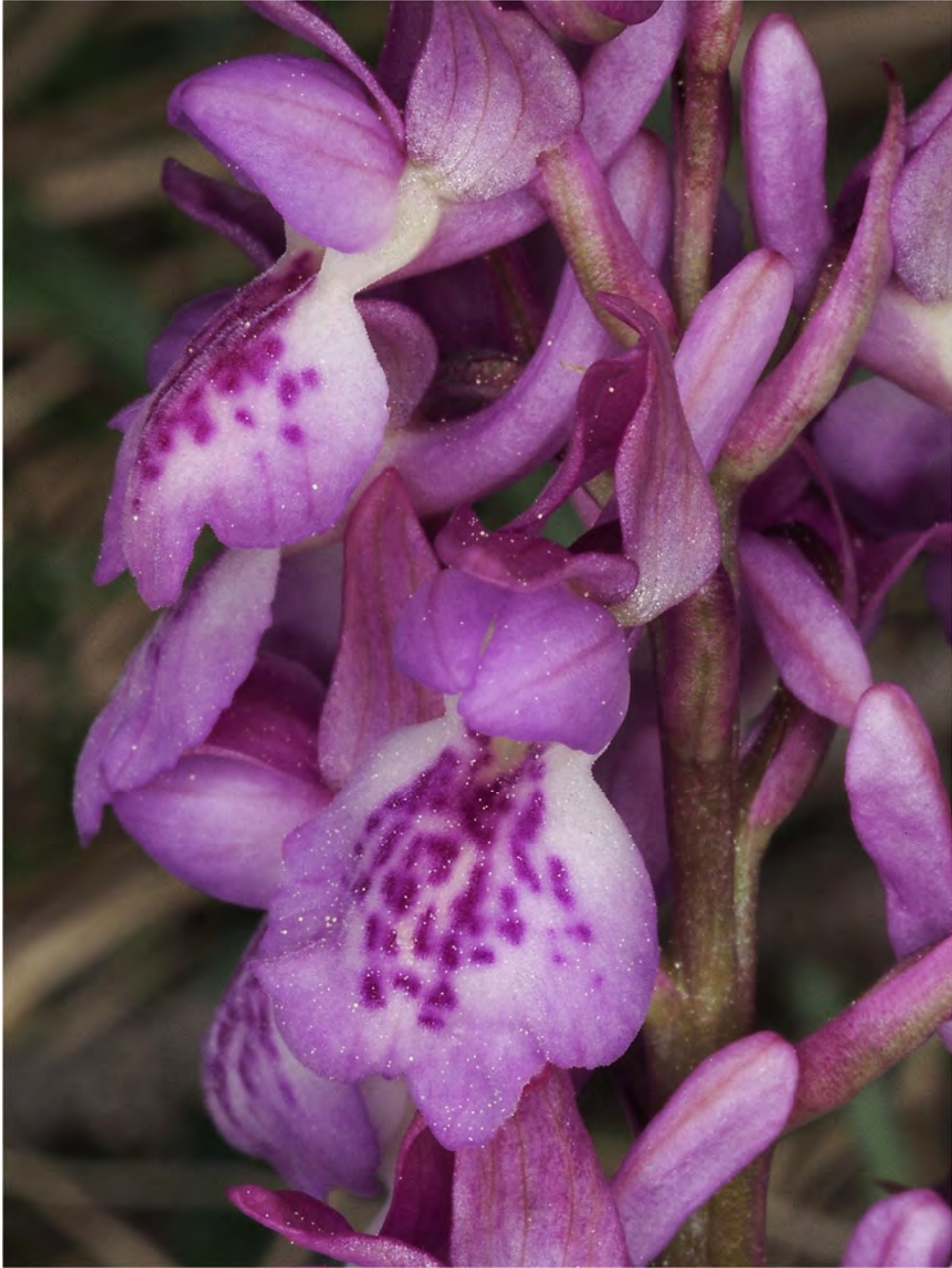
Orchis mascula subsp. mascula x Orchis spitzelii subsp. spitzelii