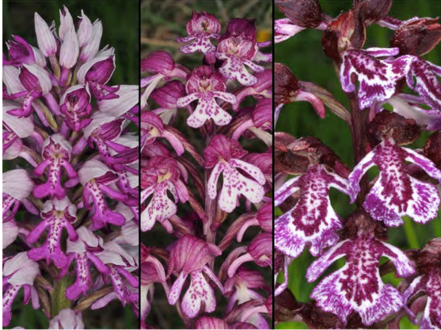
Orchis militaris subsp. militaris , Orchis purpurea subsp. purpurea und Hybride (m)