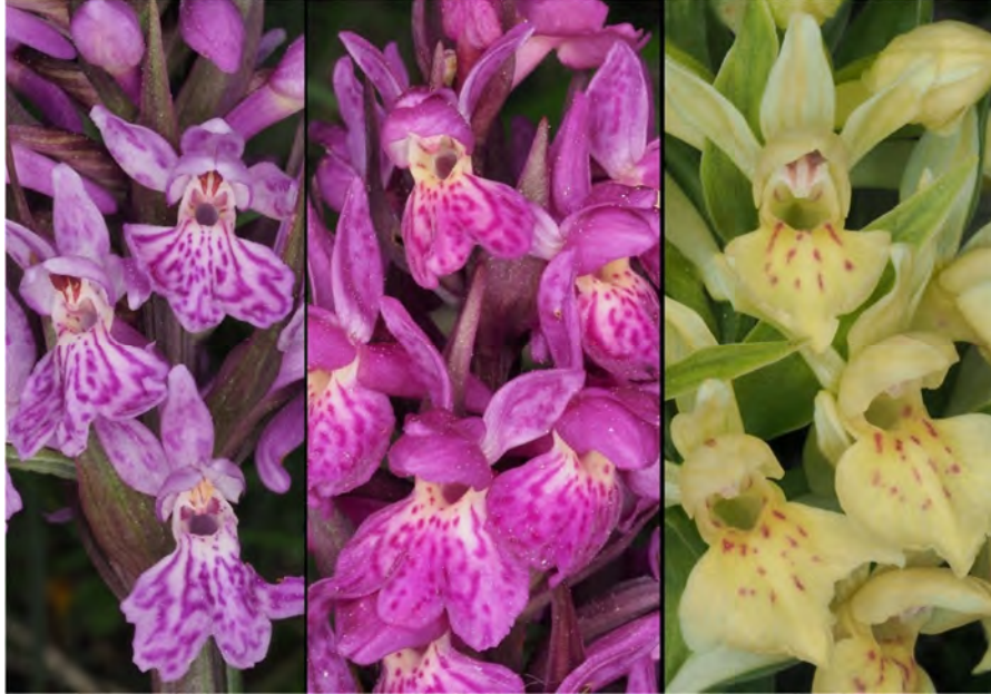
Dactylorhiza maculata subsp. fuchsii , Dactylorhiza sambucina und Hybride (m)