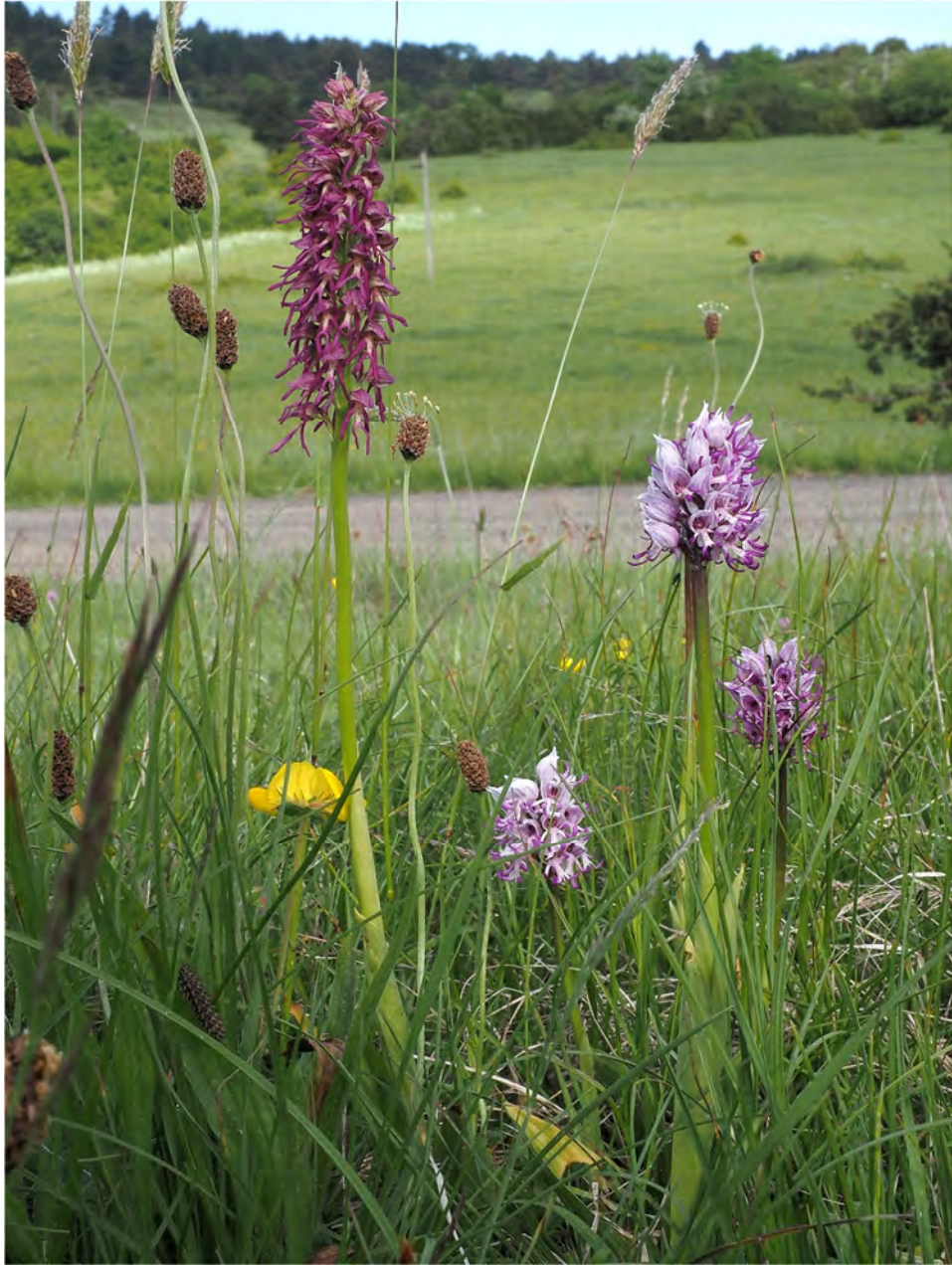
Aceras anthropophorum x Orchis simia subsp. simia mit Orchis simia subsp. simia