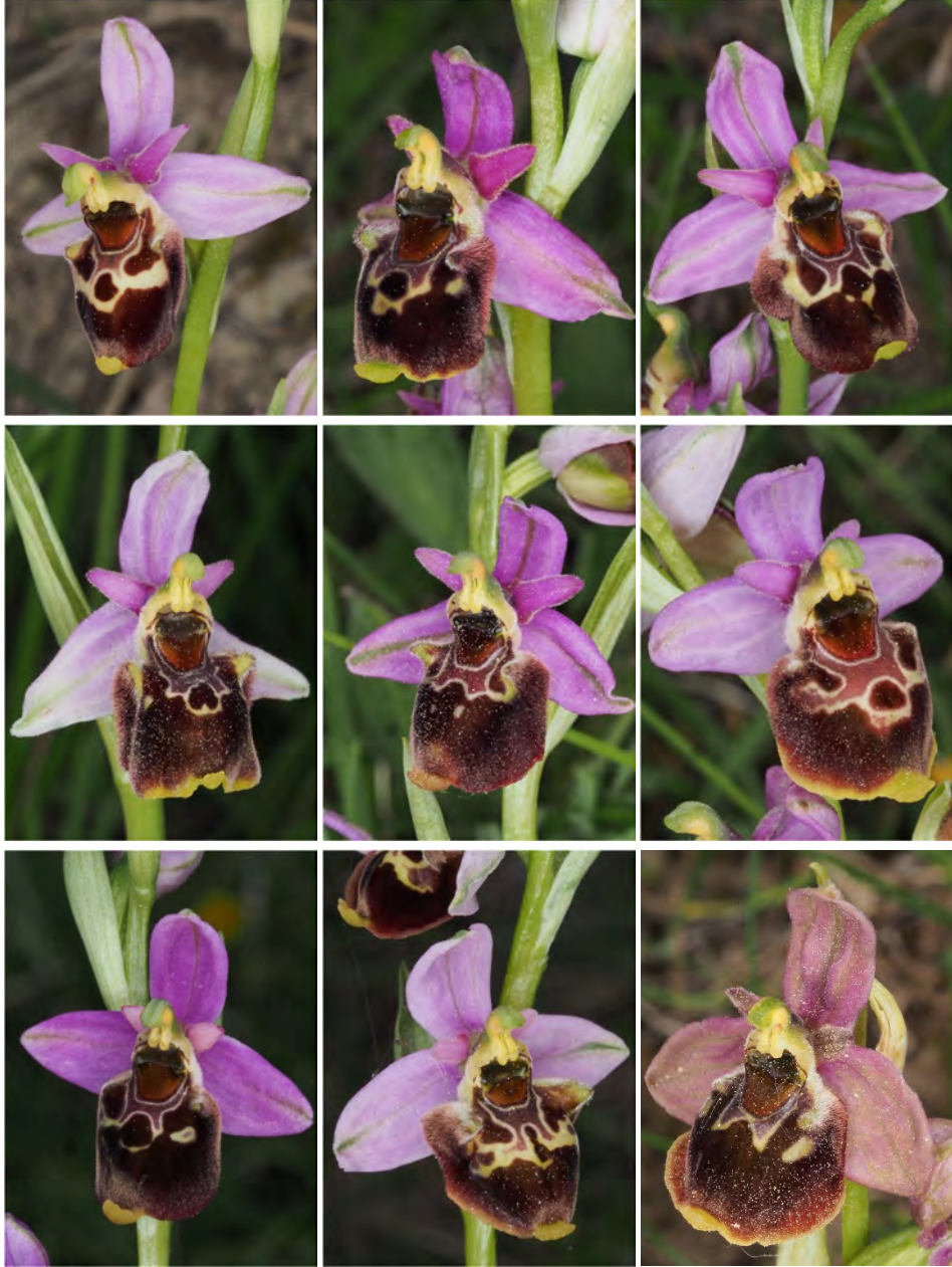
Ophrys holosericea subsp. demangei