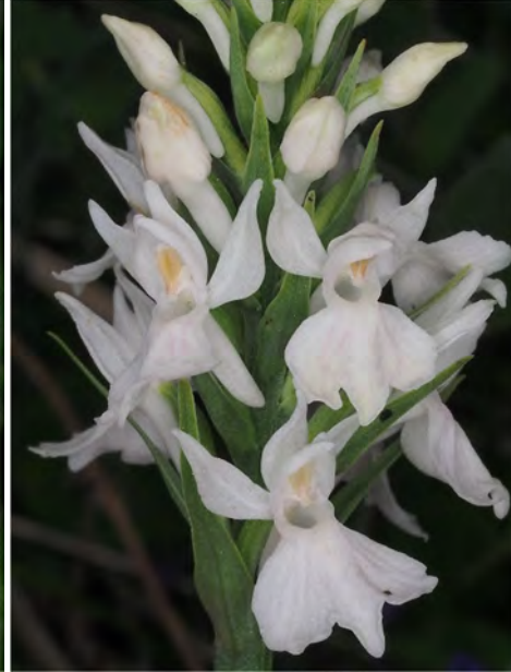
Dactylorhiza maculata subsp. fuchsii