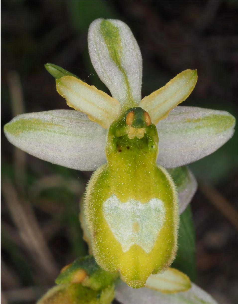
Ophrys bertolonii subsp. drumana