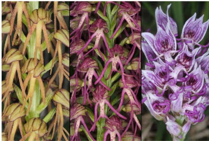
Aceras anthropophorum , Orchis simia subsp. simia und Hybride (m)