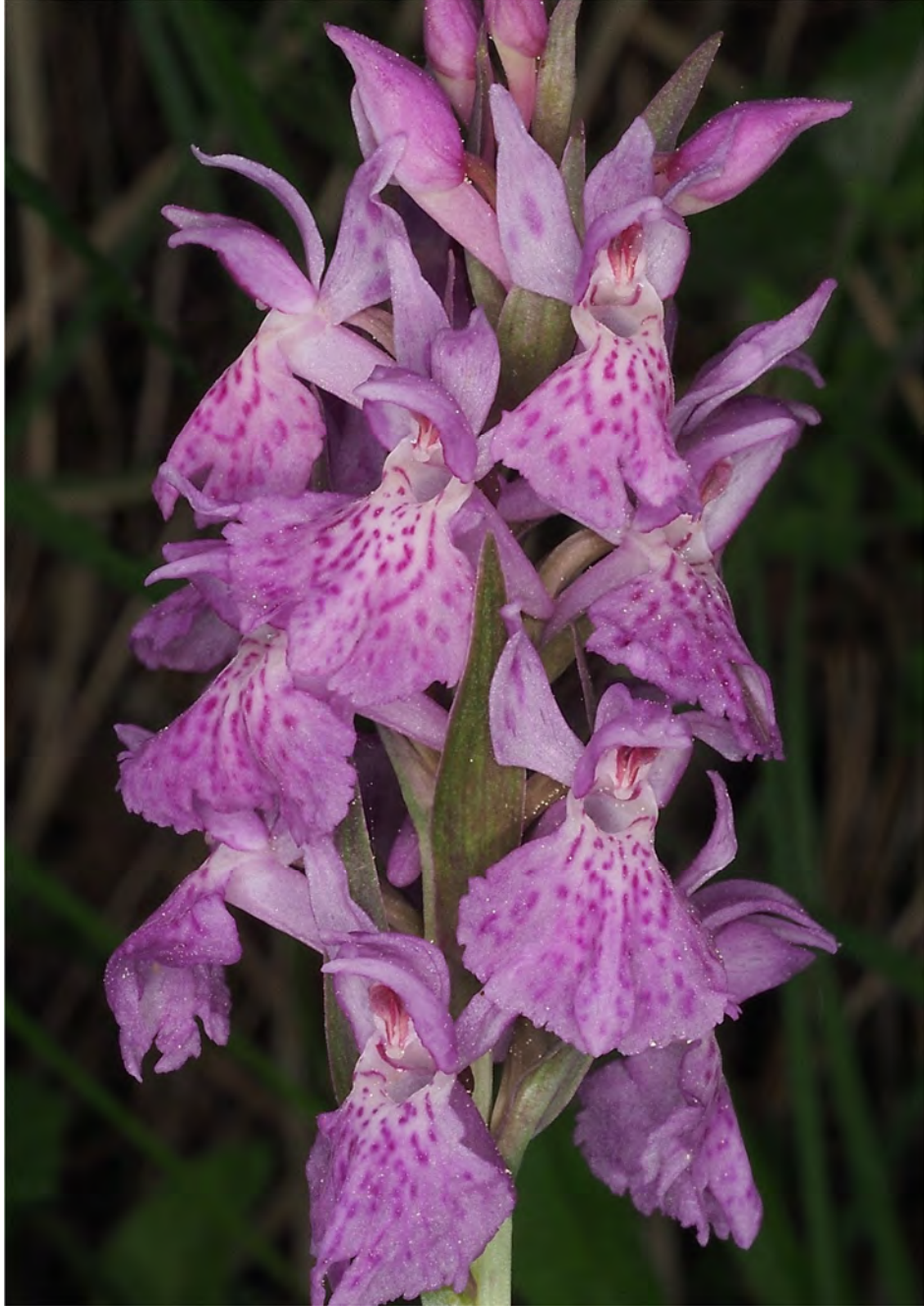
Dactylorhiza maculata subsp. fuchsii x Dactylorhiza sambucina