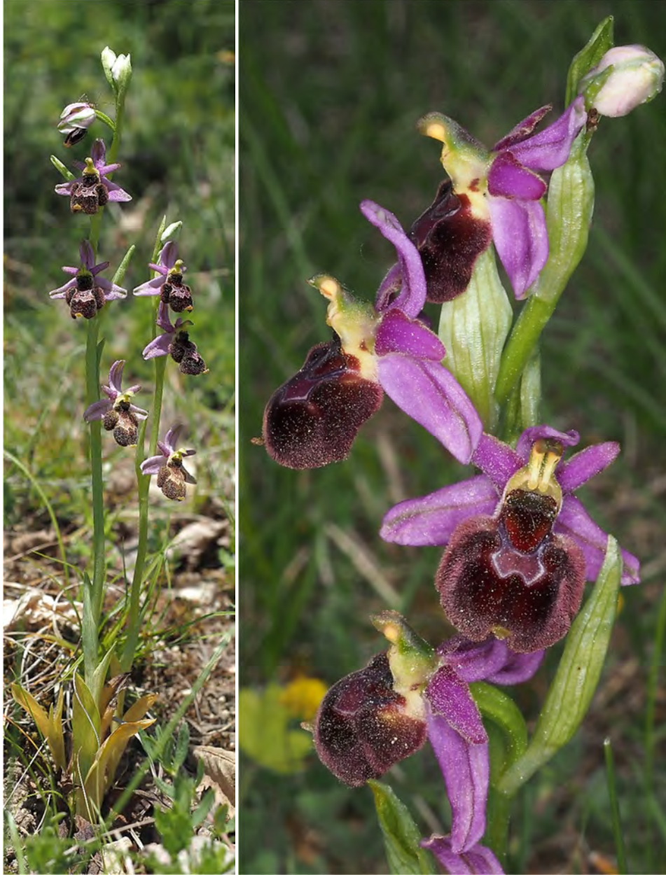
Ophrys holosericea subsp. demangei x Ophrys bertolonii subsp. drumana