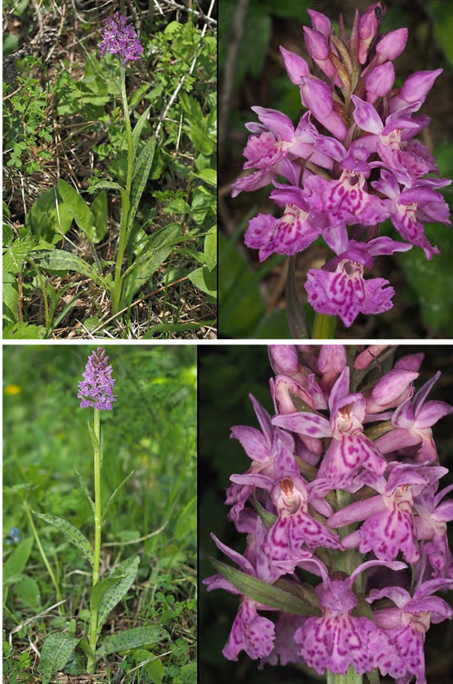
Dactylorhiza maculata subsp. fuchsii x Dactylorhiza sambucina