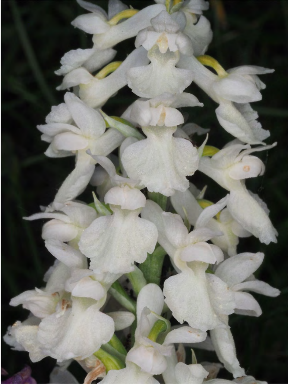
Orchis mascula subsp. mascula