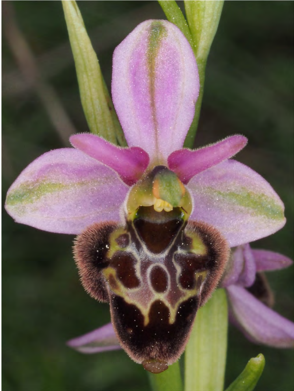
Ophrys bertolonii subsp. bertolonii x Ophrys scolopax subsp. scolopax