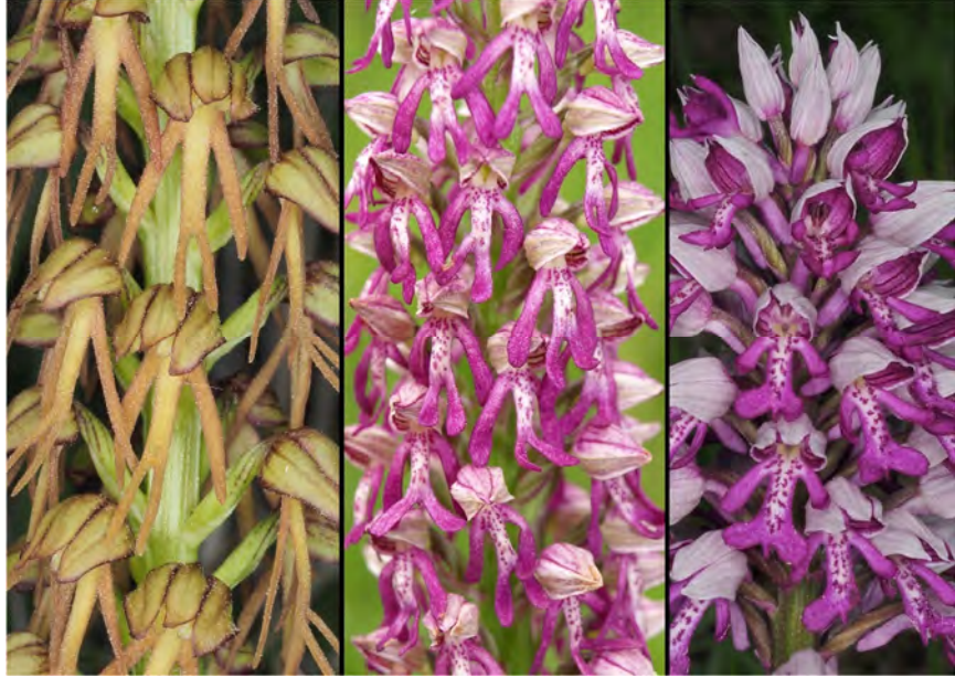
Aceras anthropophorum , Orchis militaris subsp. militaris und Hybride (m)