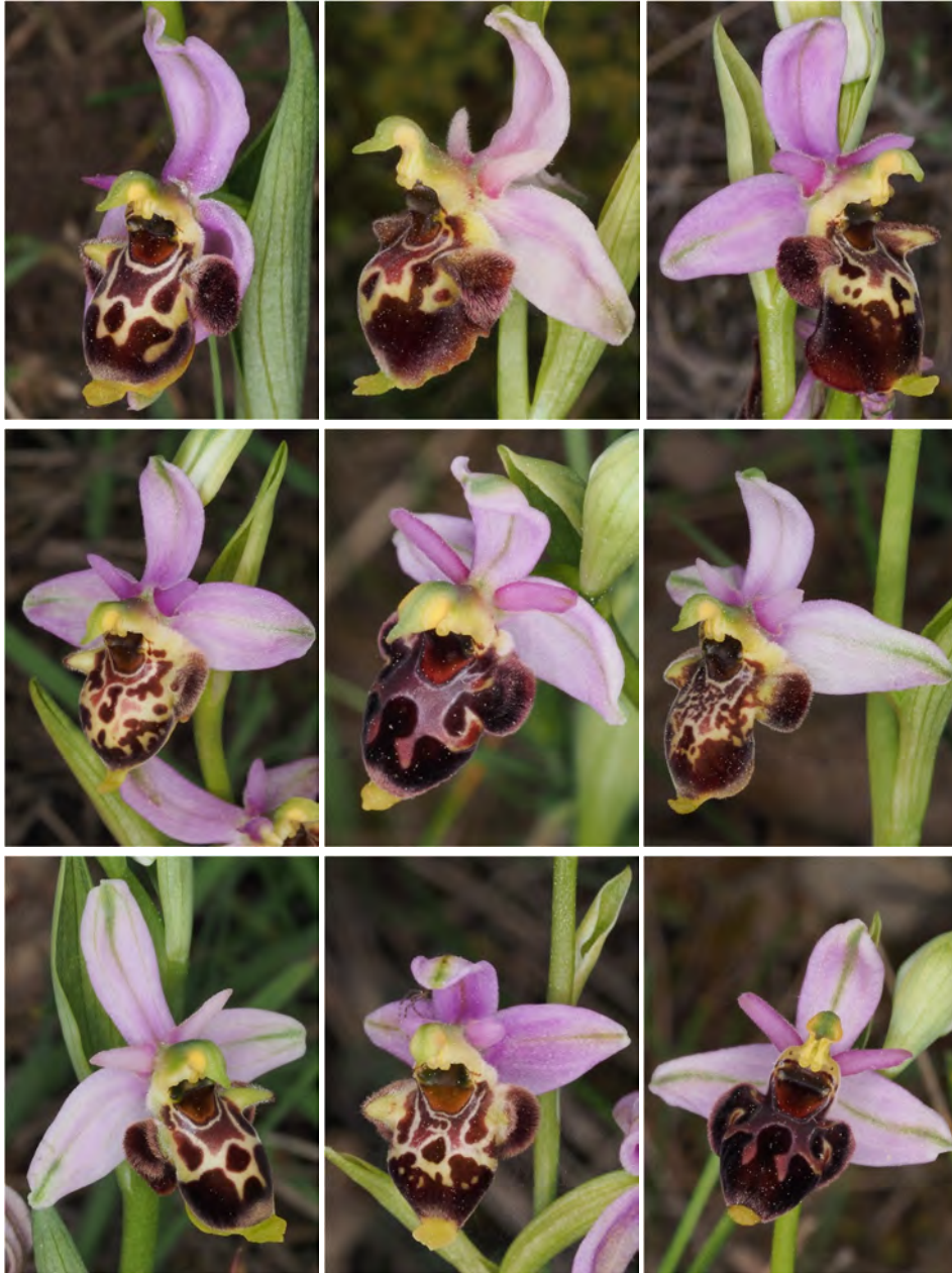
Ophrys holosericea subsp. demangei x Ophrys scolopax subsp. scolopax