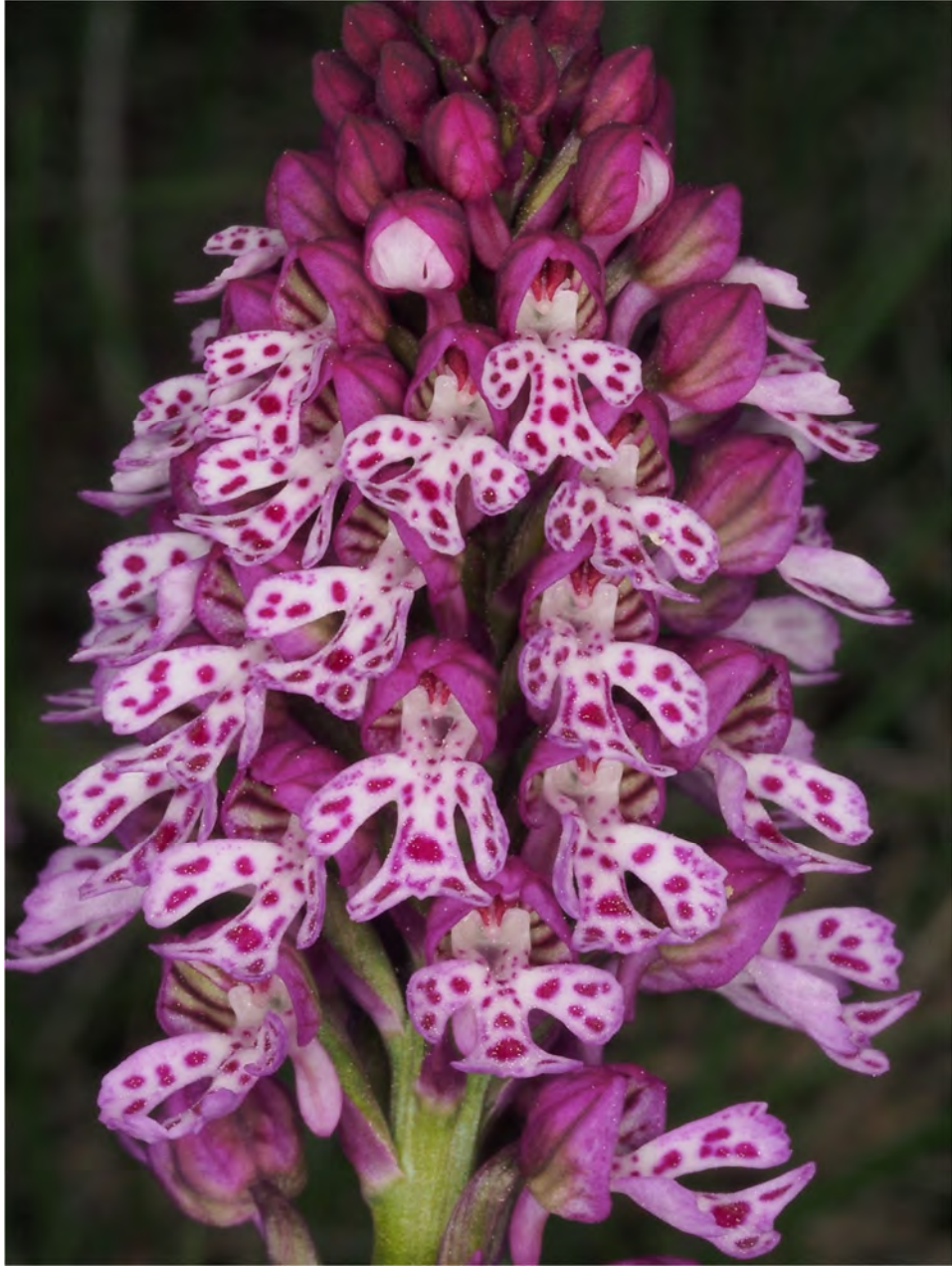
Orchis tridentata subsp. tridentata x Orchis ustulata subsp. ustulata