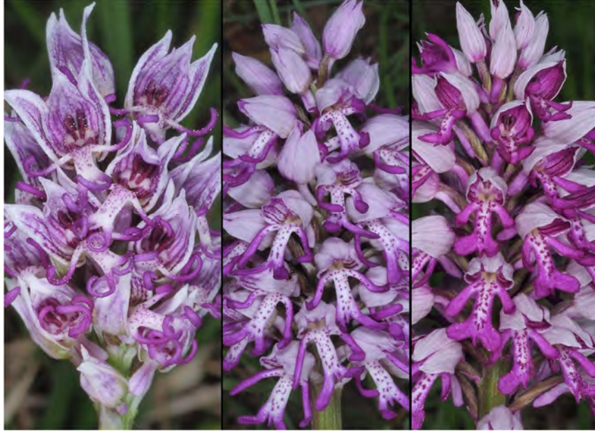
Orchis simia subsp. simia , Orchis militaris subsp. militaris und Hybride (m)