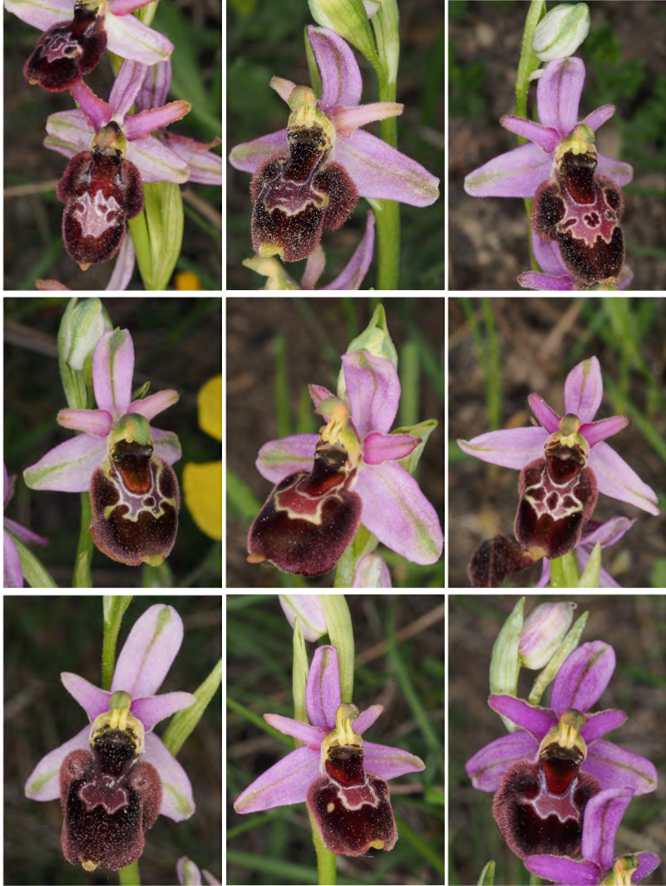
Ophrys holosericea subsp. demangei x Ophrys bertolonii subsp. drumana