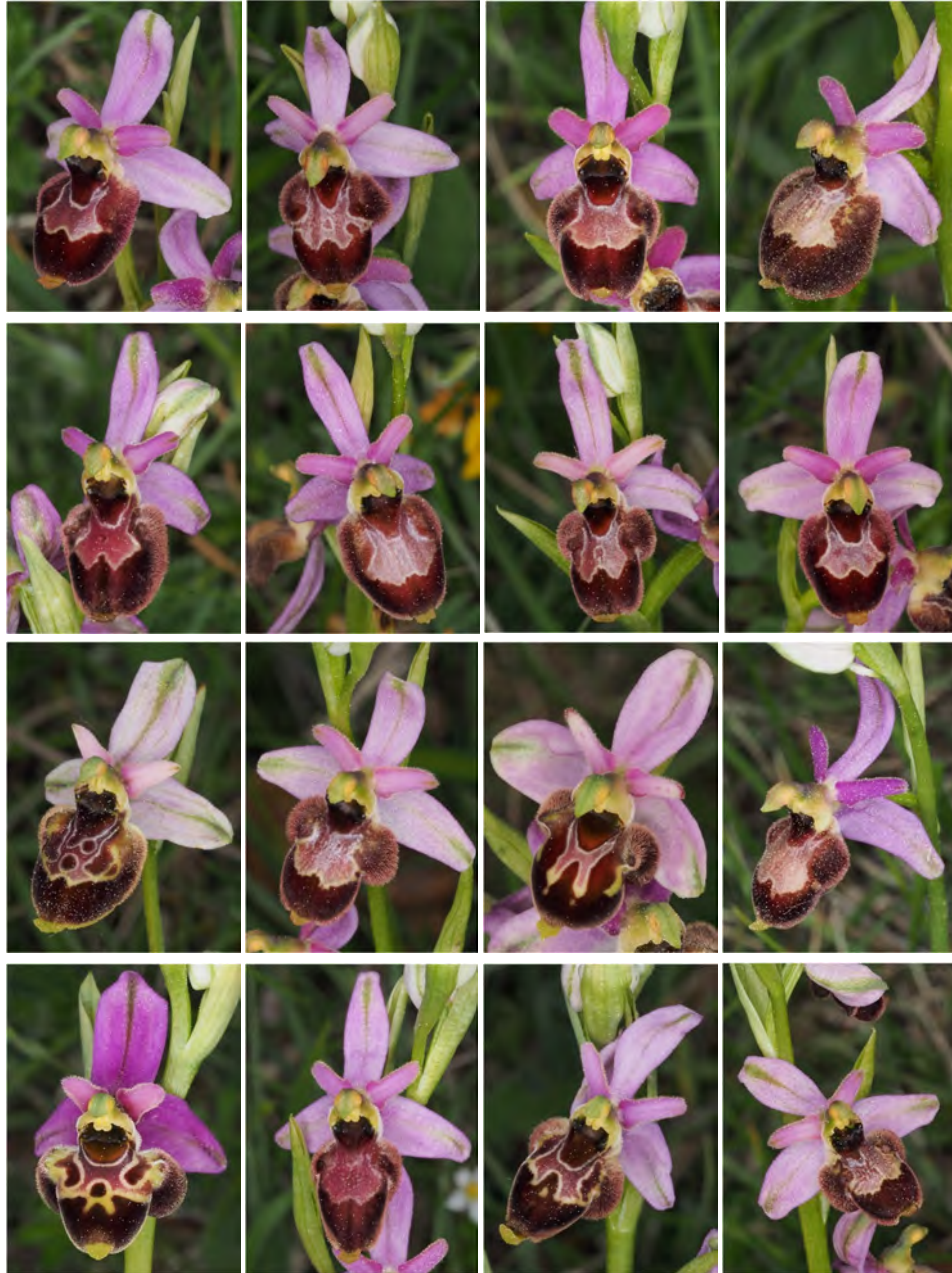
Ophrys bertolonii subsp. bertolonii x Ophrys scolopax subsp. scolopax