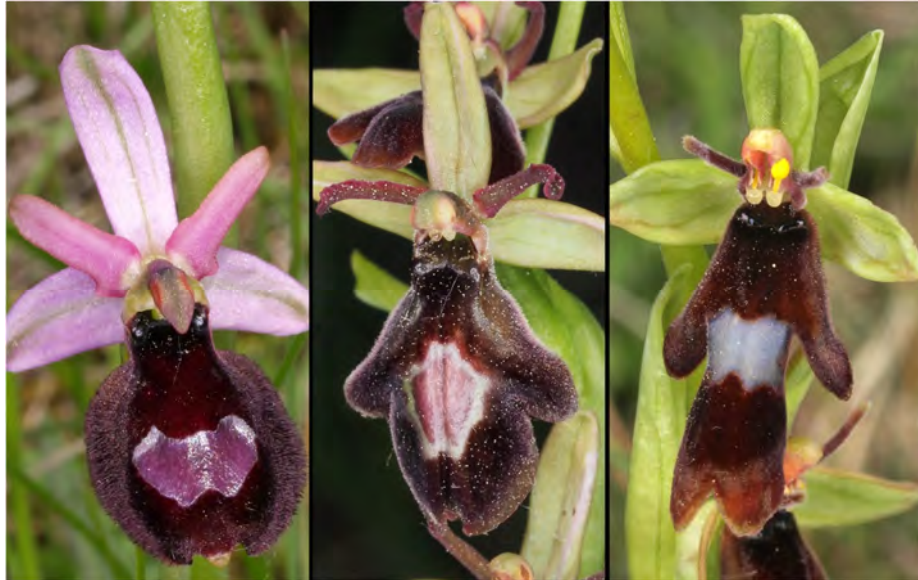
Ophrys bertolonii subsp. drumana , Ophrys insectifera subsp. insectifera und Hybride