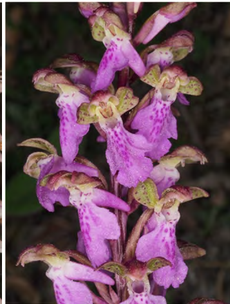
Orchis spitzelii subsp. spitzelii