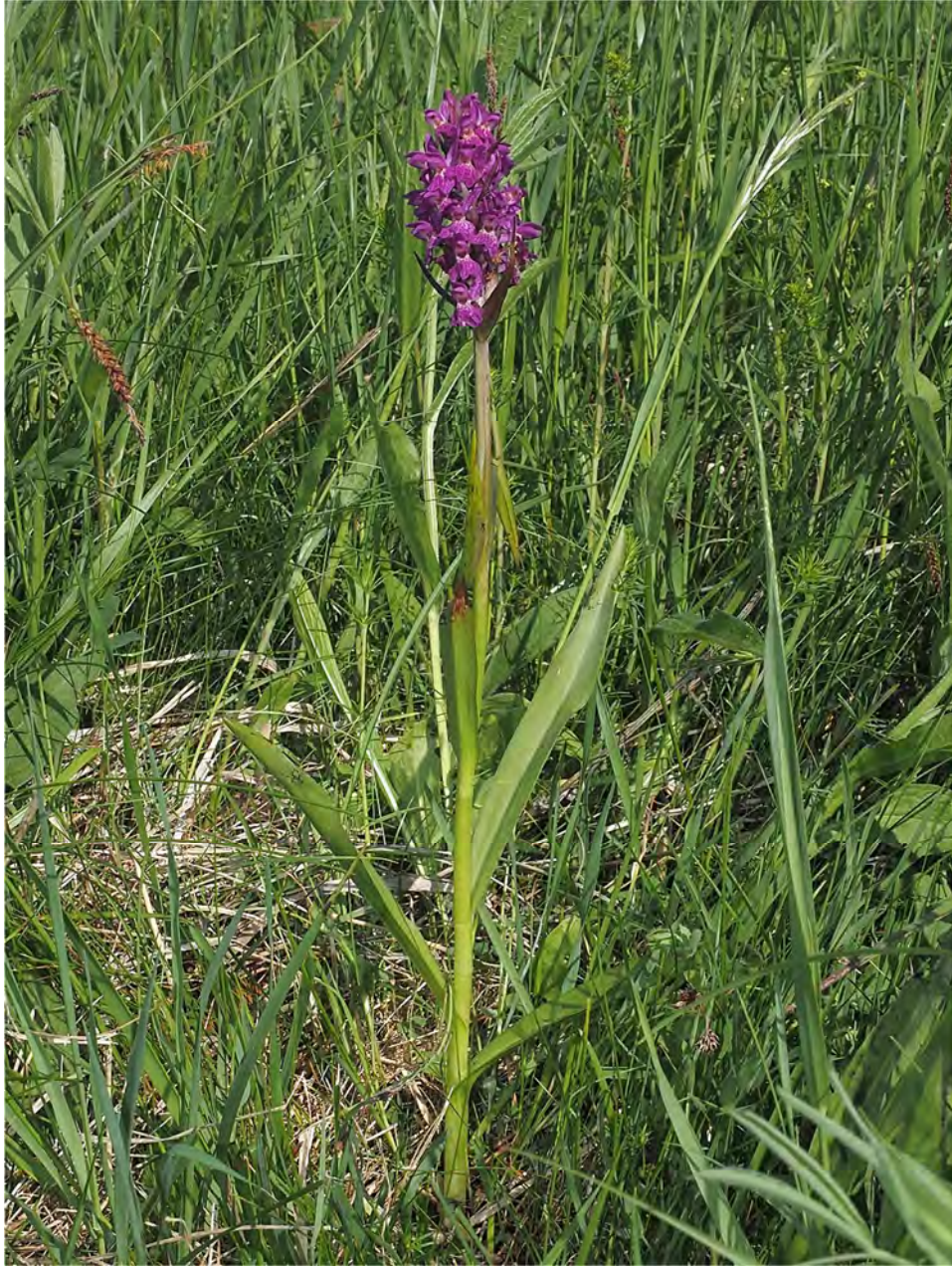
Dactylorhiza maculata subsp. fuchsii x Dactylorhiza sambucina