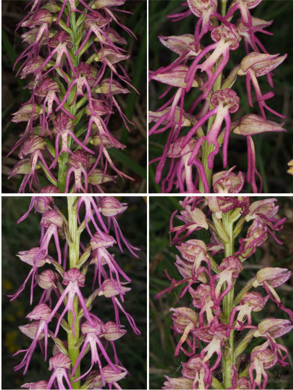
Aceras anthropophorum x Orchis simia subsp. simia