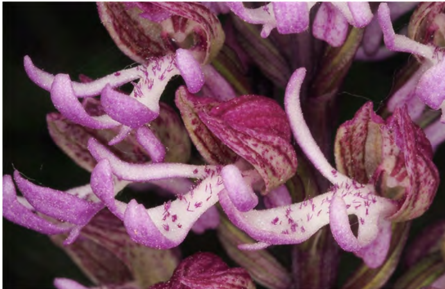
Orchis simia subsp. simia x Orchis purpurea subsp. purpurea