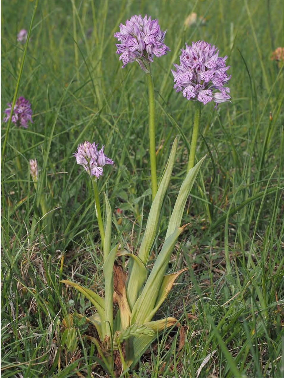
Orchis tridentata subsp. tridentata