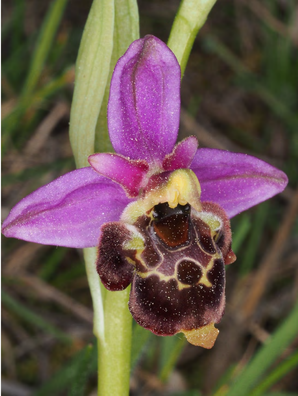
Ophrys holosericea subsp. demangei