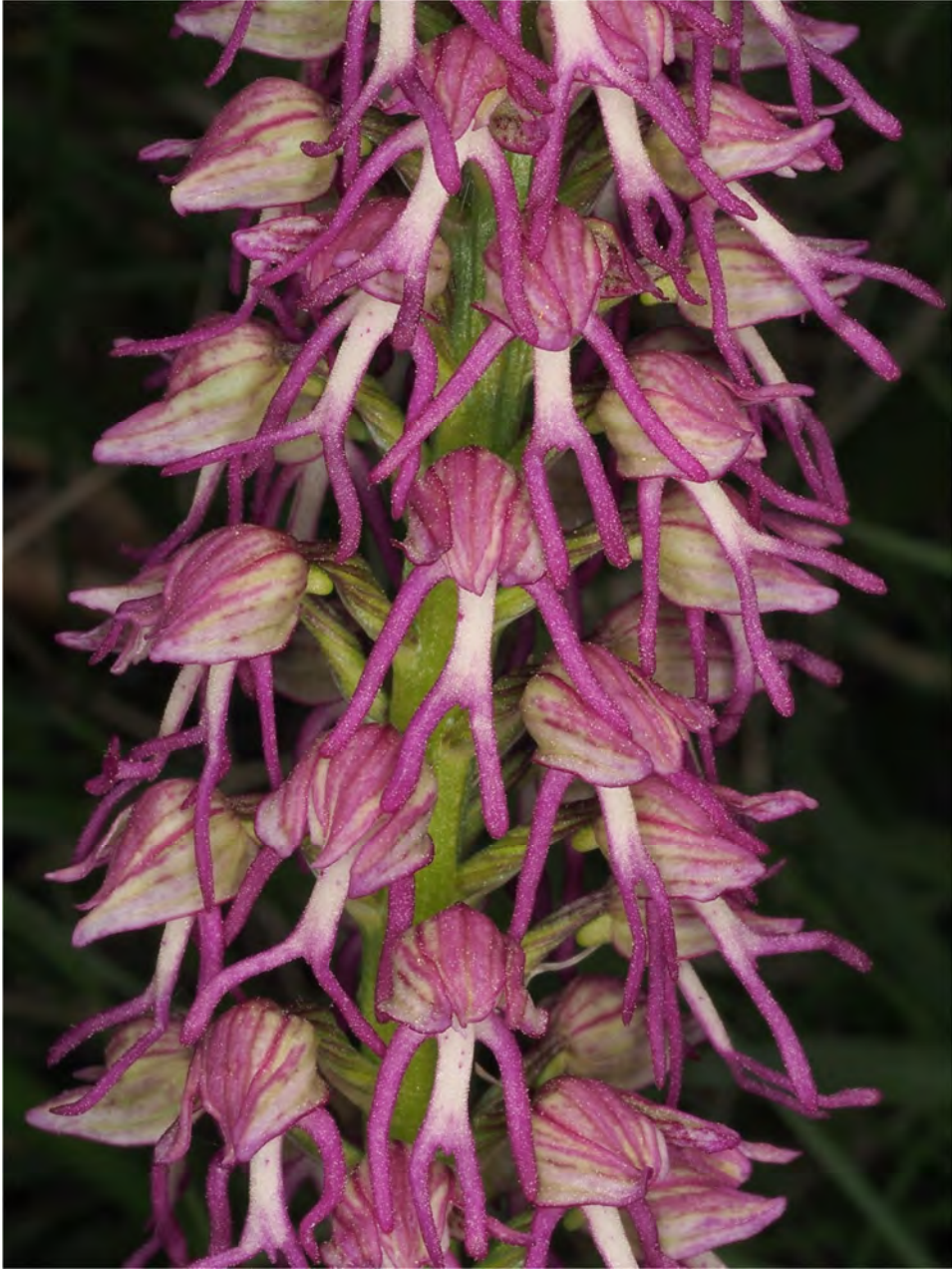
Aceras anthropophorum x Orchis simia subsp. simia