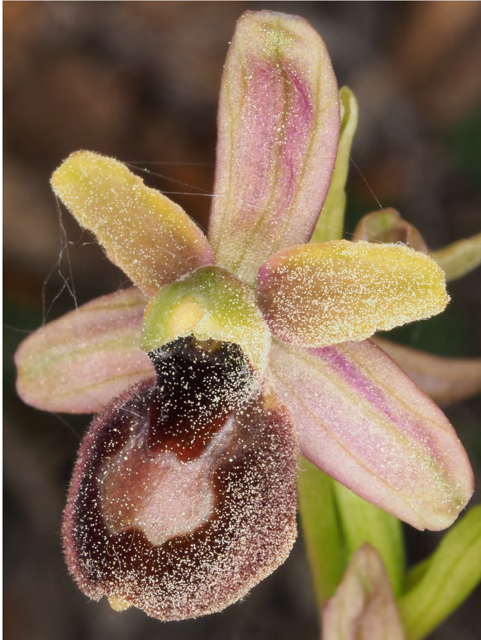
Ophrys bertolonii subsp. drumana x Ophrys araneola