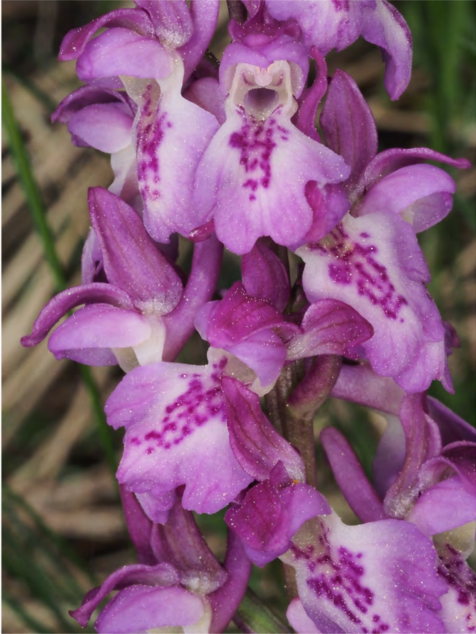
Orchis mascula subsp. mascula x Orchis spitzelii subsp. spitzelii