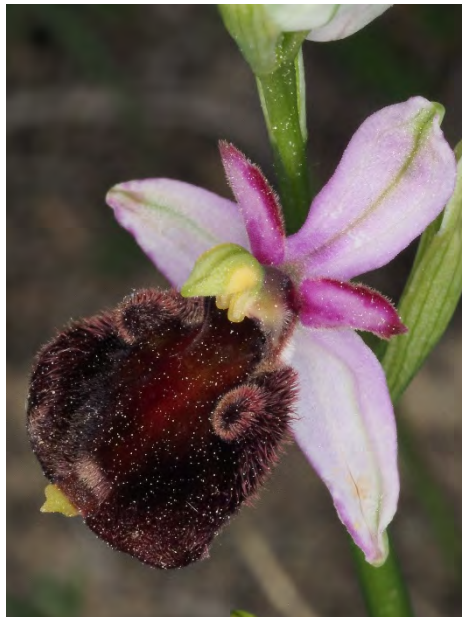
Ophrys holosericea subsp. demangei