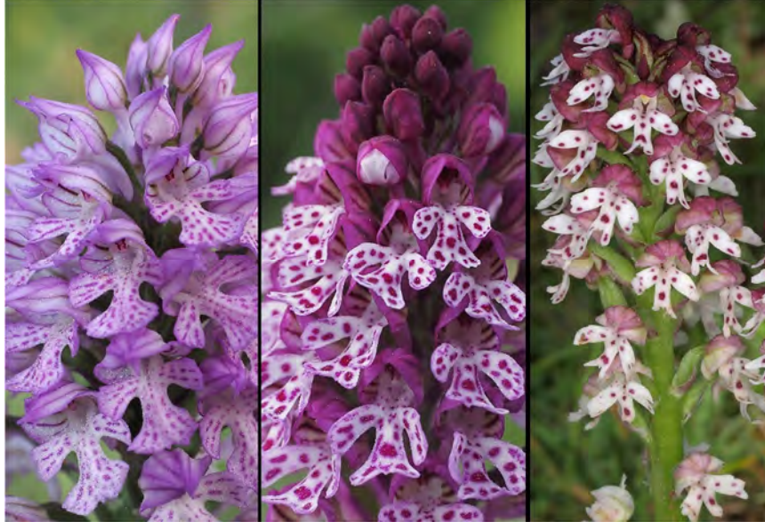
Orchis tridentata subsp. tridentata , Orchis ustulata subsp. ustulata und Hybride