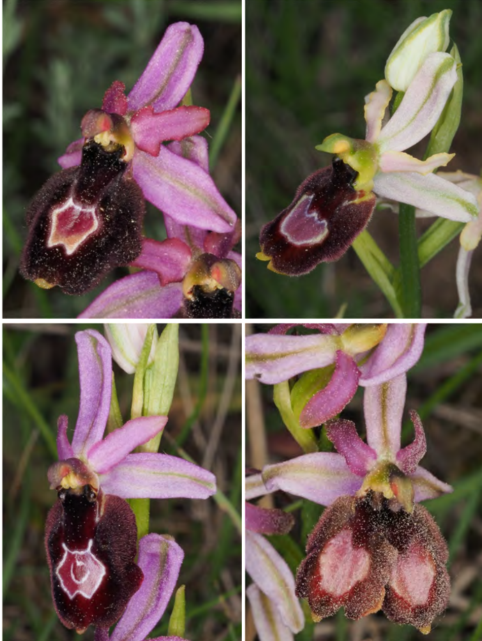
Ophrys bertolonii subsp. drumana