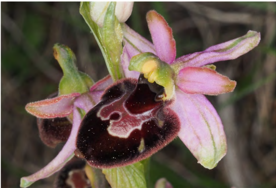
Ophrys holosericea subsp. demangei x Ophrys bertolonii subsp. drumana