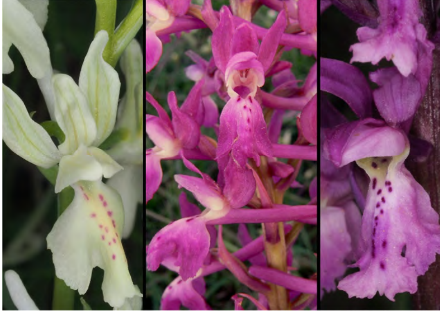
Orchis provincialis , Orchis mascula subsp. mascula und Hybride (m)