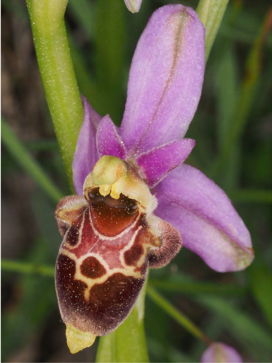
Ophrys scolopax subsp. scolopax