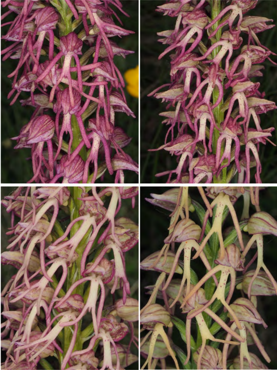
Aceras anthropophorum x Orchis simia subsp. simia