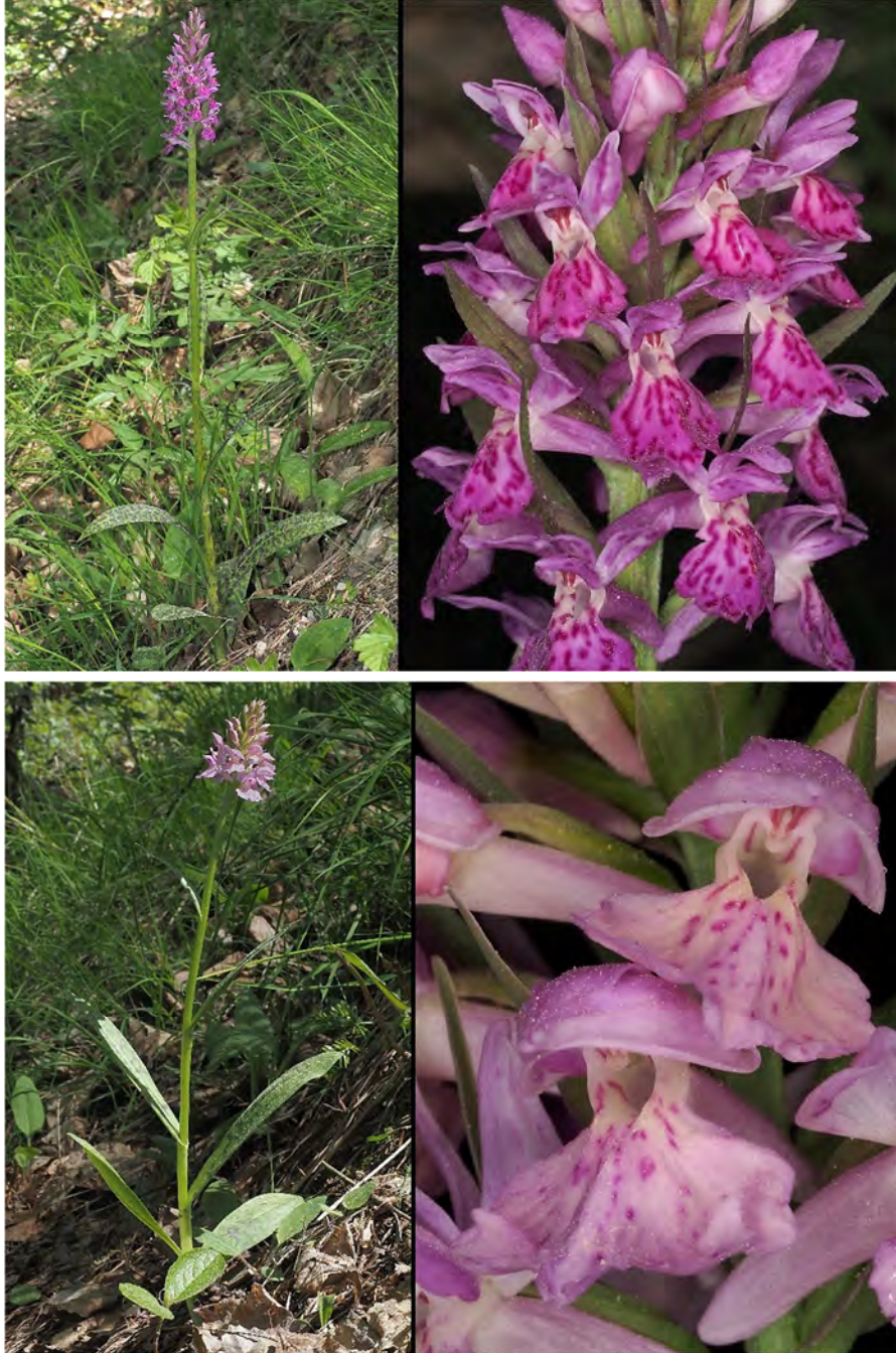
Dactylorhiza maculata subsp. fuchsii x Dactylorhiza sambucina