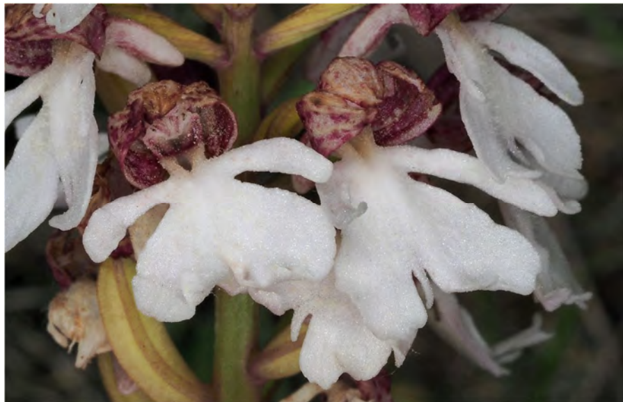
Orchis purpurea subsp. purpurea