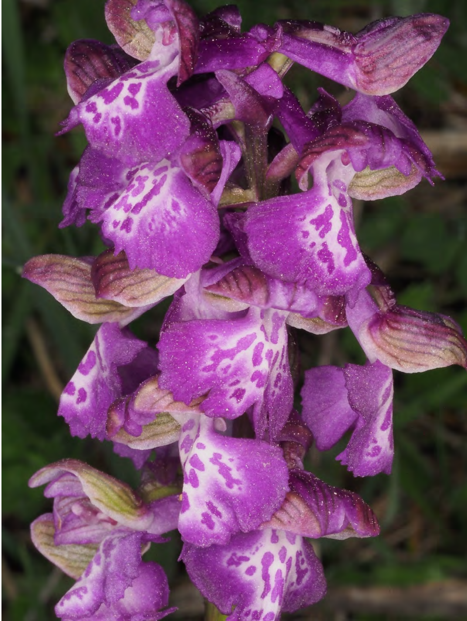
Orchis morio subsp. morio