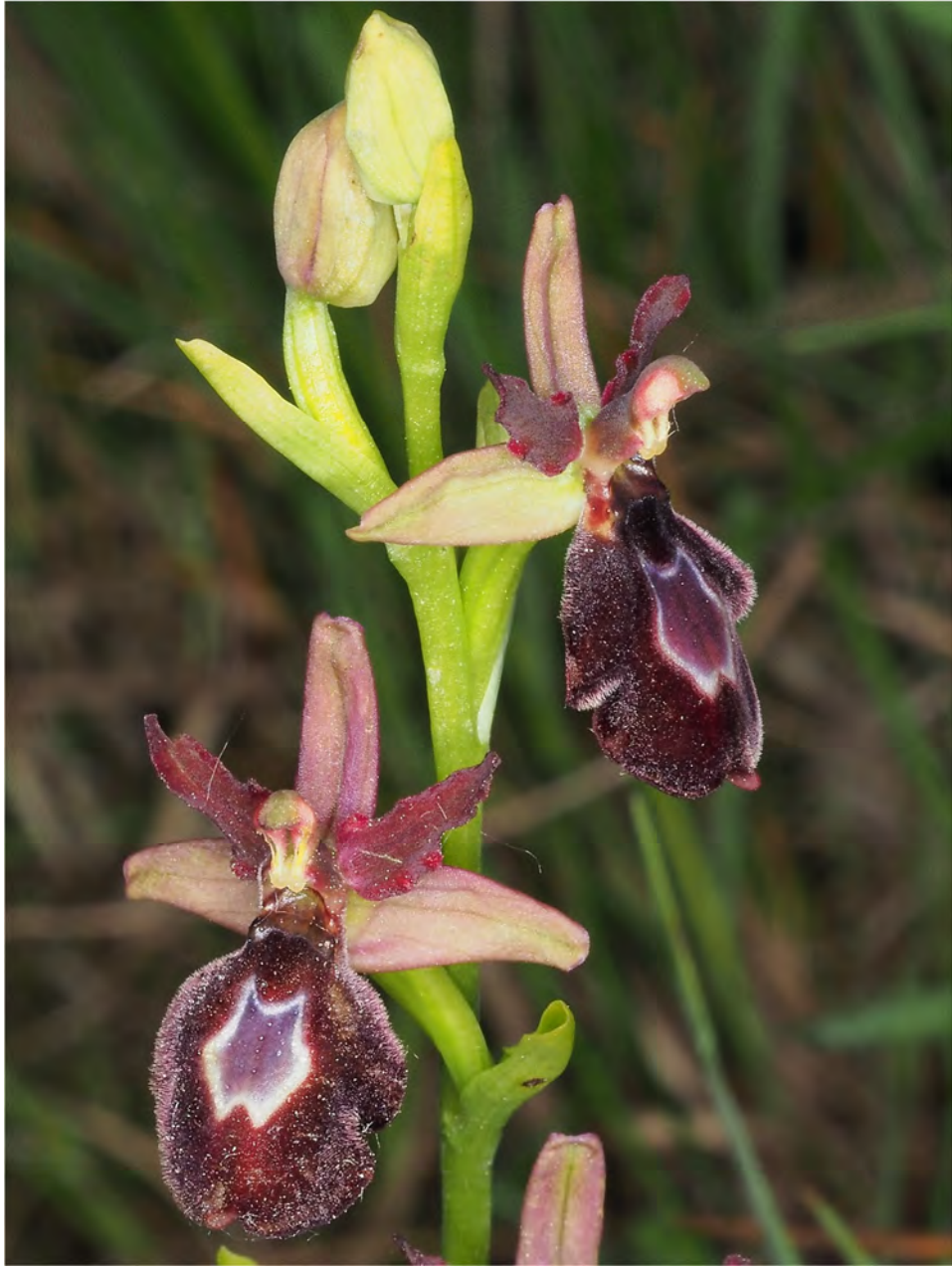
Ophrys bertolonii subsp. drumana x Ophrys insectifera subsp. insectifera