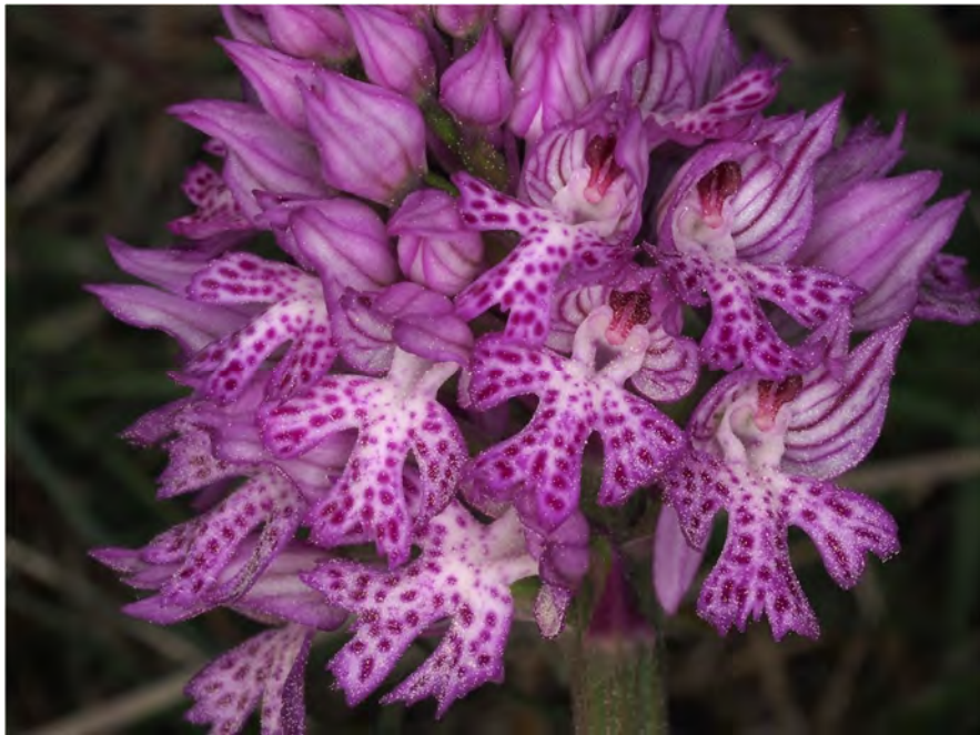
Orchis tridentata subsp. tridentata x Orchis ustulata subsp. ustulata