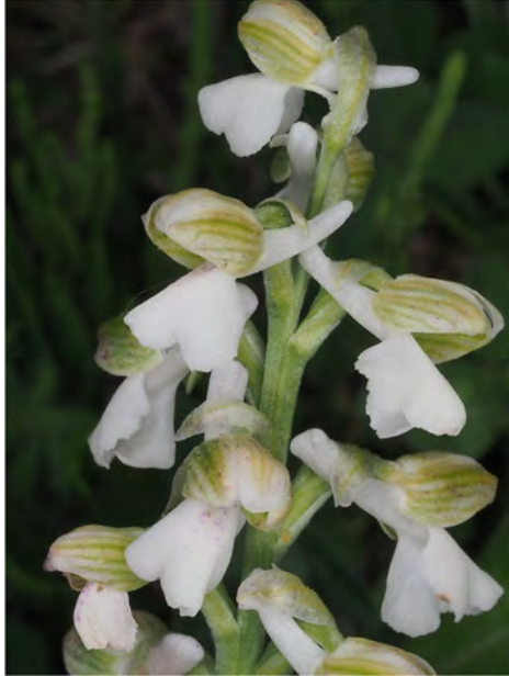
Orchis morio subsp. morio