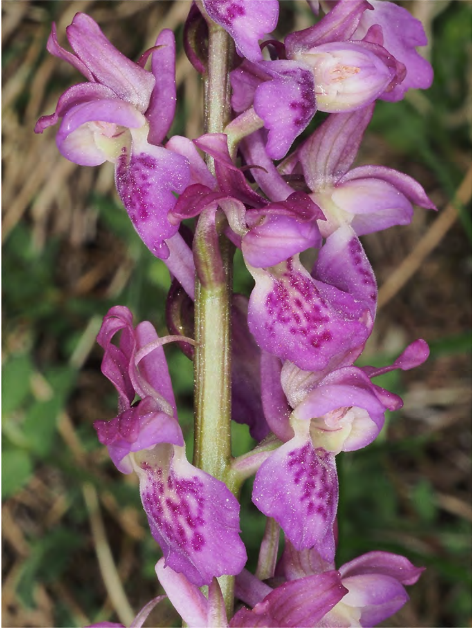
Orchis mascula subsp. mascula x Orchis spitzelii subsp. spitzelii