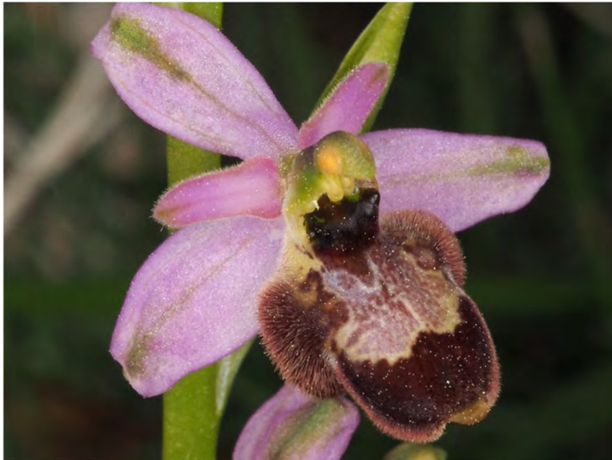
Ophrys bertolonii subsp. bertolonii x Ophrys scolopax subsp. scolopax