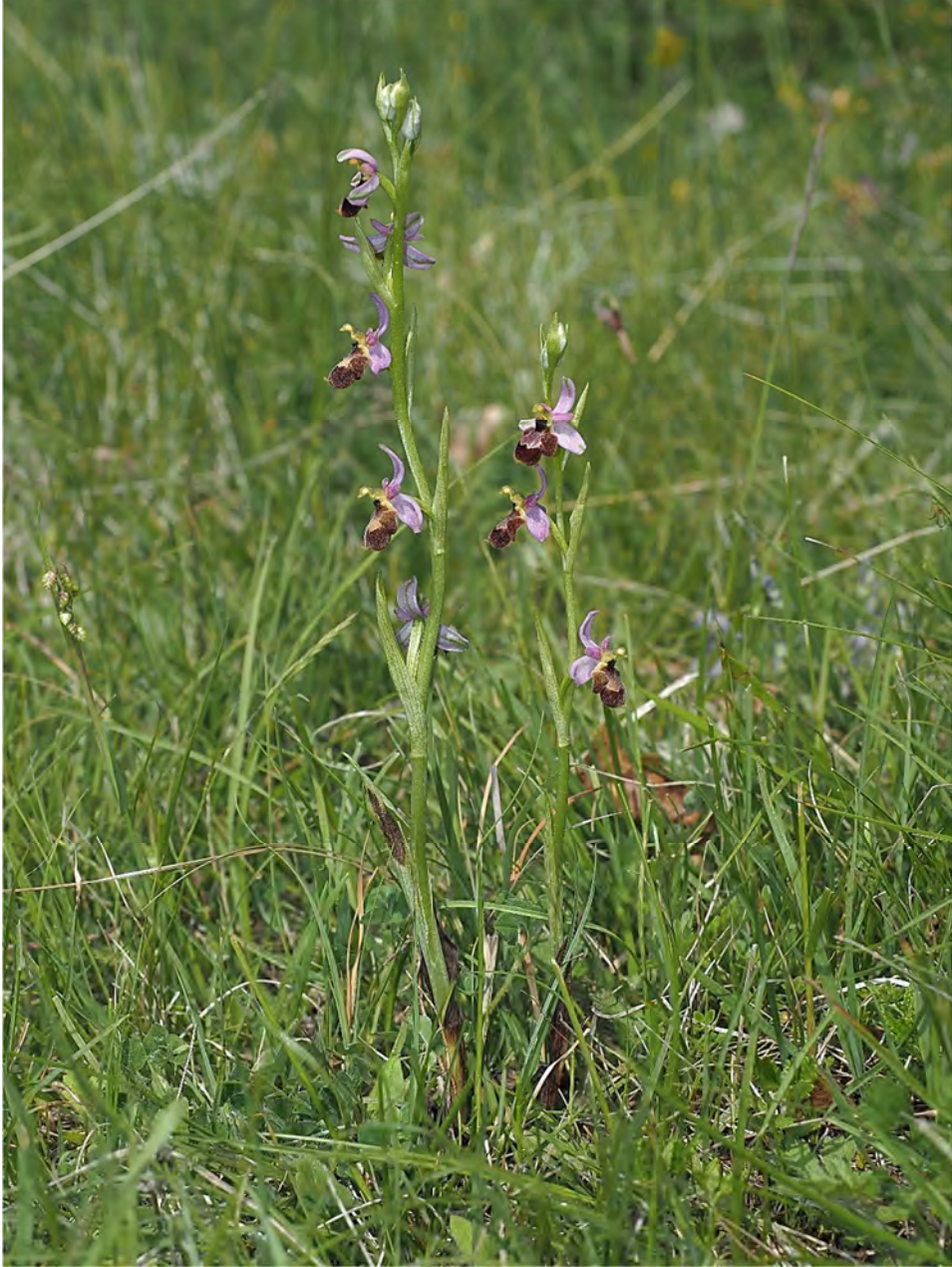
Ophrys bertolonii subsp. bertolonii x Ophrys scolopax subsp. scolopax