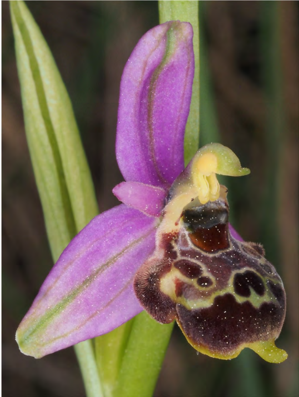
Ophrys holosericea subsp. demangei x Ophrys apifera