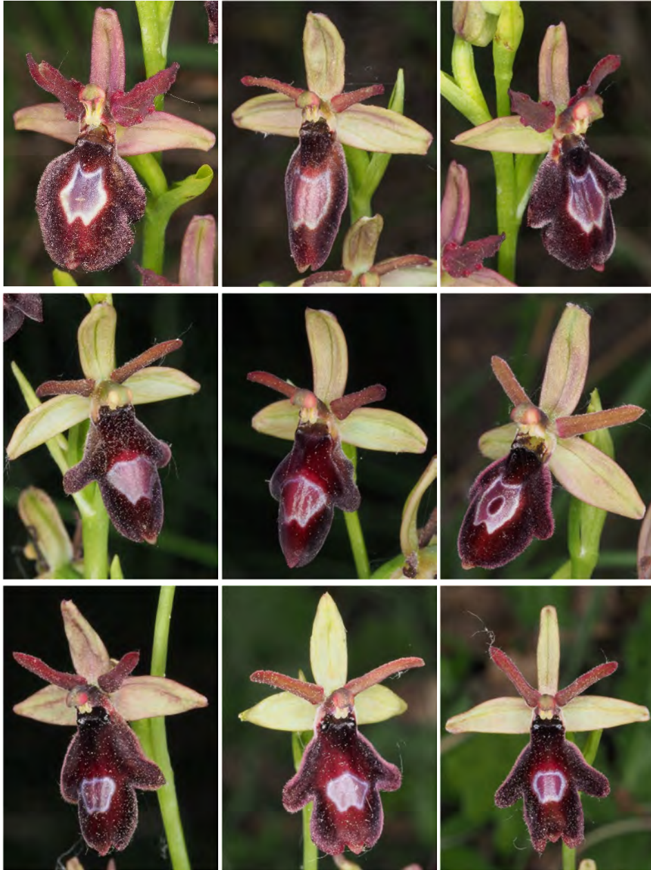
Ophrys bertolonii subsp. drumana x Ophrys insectifera subsp. insectifera