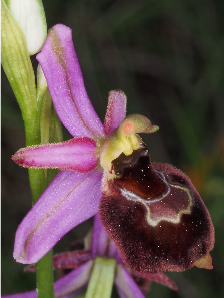
Ophrys holosericea subsp. demangei x Ophrys bertolonii subsp. drumana