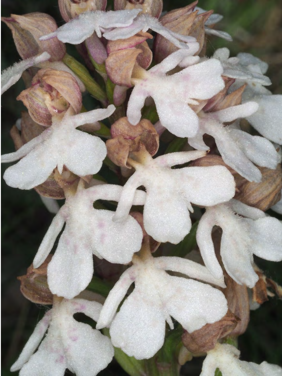
Orchis purpurea subsp. purpurea