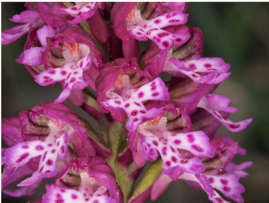
Orchis tridentata subsp. tridentata x Orchis ustulata subsp. ustulata