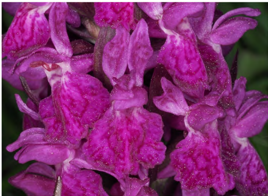
Dactylorhiza majalis subsp. majalis x Dactylorhiza sambucina