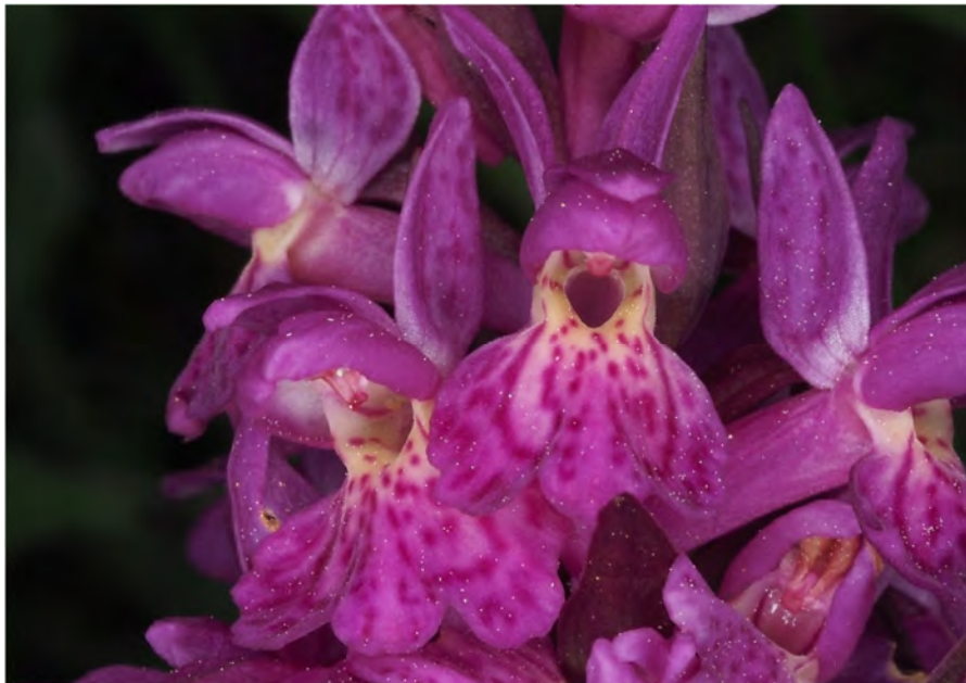
Dactylorhiza maculata subsp. fuchsii x Dactylorhiza sambucina