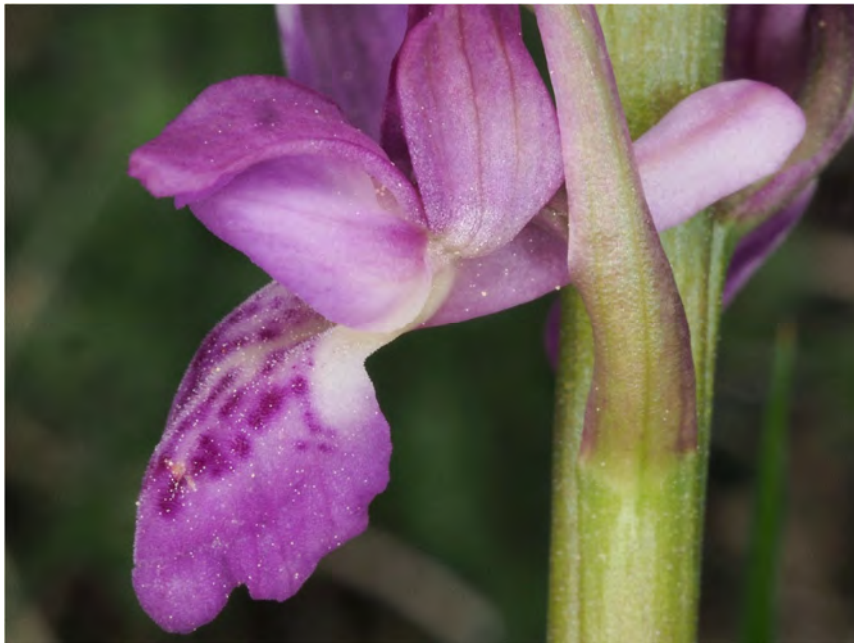
Orchis mascula subsp. mascula x Orchis spitzelii subsp. spitzelii