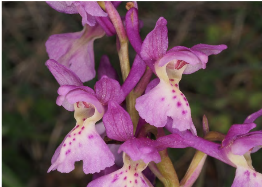
Orchis provincialis x Orchis mascula subsp. mascula