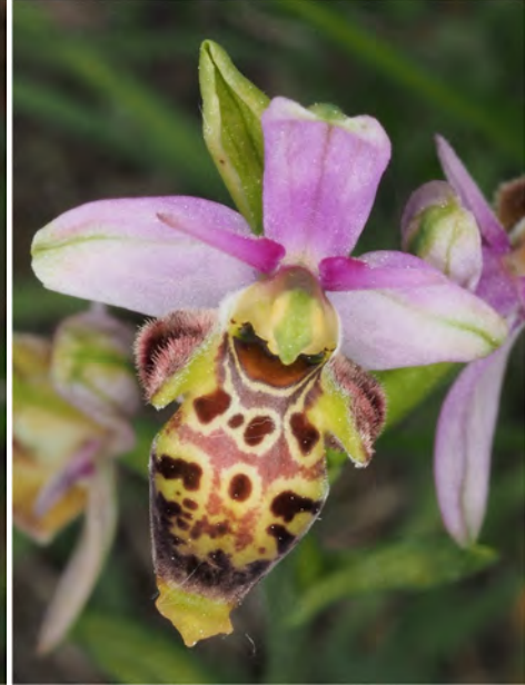
Ophrys scolopax subsp. scolopax