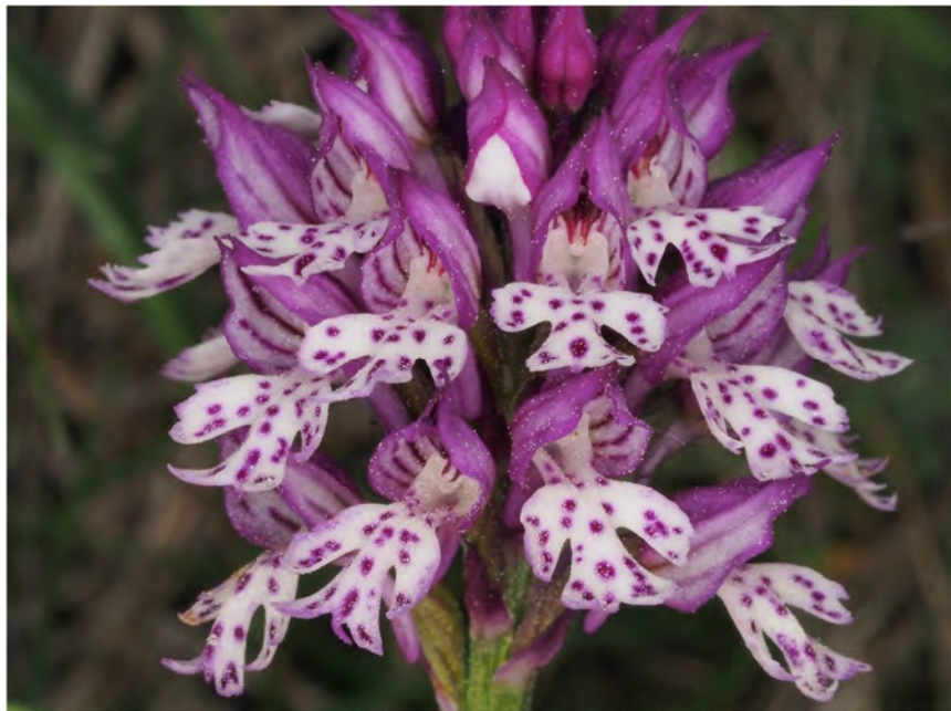
Orchis tridentata subsp. tridentata x Orchis ustulata subsp. ustulata