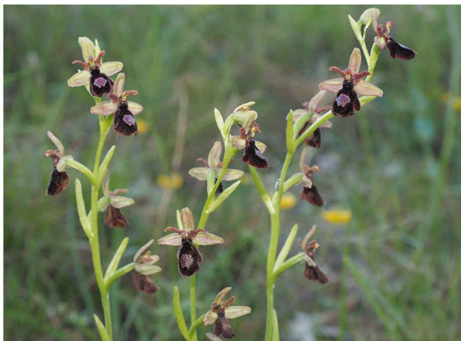
Ophrys bertolonii subsp. drumana x Ophrys insectifera subsp. insectifera