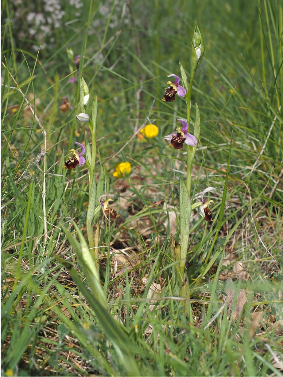
Ophrys scolopax subsp. scolopax x Ophrys holosericea subsp. holosericea