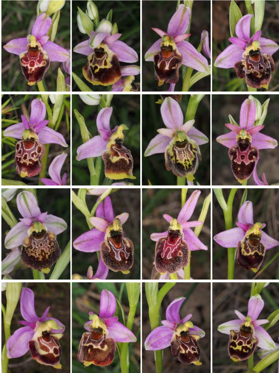
Ophrys holosericea subsp. demangei