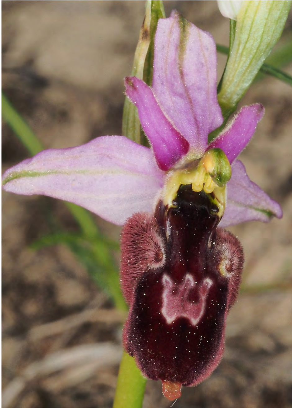
Ophrys holosericea subsp. demangei x Ophrys bertolonii subsp. drumana „Maserati-Ragwurz“