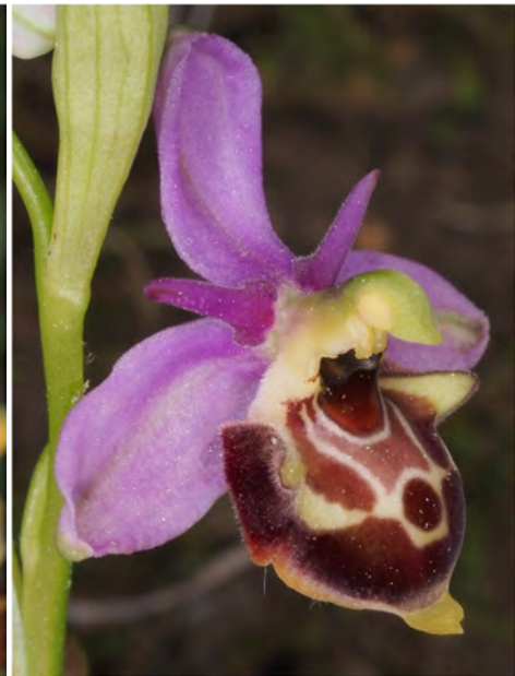
Ophrys holosericea subsp. demangei x Ophrys scolopax subsp. scolopax