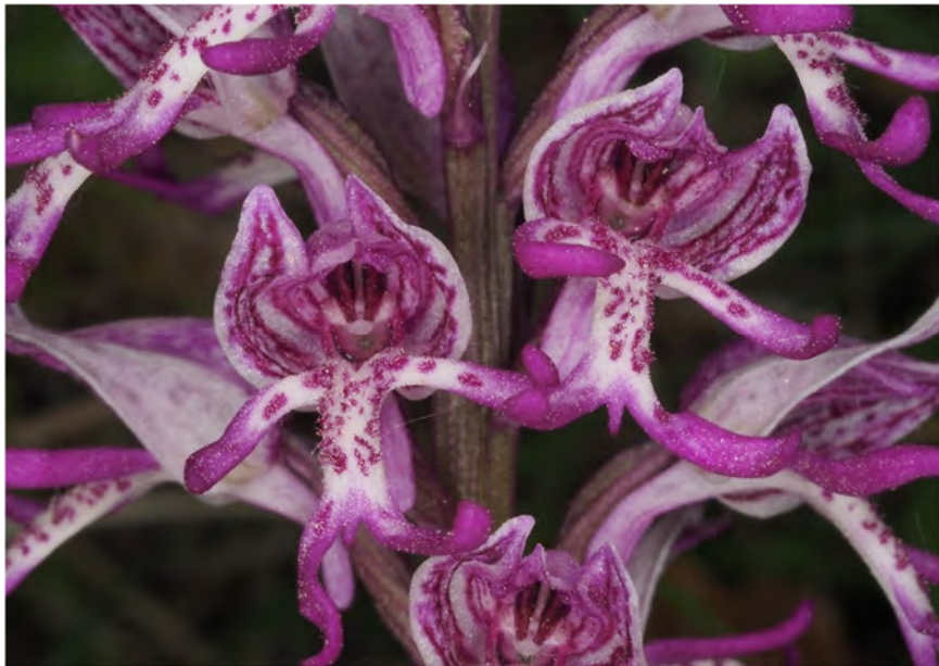
Orchis simia subsp. simia x Orchis militaris subsp. militaris