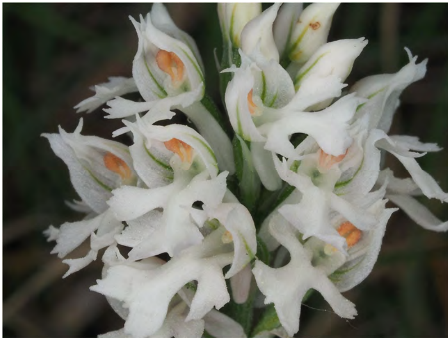
Orchis tridentata subsp. tridentata