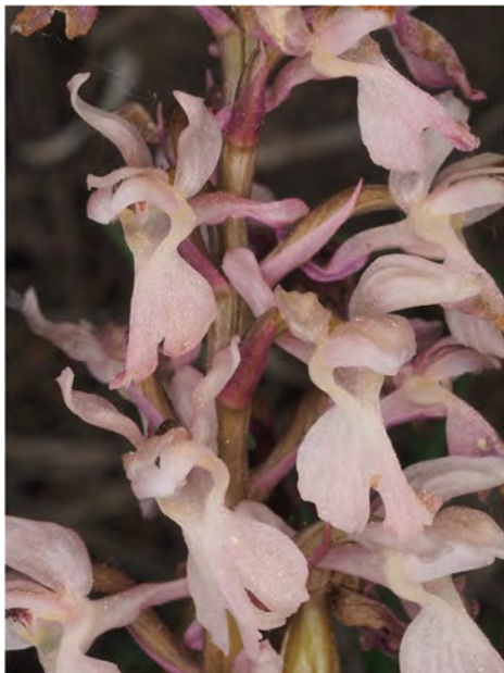
Orchis mascula subsp. mascula