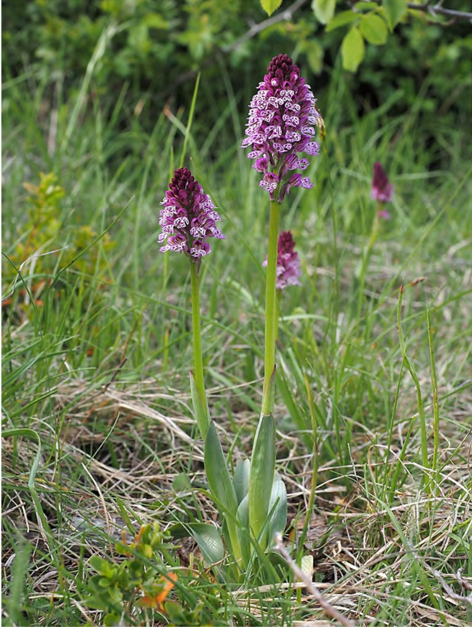
Orchis tridentata subsp. tridentata x Orchis ustulata subsp. ustulata