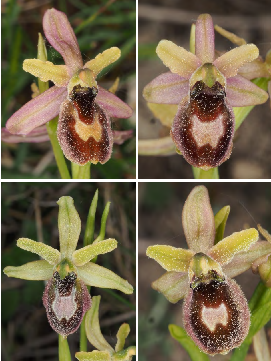
Ophrys bertolonii subsp. drumana x Ophrys araneola