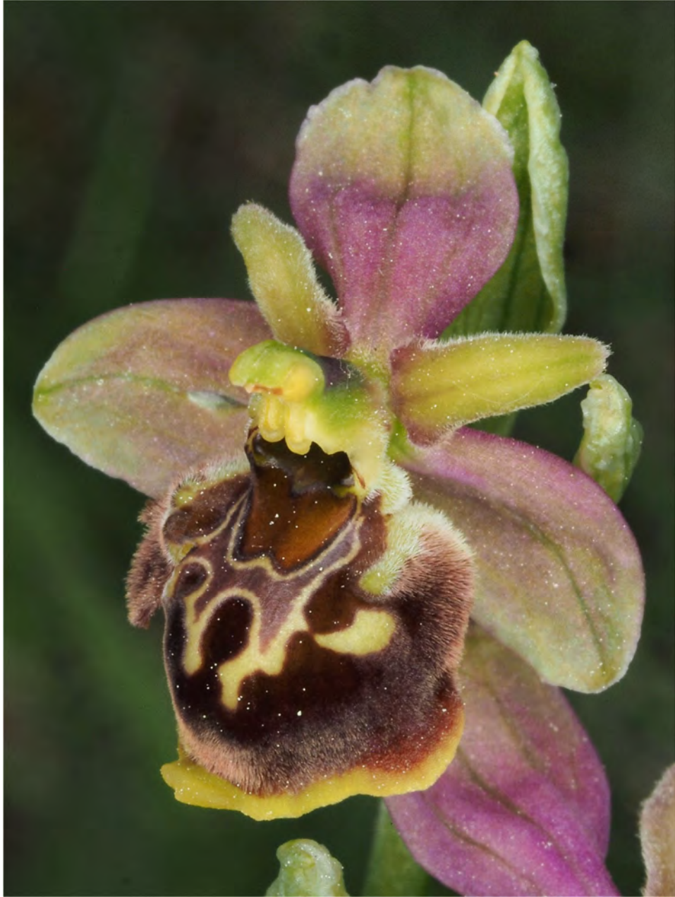
Ophrys holosericea subsp. demangei