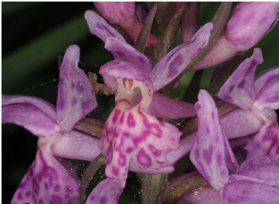
Dactylorhiza maculata subsp. fuchsii x Dactylorhiza sambucina