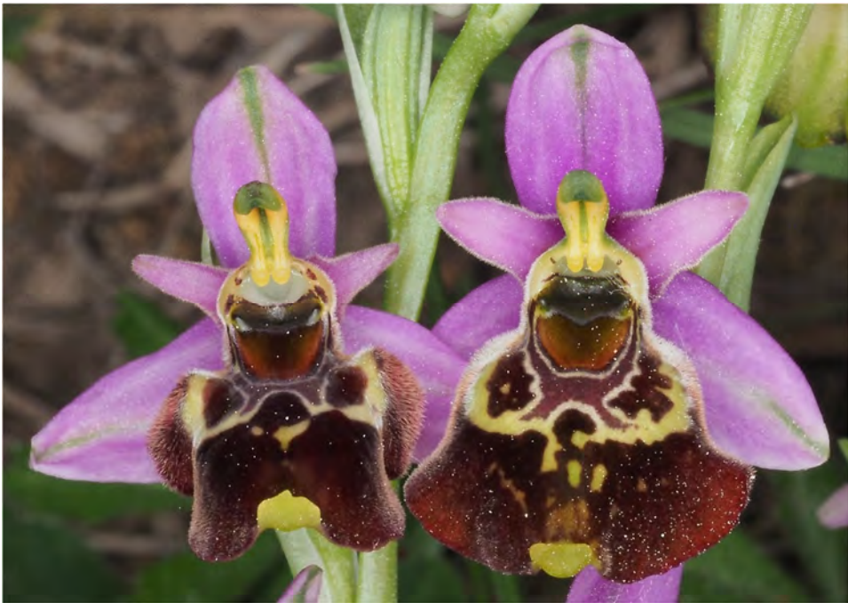
Ophrys holosericea subsp. demangei und Ophrys holosericea subsp. holosericea ?