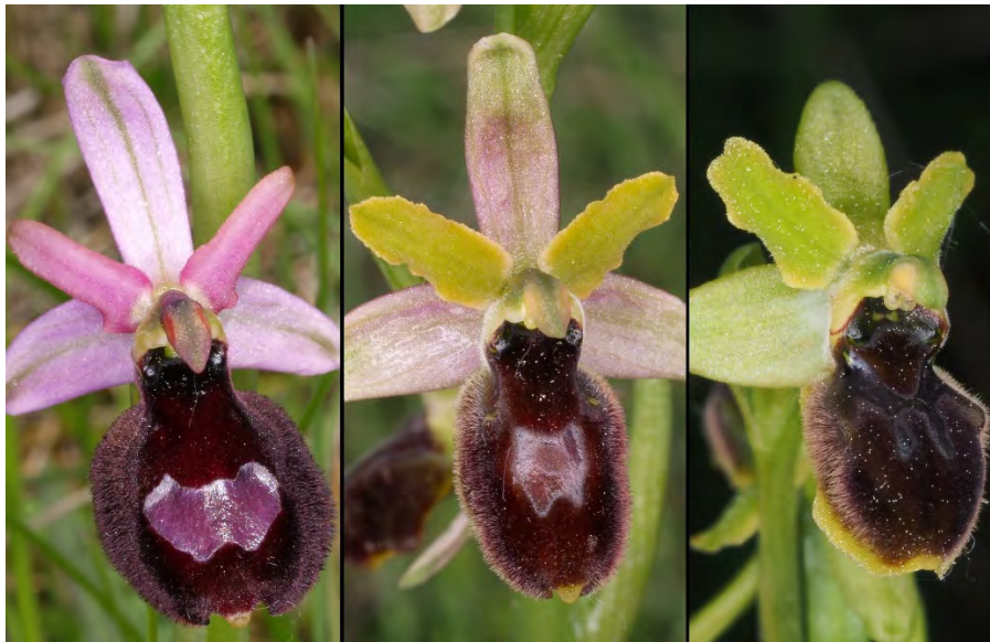
Ophrys bertolonii subsp. drumana , Ophrys araneola und Hybride (m)