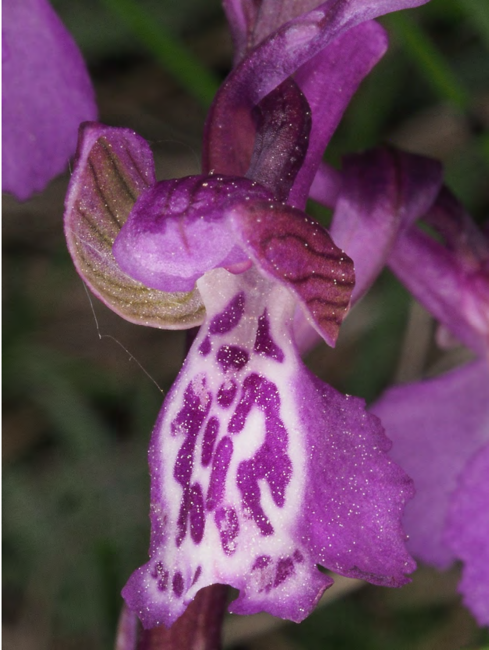
Orchis morio subsp. morio