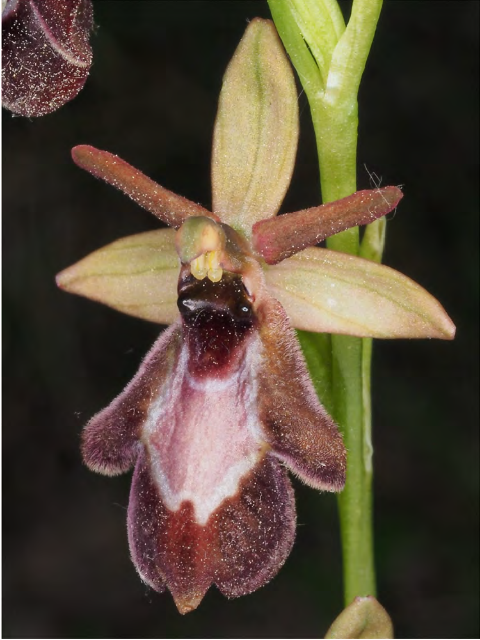
Ophrys bertolonii subsp. drumana x Ophrys insectifera subsp. insectifera