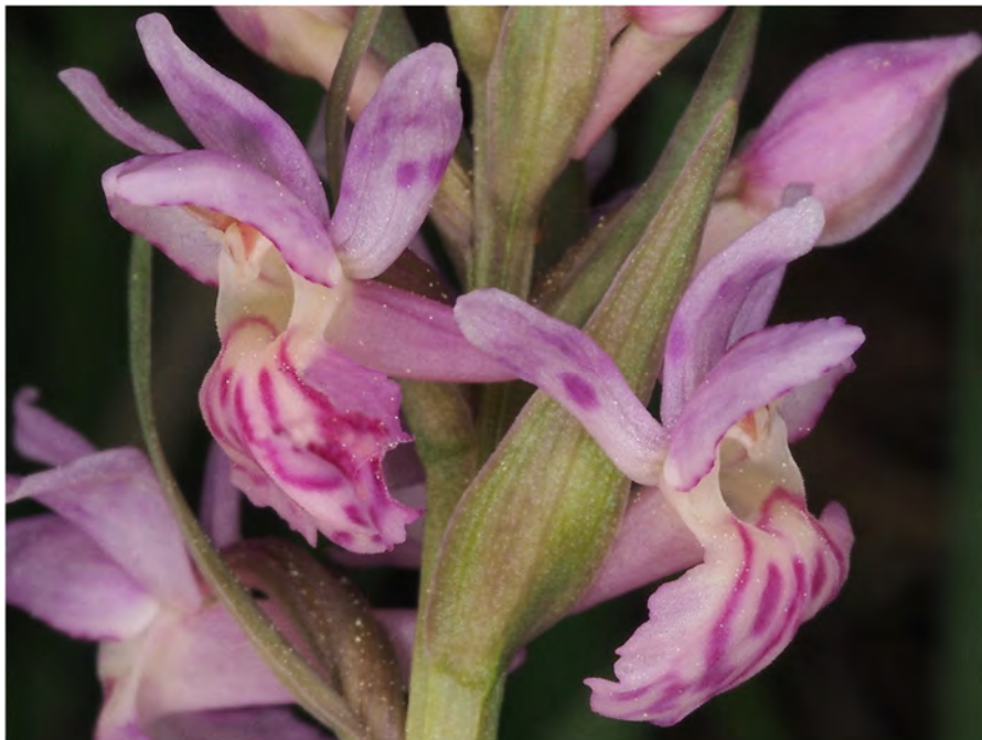
Dactylorhiza maculata subsp. fuchsii x Dactylorhiza sambucina