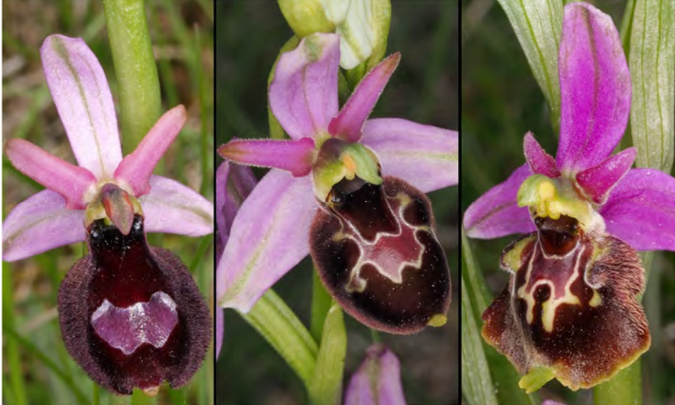
Ophrys bertolonii subsp. drumana , Ophrys holosericea subsp. demangei und Hybride