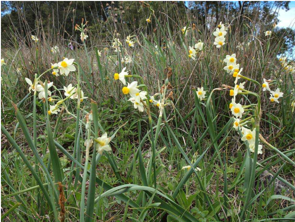
Die Tazette mag's nass

blüht. Ein insgesamt schönes Gelände ist das, die Suche macht Spaß, so muss das sein.