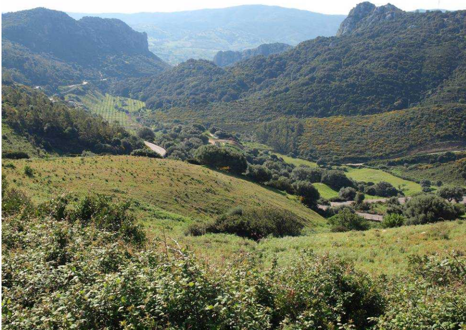
Sardinien ist eine Gebirgsinsel. Blick vom Monte Alba nach Osten

es ersetzt. Sie ist nicht nur erheblich breiter geworden (gemeint ist natürlich der Bildschirm!). Auch alle 42 Länder in und um Europa herum sind bereits im Speicher, so dass das lästige Speicherkartenwechseln jetzt entfällt. Dass unsere neue Lisa auch sonst noch mehr kann und uns beispielsweise vor stationären Radaranlagen warnt, ist zudem prima. Dann endlich geht die Fahrt los zu unserem ersten Exkursionsziel. Das Thermometer zeigt angenehme 17 Grad, der Himmel ist leicht bewölkt. Dem Wetterbericht nach sollte es zumindest die nächsten 4 Tage nicht regnen. Wenn das tatsächlich so käme, hätten wir dann schon mehr regenfreie Tage als während der gesamten Sizilienreise letztes Jahr. Wäre natürlich schön, wenn wir unseren Vorrat an Tempo-Taschentüchern nicht vollständig zum Abtrocknen nasser Orchideenblüten verschwenden müssten.