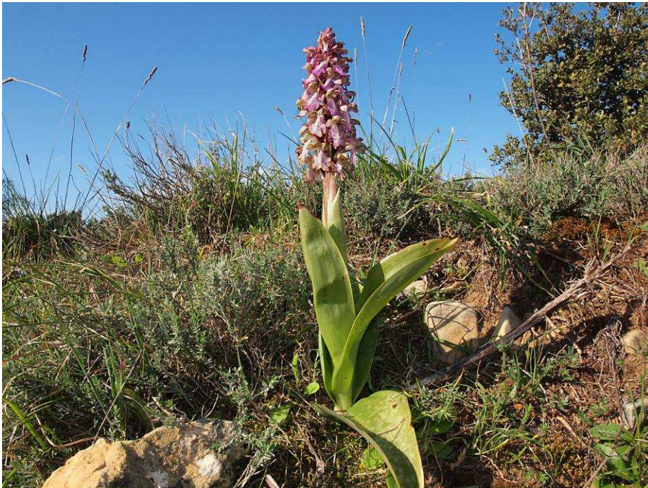
Barlia robertiana ist eine stattliche Orchidee