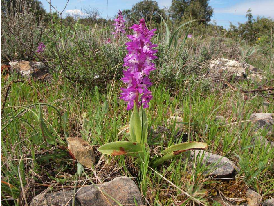
Orchis mascula subsp. ichnusae , Endemit Sardiniens

viele Orchideen auf so kleiner Fläche, das haben wir selten gesehen. Insbesondere Ophrys tenthredinifera subsp. neglecta steht hier zu Tausenden! Und auch Zungenständel fühlen sich sau wohl hier. Mit Ausnahme von Serapias neglecta und Serapias vomeracea , die insgesamt auf Sardinien sehr selten sein